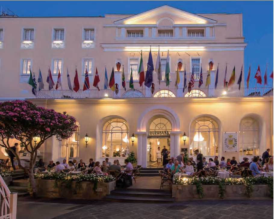
淡い黄色の建物に各国の旗が並ぶグランドホテル・クイシサーナのエントランス