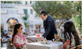
バーのテラスで優雅に過ごす贅沢はいかがでしょう（イメージ）