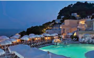
海を望むプールサイド（イメージ）

1860年の開業より、ヘミングウェイやサルトルなどの著名人が訪れたことでも知られるカプリの代名詞といえるホテルです。淡い黄色の外観、色鮮やかな生け花が香るロビー、そして気品感じるスタッフの対応、すべてが気持ちをゆったりとさせてくれます。名だたるゲストが宿泊してきた伝統が今も引き継がれていますが、肩肘張ることなくカプリに流れる時間を満喫できるのがこのホテルの魅力。カプリ地区の中心であるウンベルト1世広場の近くに位置していますので、ショッピングも楽しめます。