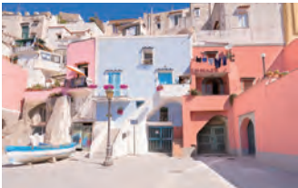
おとぎの世界のようなパステルカラーの家々

プロチーダ島は 1994年の映画「イル・ポストイーノ」の舞台になり、小さな漁村に狭い道、そして三輪車や小さなバスが走るイタリアの田舎風情が世界に注目されました。この島を歩くと、時間が止まっているかのような錯覚を覚えます。