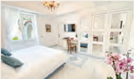
館内、客室は白を基調とした明るいインテリアです（イメージ）