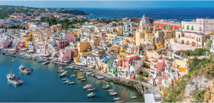
カラフルな家々が連なる様子をジオラマのように見渡せる展望台へ（イメージ）