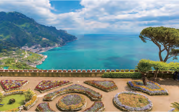
海を見下ろすラヴェッロのルーフォロ荘は、かつてワーグナーも訪れました（イメージ）