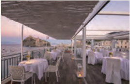
アラゴン城と海を望む絶好のロケーションに建つホテルです（イメージ）

イスキア島の東海岸、歴史的な風情が漂う広がるイスキア・ポンテ地区にの海沿いに位置するホテル。「海と城を望む」という名の通り、敷地のテラスからは海に浮かぶようなアラゴン城の景色をご覧ください。温泉が湧くイスキア島らしく、スパ施設も充実しています。