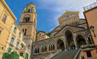
アマルフィの大聖堂