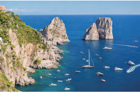
カプリ島・ホテル近くのアウグスト公園からの眺め（イメージ）