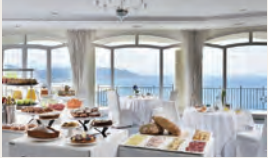
眺めの良い朝食レストラン（イメージ）

アマルフィ海岸の東端に近い、陶器で有名なヴィエトリ・スル・マーレ近郊に位置するホテルです。丘の上にあるため眺めが良く、敷地のテラスやプールサイドから気持ちの良いティレニア海の景色を望みます。この地方らしく、インテリアには明るい色合いのタイルや陶器が多用されています。