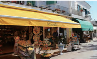
アナカプリ地区のショッピング通り（イメージ）

古代ローマの皇帝も愛したという、イタリアを代表する高級リゾートのカプリ島。ここの魅力は有名な「青の洞窟」ではありません。ウンベルト1世広場周辺に軒を連ねるお店をのぞいて、特産のレモンを使ったお土産を探したり、カフェのテラ