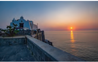
島西部のフォリオ地区は夕刻に訪ねます（イメージ）