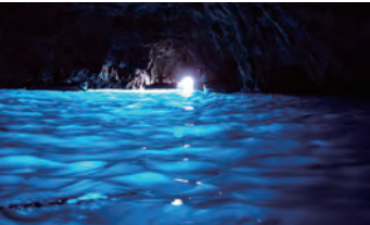
神秘的な色彩を放つ青の洞窟。天候次第ですが、連泊するため再挑戦も可能です。（イメージ）

ス席から道ゆく人を眺めたり、そんな気ままな過ごし方がここでの楽しみです。このたびはゆったり3連泊、島の東半分を巡るクルージングやアナカプリ地区の散策にもご案内し、カプリ滞在を満喫します。