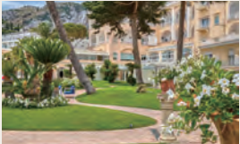
ホテルの庭園（イメージ）