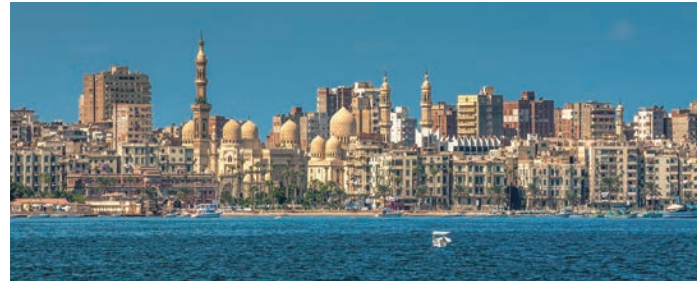
地中海の真珠 アレキサンドリア