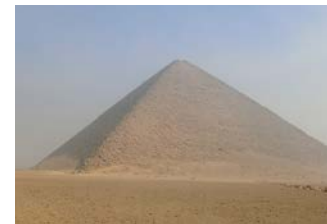
赤ピラミッドの建設には10年と7か月を要したことが内部の落書きより判明しています