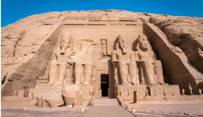
アブシンベル大神殿

※日程表の時刻は羽田空港発着のターキッシュエアラインズの利用を想定したものです。他航空会社利用の場合、発着空港、時刻および日程は異なります。 ※エジプトの全ての遺跡は政府の指示により公開中止または観光箇所の制限などの措置が突然とられることがあります。その場合、可能な限り日程の入れ替えや代替観光で対応いたしますが、やむを得ず入場できない場合には入場料をご返金いたします。 ※エジプトの世界遺産は複数から成り立つため、個別の世界遺産産記は致しておりませ。 (注1) エジプトの国内線の時間は変更となる場合があります。アスワンの観光は6日目と8日目に分けてご案内いたしますので、予めご了承ください。 (注2) 大エジプト博物館が正式オープンした場合には、考古学博物館の主な展示物がそちらに移動する予定のため、大エジプト博物館のみへご案内します。