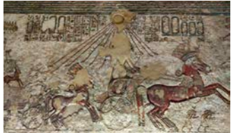
地下墓の一部の躍動感溢れるレリーフ

て太陽神アテンを唯一神とし、遷都した場所。この王の時代に栄えたのがアマルナ美術です。それまでの写実性やバランスが重視された様式とは異なり、若干デフォルメされつつも、生き生きとした人物像が特徴です。