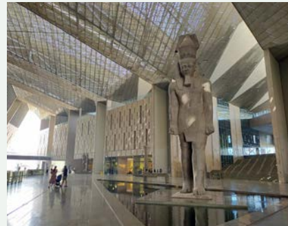
巨大なラムセス二世像が迎えてくれます