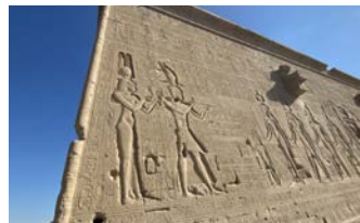
一番左がクレオパトラ、隣には息子のカエサリオンが描かれています

所、ローマ時代のコプト教会など多様な時代の遺跡が集まるデンデラ。残された神殿は古代エジプト最後の大型建築で、特にプトレマイオス神殿の外壁に刻まれたクレオパトラとその息子カエサリオンのレリーフには注目です。また、エジプト神話に登場するオシリス神復活の地アビドスの遺跡にもご案内します。