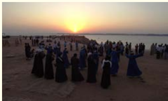
現地ではラムセスデイと呼ばれお祭りムードです

古代エジプトの最盛期を築いた建築王、ラムセス2世。数多くある建築物の白眉がアブシンベル神殿です。ここを舞台に年2回のみ見られる「光の奇跡」をご覧ください。神殿の最奥の至聖所に座す4体の神像にこの2日のみ朝日が射す現象は、遥か3300年ほど前の建造時に緻密に計算されていました。移設前と同じ角度から雄大な神殿の眺めを楽しめるクルーズや、夜には音と光のショーのご案内と、こだわりの観光内容でアブシンベル神殿をじっくり楽しめます。