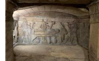
カタコンベ内のレリーフでは古代エジプト、ミラづくりの神アヌビス神がギリシャ風の服に身を包んでいるのも見られます

キリスト教の一派、コプト教の重要な巡礼地であった遺跡には、4世紀頃から発展した古代都市の面影が残ります。