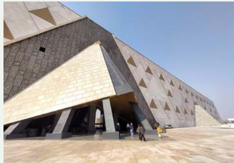
エントランスの壁にはファラオのカルトゥージュが刻まれます

大エジプト博物館 (GEM=Grand Egyptian Museum) はギザの三大ピラミッドの近くの広大な敷地に建設されている。古代エジプトの至宝を一堂に集めた博物館で、単一文明を扱う博物館としては世界最大級を誇ります。現在は正式オープンをはかえ、プレオープンという形で徐々に鑑賞区域が広がっているところです。乗船前にはカイロ考古学博物館へ、下船後にはこのプレオープン中の大エジプト博物館へご案内します。限られたエリアではありますが、ラムセス二世の像に迎えられ、旅の土産話のひとつとしてご鑑賞をお楽しみください。