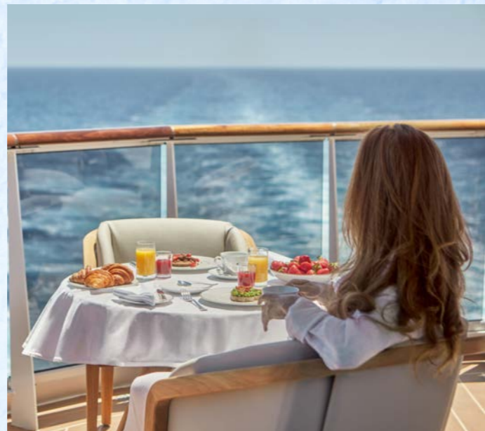
24時間ルームサービスも好評です (イメージ)