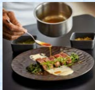
レベルの高いお食事をお楽しみください (イメージ)