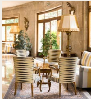
落ち着いた雰囲気の内装です

弊社では、これまで各国の正式な評価基準に基づき、利用ホテルの★の数を記載してまいりました。しかしながら、昨今は欧米の大手ホテルチェーンであっても未登録のホテルが増えてきていること、★の数が必ずしもホテルの品質を担保するものではない現状を鑑み、ホテルの★の掲載を取り止めております。なお、これまで通りツアー内容やコンセプトに合わせて可能な限り快適なホテル選定を心がけております。