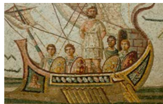
ホメロスの叙事詩「オデュッセウス」を描いたモザイク

古代ローマ時代、ビザンチン時代、専門職人によって制作されたモザイク。天然の石を用い、匠の技で仕上げられたそれは芸術品そのものです。北アフリカ・チュニアの首都チュニスにあるバルドー博物館には、国内を中心に発掘された当時の見事なモザイクが数多く展示されています。神話や日常生活、動植物などが鮮やかに描かれており、必見です。