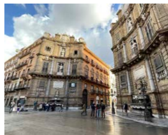
パレルモの名所のひとつクアトロ・カンティ