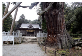
玉若酢命神社と八百杉