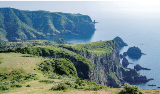
【西ノ島】高さ257メートルの絶景「摩天崖」(イメージ)