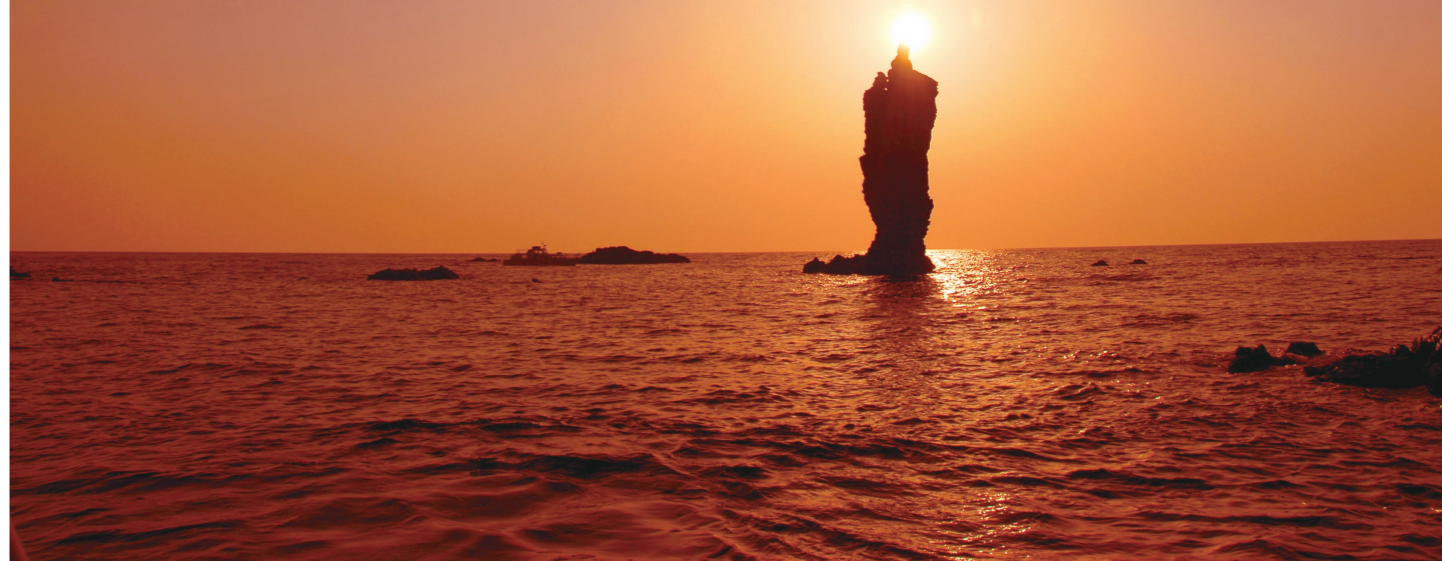
隠岐の島のシンボル、ローソク島の夕日は遊覧で観賞(イメージ)