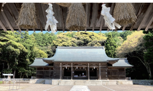
【中ノ島】後鳥羽上皇からの歴史を持つ隠岐神社

次に訪れるのは、4島の中で2番目に大きい西ノ島です。西ノ島でぜひご覧いただきたいのが、隠岐の美しい大自然の絶景。ユネスコの世界ジオパークに認定されている自然の美しさをお楽しみください。国賀