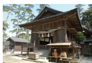
平安時代には隠岐第一位の地位をしいた水若酢神社