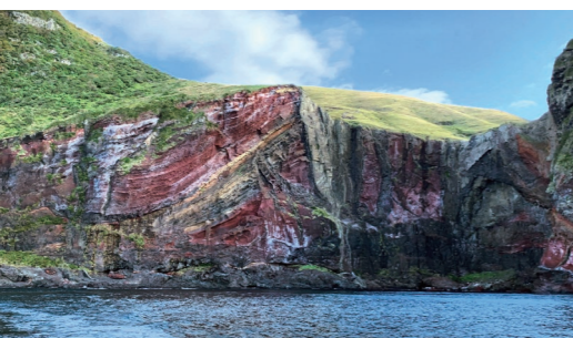
【知夫里島】知夫里島の景勝「赤壁」をチャーター船から観賞(イメージ)

海岸にある代表的な断崖絶壁が摩天崖(まてんががい)。島前カルデラの外輪山外壁にある257メートルの大絶壁が摩天崖です。そして隠岐の自然の美しさを見せてくれる4つ目の島が、知夫里島です。交通が不便なこの島へのアプローチは、西ノ島から船をチャーターし、島を代表する絶景「赤壁」の船上からの見学も兼ねて渡ります。通常では、知夫里島へ渡った後、遊覧船に乗り換えて訪ねる「赤壁」を効率よく訪問することができるよう。知夫里島の見学を終えたら、隠岐4島に別れを告げ、フェリーにて境港に渡ります。