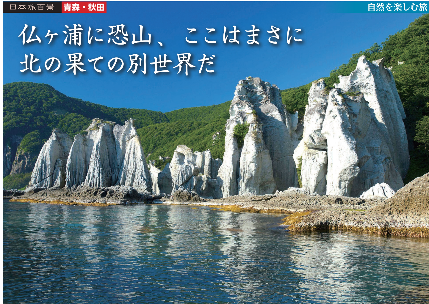
船からアプローチして仏ヶ浦の奇岩の景色をご覧ください(イメージ)