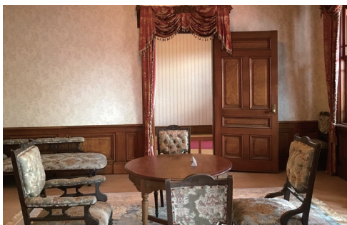
太宰治ゆかりの斜陽館。お屋敷の1階は和風、2階は洋風のスタイル

「人間失格」や「走れメロス」など、多くの名作を残した太宰治。津軽地方は彼のゆかりの地としても有名です。このたびは太宰治記念館である斜陽館へご案内します。斜