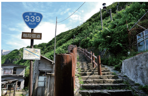
龍飛崎の近郊名所の一つ「階段国道」国道でありながら車もバイクも通れず、歩行者しか通れません