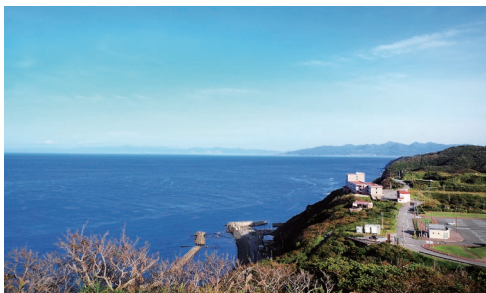
龍飛崎から見る津軽海峡の風景(イメージ)

津軽半島最北端となる岬、龍飛崎。西は日本海、北は津軽海峡、そして東は陸奥湾と三方を海に囲まれ、強い海風が吹くところから「風の岬」とも呼ばれます。『津軽海峡冬景色』の歌でよく知られますが、珍しい「階段国道」も近年注目を集めています。国道なの