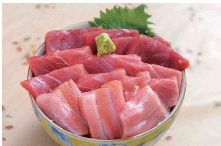
大間ではまぐろ丼をお召し上がりいただけます(イメージ)

下北半島の突端に位置する大間崎は、本州最北端に位置し、北海道と津軽海峡をはさんで、わずか17・5キロの地。このたびはその大間に宿泊し、海の幸を楽しみます。大間といえば、黒いダイヤと呼ばれる天然本マグロ「大間のマグロ」。その品質はブランド化されており、今や全国的に有名です。