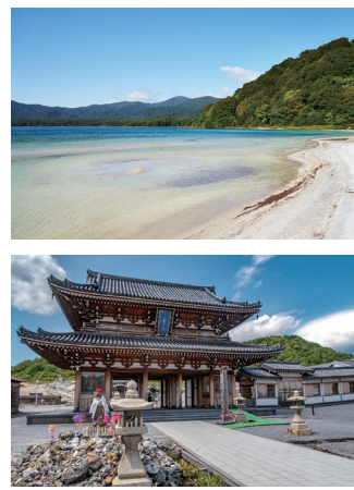
(上から)恐山のカルデラ湖、宇曾利山湖(うそりざんこ)(イメージ)／恐山菩提寺

比叡山と高野山に並ぶ日本三大霊山のひとつ、恐山。三途の川や賽の河原などもあり、隣接する美しいエメラルドグリーンの宇曾利山湖は、その景色とは裏腹に酸性が強く生き物がほとんど生息できない湖で、独特な雰囲気を感じるところです。そして約2キロに渡って奇岩が連なる仏ヶ浦は、青い海に映える白緑色の奇岩が立ち並ぶ様子は神秘的で、極楽浄土を思わせるとされ、仏に因んだ様々