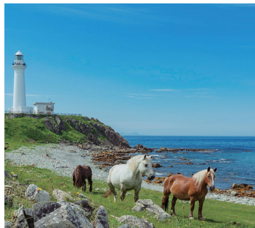
放牧された寒立馬と尻屋崎灯台(イメージ)