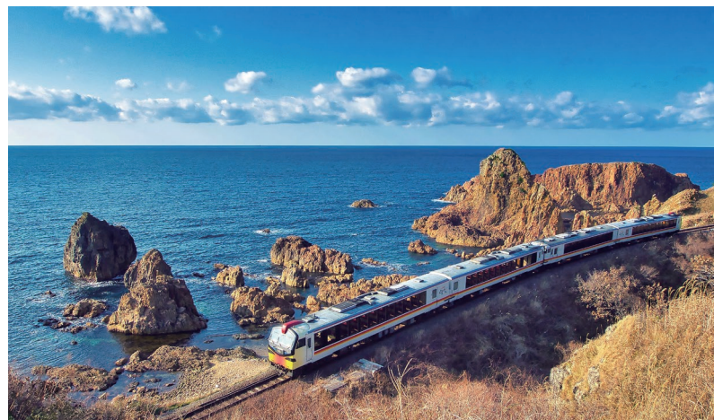
美しい海岸線を走る五能線(イメージ)