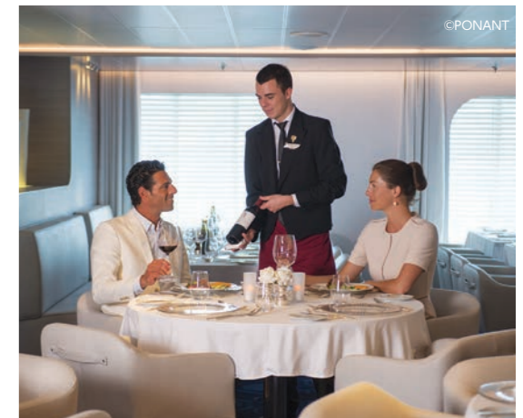
その日おすすめのワインとともに食事をお楽しみください

お部屋は全室が海側キャビンでその95%がバルコニー付きです。ご利用いただくキャビンの広さも21㎡から45㎡(バルコニーの広さも含まれます)までと多彩なバリエーションの中からお選びいただけます(各室ともツインベッドも可能です)。2つのレストランやラウンジ、シアター、美容室、スパ、プール、フィットネスセンター、ライブラリー、メディカルセンターなどクルーズを快適にお過ごしいただく施設も充実しています。