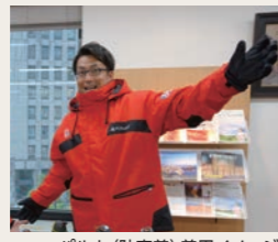
パルカ(防寒着)着用イメージ

訪問地によって大きく異なります。プエノスアイレスは真夏で湿度も高めですが、一方でウシュアイアは緯度が高く、冷涼で雨が降ると気温が昼間でも大きく下がることもあります。雨具、重ね着をご用意ください。