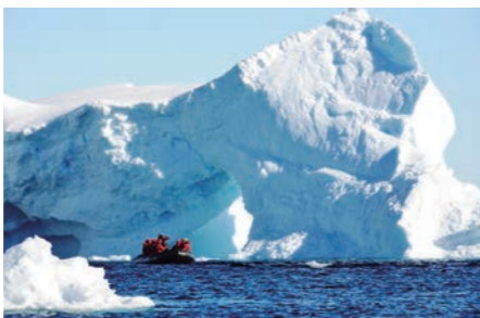
巨大で円巻の氷山をゾーディアックから見上げる(イメージ)

小さな湾が入り組んで、様々な形の氷山が浮遊する絶景の景観で知られるパラダイス湾などでは、ゾーディアックボートによる氷山クルーズを楽しむチャンスがあります。神秘的なコバルトブルーの氷山や氷河、その背後に聳える山々など、静寂の中で水面に鏡面のように景観が映り込む光景が見られるかも知れません。まさに南極ならではの絶景をご覧いただけます。