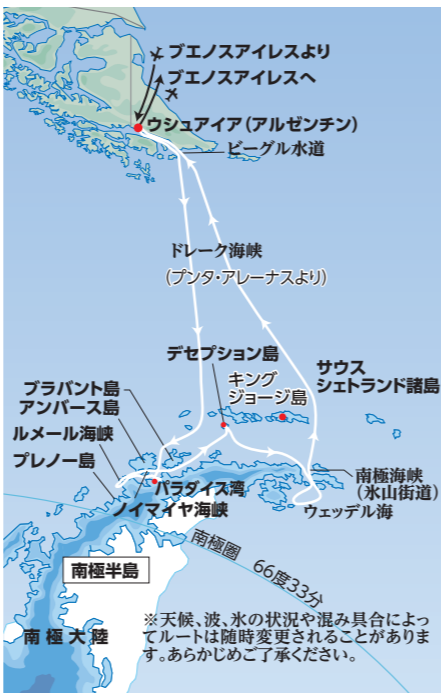
※天候、波、氷の状況や混み具合によってルートは随時変更されることがあります。あらかじめご了承ください。