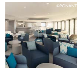
パノラミックラウンジ