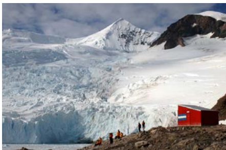
ネコハーバーに迫りくる氷河(イメージ)

南極半島でもその美しさで知られるネコハーバーへはゾーディアックボートで上陸する予定です。雪深い山々や氷、手つかずの大自然がここにはあります。可愛いジェンツーペンギンやアデリーペンギンの歩く姿や泳ぐ姿…いかにも南極らしい風景と出会えます。そしてなにより南極の地を自らの足で踏みしめる感慨がこみ上げてきます。