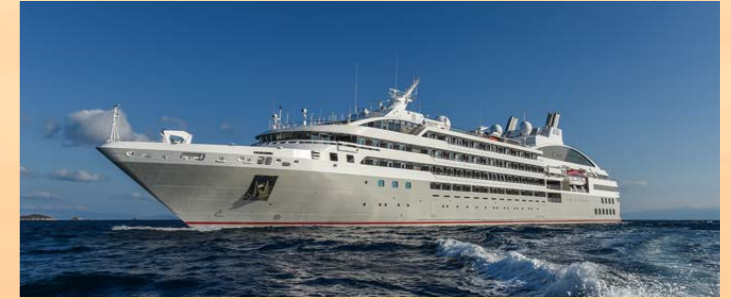
南極で抜群の機動力を誇るル・リリアル