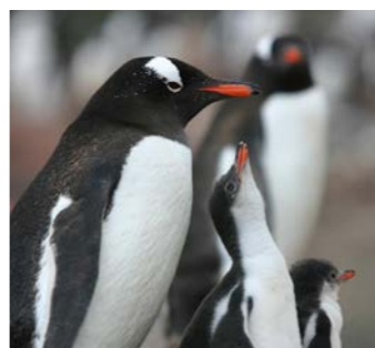
ジェンツーペンギン(イメージ)

海峡の両側に1000メートル級の白銀断崖が聳え立つルメル海峡を越えて、今回のクルーズで予定する最南に位置するプレノー島。愛らしいジェンツーペンギンやアデリーペンギンの営巣地として知られていますが、この時期は雛がかえり、走り回る姿がご覧いただけるチャンスがあります。また、南から流れ着くより深い青みを混えた氷山も見どころです。