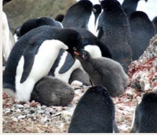
子育てをするアデリーペンギン(イメージ)

南極の旅の楽しみの一つはこの時期、子育てに勤しむ動物たちとの出会いでしょう。アデリーペンギン、ジェンツーペンギン、ヒゲペンギンなどのペンギン。ザトウクジラやウェッデルアザラシ、ヒョウアザラシ、あるいは、アホウドリをはじめとする数多くの海鳥が見られるかもしれません。