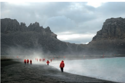
デセプション島では天候によってはこのような湯気が見られます(イメージ)