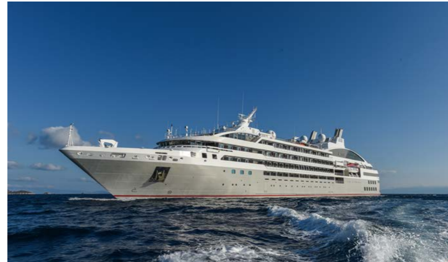
総トン数:10,990トン 全長:142メートル 全幅:18メートル 乗客定員:244人(南極クルーズ時は200人に制限) 乗組員数:145人 就航年:2015年 アイスクラス:1C(耐氷船)

お料理はフランス料理を中心に様々なア・ラ・カルトやコースをご用意。フランスの高級客船らしく素材に対するこだわりがフランス人の食通をもうならせ、お食事を楽しみにこの船に乗るお客様も多いそうです。また、日本のお客様にとってうれしいのが、フレンチ風懐石料理とでも言うべき品の良いコース料理が多彩に、しかも量もほどほどにサービスされるということです。飲み物についても一部を除き、インクルーシブスタイルでレストランやラウンジ、ミニバーも含め料金に含まれています。