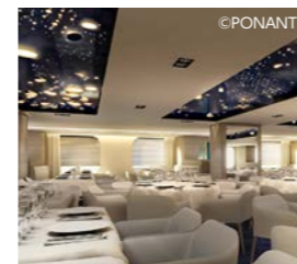
メインレストランのガストロ/ミックスレストラン

お料理はフランス料理を中心に様々なア・ラ・カルトやコースをご用意。フランスの高級客船らしく素材に対するこだわりがフランス人の食通をもうならせ、お食事を楽しみにこの船に乗るお客様も多いそうです。また、日本のお客様にとってうれしいのが、フレンチ風懐石料理とでも言うべき品の良いコース料理が多彩に、しかも量もほどほどにサービスされるということです。飲み物についても一部を除き、インクルーシブスタイルでレストランやラウンジ、ミニバーも含め料金に含まれています。