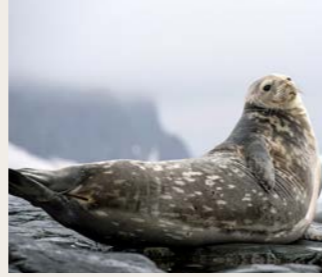
ウェッデルアザラシ(イメージ)