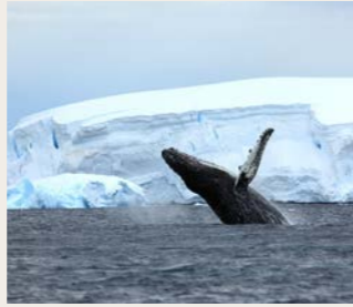
ザトウクジラ(イメージ)