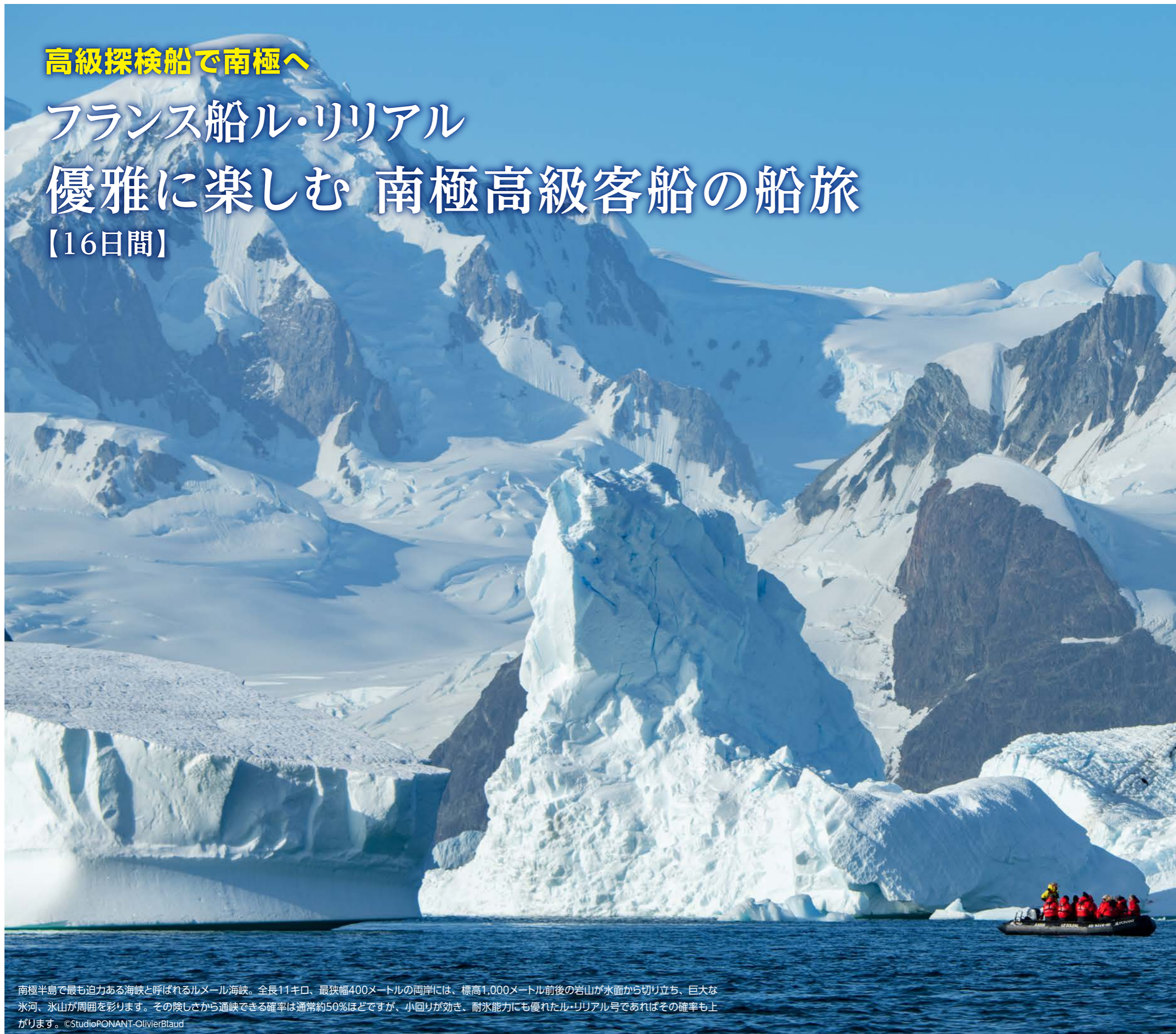
南極半島で最も迫力ある海峡と呼ばれるルメール海峡。全長11キロ、最狭幅400メートルの両岸には、標高1,000メートル前後の岩山が水面から切り立ち、巨大な氷河、氷山が周囲を彩ります。その険しさから通航できる確率は通常約50%ほどですが、小回りが効き、耐氷能力にも優れたル・リリアル号であればその確率も上がります。