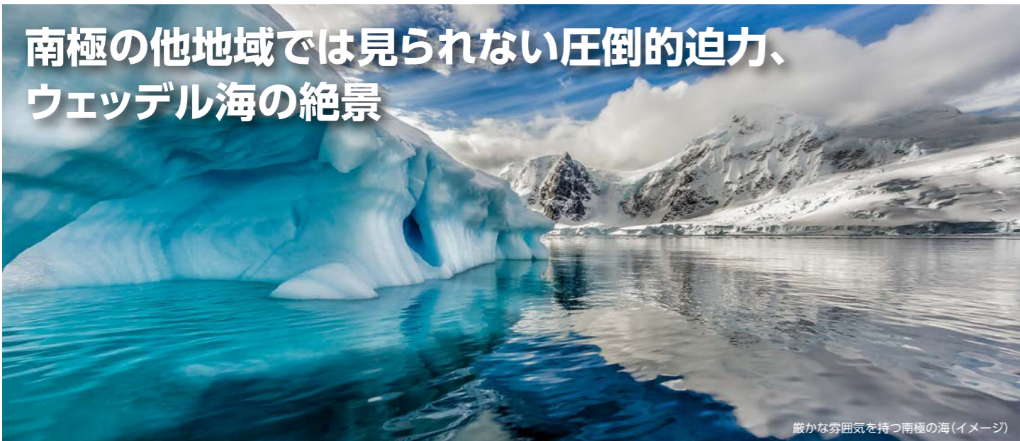
厳かな雰囲気を持つ南極の海(イメージ)

手つかずのままの大自然が残されている南極大陸。近年、多くの外洋船が南極を訪れるようになりましたが、南極海峡を越えた南極半島の東側の海域、ウェッデル海まで足を延ばす船はさほど多くはありません。ウェッデル海の最大の魅力は他では見られない圧倒的な絶景。南極大陸に降る雪が押しつぶされて氷となり、それが最後に巨大な氷の塊となってウェッデル海に流れ込みます。生み出されたばかりの氷塊の発生源に近い為、巨大なものでは幅が10キロ以上、高さ50メートル～80メートルもある、信じられない大きさの卓状氷山に出会うチャンスがあります。天気や風、波の動きによって一つ一つの氷塊は全く異なる表情を見せてくれるので、いくら見ても飽きることはありません。