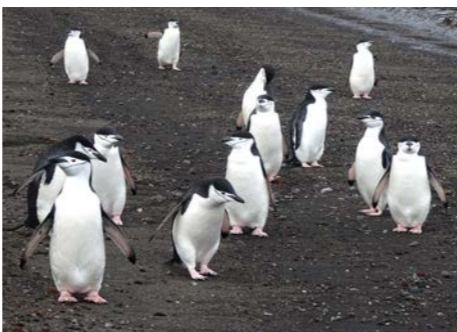
ヒゲペンギンに出会うチャンスがあります(イメージ)