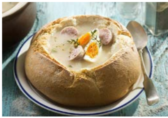
ポーランドのスープ ジュレク

ポーランドの国土の約40%が農業用地。そんなポーランドを代表するお食事といえば、スープです。その種類は実に豊富で、代表的なものは「ジュレク」と呼ばれるライ麦を発酵させたスープで、ほかにもキノコのスープや赤ポルシチスープなど様々な種類のスープをご賞味いただけます。どうぞお楽しみください。