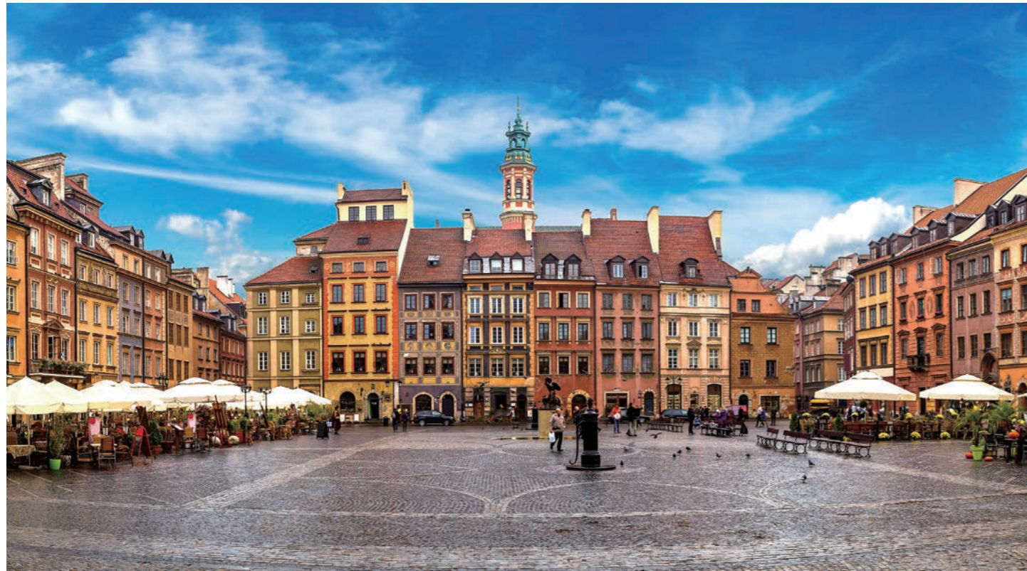
先の大戦で破壊され、見事に復活をとげたワルシャワ旧市街広場