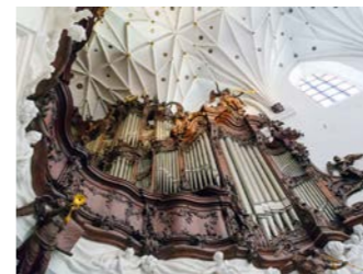
オリヴァでは7,000本以上のパイプが使用されたパイプオルガンのコンサートをお楽しみください

案内。18世紀には「世界で最も美しいパイプオルガンの音」と称された音色をお楽しみいただけます。