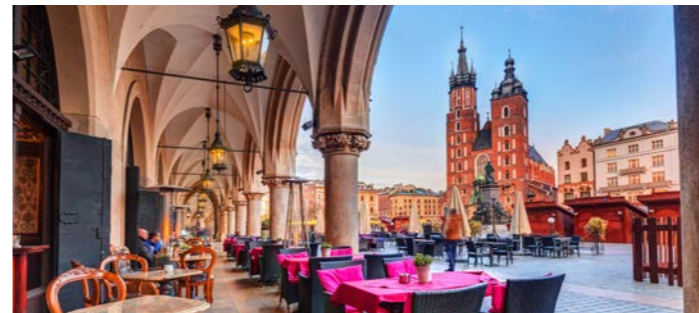
クラコフの旧市街 中央広場と聖マリア教会

交易の中心地であった織物会館などが世界遺産にも登録されています。クラコフでは旧市街の中心、中央広場まで徒歩1分的好立地なホテルで3連泊し、時間によって移り変わる街の表情を存分に味わっていただけます。