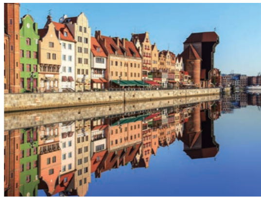
ハンザ都市屈指の美都・グダニスク