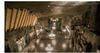
ヴィエリチカ岩塩坑の礼拝堂

て、坑夫たちが岩塩を掘って作ったもの。岩塩の結晶でできているシャンデリアは必見です。