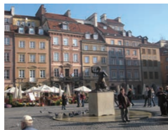
戦災から復興したとは思えないワルシャワ旧市街