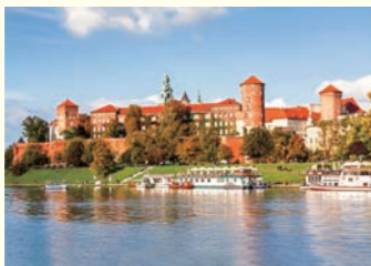
ポーランド王国の歴史を紡いできた ヴァヴェル城(クラコフ)