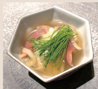
和と洋を融合した料理の数々(イメージ)