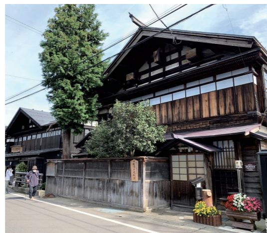
重要伝統的建造物群保存地区の増田の散策へ

■最少催行人員:10名様 ■食事:朝食3回、昼食3回、夕食3回 ■添乗員:東京駅ご出発時から東京駅に到着時まで同行します。 ■ホテル:湯沢/湯沢グランドホテル(洋室)、山形/山形グランドホテル(洋室) ■利用予定バス会社:山交/バスまたは同等クラス ■利用交通機関:東北・山形新幹線(普通車指定席)