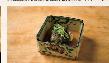
山菜を使った繊細な料理の数々(イメージ) ※山菜は季節によって異なります。