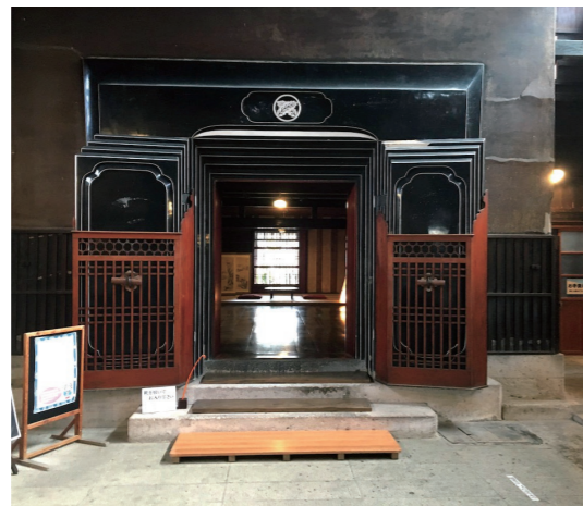
増田の内蔵 家族の居室として使われたといわれます

往時の繁栄を伝える 重伝建の町、増田を散歩 川の合流地点にあり陸運、水運の要衝であった増田。江戸時代には養蚕や葉タバコなどの農業で栄え、明治時代には商業活動