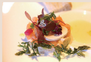
「Viamver®(ヴィアンヴァー)酵母」を使ったコース(イメージ)