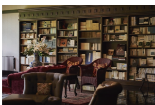
(右) 武田信玄の隠し湯として知られる名湯(イメージ) / (左上) 大正時代の面影を残しながら改装された客室(イメージ) / (左下) 大正時代を思わせる落ち着いた空間、ライブラリー(イメージ)