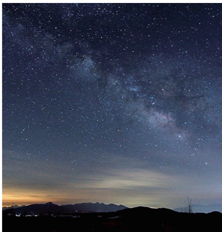
ホテルの屋上からは360°の星空が楽しめます(イメージ)

テルのレベルの高さから全国にファンを持ち、予約困難なホテルとしても知られています。ホテル設備もさることながら、特質すべきはその眺望です。美ヶ原の最高峰に位置するため、北アルプス、南アルプス、八ヶ岳から浅間山、そして富士山まで、四方の山々を望むことができます。また、天候によつては眼下に雲海も楽しめるため「雲上のリゾート」とも呼ばれています。八ヶ岳方面からのぼるご来光、北アルプスに沈む夕陽、朝夕は山々が赤く染まる風景など、滞在中は時間ごと刻々と変化する絶景に飽きることがありません。美しい山並みを眺めながら展望風呂にゆっくりと浸かるのもホテル滞在の醍醐味です。(ホテルからの眺望は天候により左右されますので予めご了承ください)