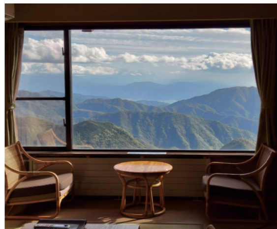
王ヶ頭ホテルの客室(イメージ) ※季節は異なります

美ヶ原の最高峰、標高2034メートルの王ヶ頭に建つ王ヶ頭ホテルは、ホテル立山や千畳敷ホテルに並ぶ山岳ホテルとして絶大な人気を誇ります。1951年に避難小屋を兼ねた「王ヶ頭ヒュッテ」としてオープン。現在は山上にあって設備の整った客室、質の高い料理、展望風呂やスパと、ホ