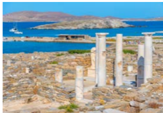
アポロンの聖域として栄えたデロス島