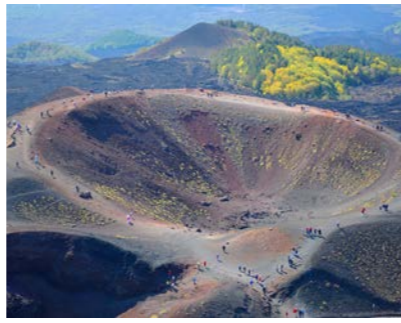
エトナ山のクレーター(上空からのイメージ)

富士山に匹敵する高さを持つエトナ山（標高3,223m）は、50万年前から今もなお噴火を繰り返す活火山です。ツアーではあまり訪れませんが、クレーターを間近に望む観光できるスポットとして人気で、カタールヤの街とメッシーナ海峡を見下ろす景色も楽しめます。