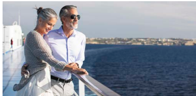
気軽に楽しめるのが魅力のひとつ(イメージ)

クルーズファンに支持されるラグジュアリーシップ セブンシーズ・スプレンドラーの スーペリアスイートをご用意しました