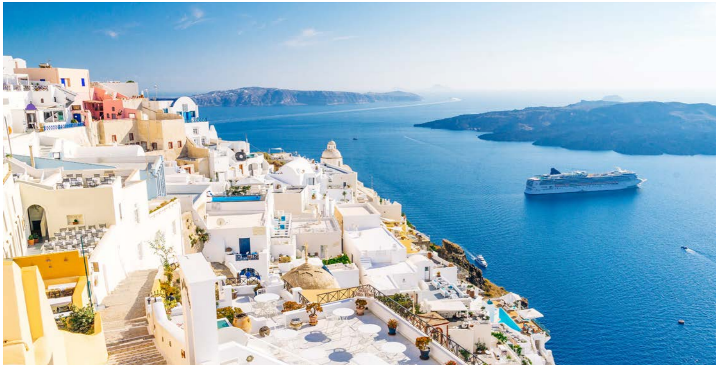
フィラの街歩きへご案内します(イメージ)