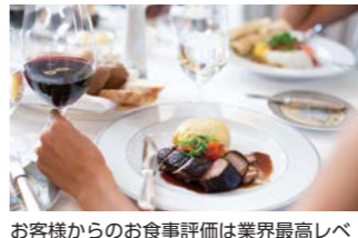
お客様からのお食事評価は業界最高レベルで楽しめます(イメージ)