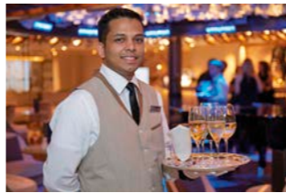
1対1のきめ細やかなサービスが好評です

*クルーズでの下船観光も含まれていますが、乗船している他のお客様との混乗ツアーのご案内となります。