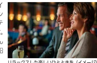
リラックスした楽しいひとときを(イメージ)

2階建ての劇場では、ブロードウェイスタイルの華やかなショーや著名なシンガー、ミュージシャンのエンターテインメントをお楽しみいただけます。最新の映像・音響システムはもちろんのこと、日替わりのショーは大型客船にも引けを取らない充実ぶりです。