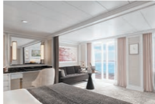
スーペリアスイート(客室イメージ)