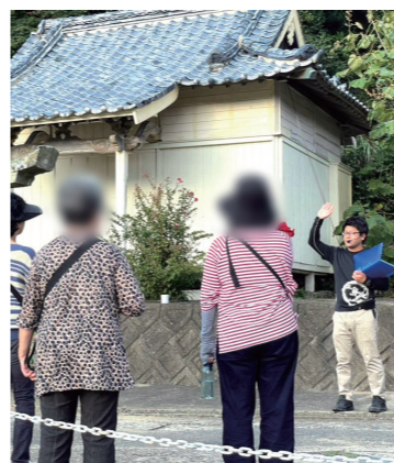
桐古里郷の氏神・山神社などを「かくれキリシタン」の子孫ガイドにご案内いただきます (イメージ)

キリスト教が禁じられた17〜19世紀にひそかにキリスト教の信仰を続けた人々は「潜伏キリシタン」と呼ばれ、明治時代に信仰が自由になると、多くはカトリックに復帰しました。しかし、明治時代以降も先祖が守った独特の祈りを継承した信徒を「かくれキリシタン」と呼ぶことがあります。その「かくれキリシタン」の信徒組織が、上五島の桐古里郷（きりふるさとごう）に残ります。このたびは、「かくれキリシタン」の子孫のガイドさんに桐古里郷を案内していただきます。