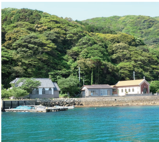
チャーター船で久賀島へ (イメージ)

今回はチャーター船を利用し、下五島にある久賀島、奈留島にもご案内します。特に国の文化的景観に指定された久賀島の島風景、明治初期の建築・旧五輪教会堂など素朴で趣のある建物もご覧ください。