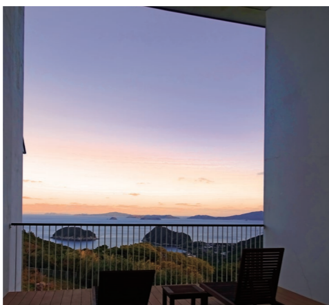
上五島のホテル「マルゲリータ」。テラスからのんびり海を眺めて (イメージ)