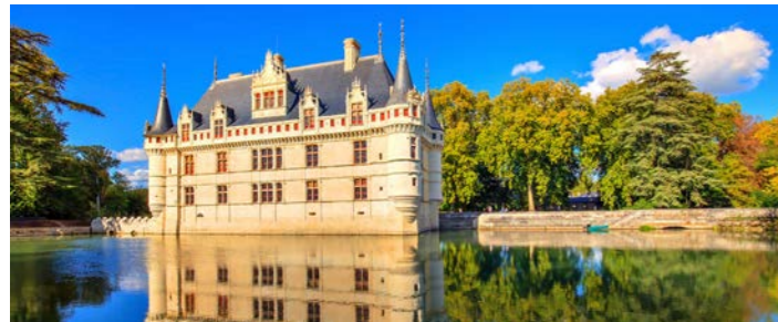
川面に静かに影を落とすアゼ・ル・リドー城

フランスを流れる四大河川に数えられるロワール川とガロンヌ川。そのほとりに開けた2つの街にゆったり連泊滞在し、鉄道を使い近郊の見どころへご案内します。前半はトゥールに3連泊。ロワール川流域はかつて狩猟が盛んに行われ、「フランスの庭」と呼ばれた地です。古くから王侯貴族が移り住み、現在も多くの古城が残され川辺に美しいシルエットを覗かせています。後半はガロンヌ河畔のボルドーに4連泊。宿泊には、街の中心部に位置する上級ホテル「ブルディガラ」を確保しました。世界遺産の街並みの散策をお楽しみいただくとともに、サン・テミリオンやマルゴールのワイナリーを訪ねます。時はブドウの収穫が終わり、畑が色づくシーズン。秋景色を愛で、本場で銘醸ワインのグラスを傾ける、秋のフランスの贅沢をお楽しみください。