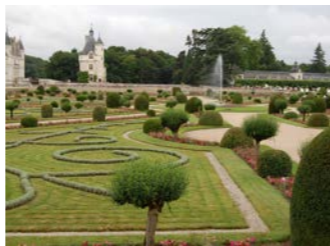
シュノンソー城は庭園も必見です

れます。川をまたいで建っているのが特徴的で、城とともに庭園が美しいことでも有名です。