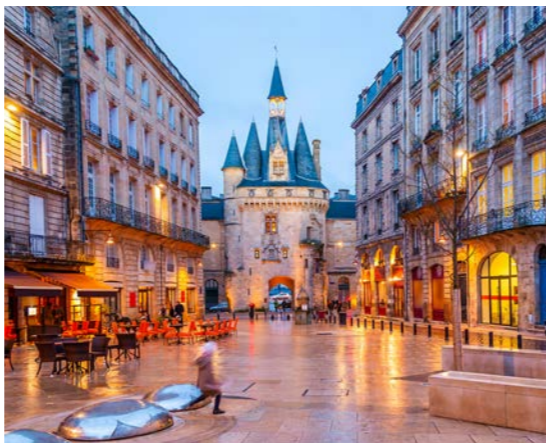
奥にそびえるのが日市街への立派な入り口・カイヨ門 (ボルドー)