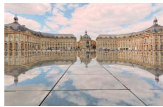
ボルドーの名所、プルス広場の水の鏡

た。パリと同じようにいくつかのカルチェ（地区）から構成され、それぞれに個性的なので散策も楽しいものになります。