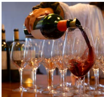
メドックワインをお楽しみください (イメージ)

ツアーではもうひとつ、ジロンド河口左岸に広がるワイン産地メドックへ鉄道に乗りましてご案内します。なかでも「ボルドーの女王」と称えられる「シャトー・マルゴー」を産するマルゴー村を訪ねます。「マルキ・ド・テルム」は最高の立地条件を持つシャトーですが、生産量が多くなく、日本ではなかなか手に入れることができないワインです。ボルドー4連泊ならではのプログラムで貴重な機会となることでしょう。昼食もシャトー内のレストランでお召し上がりください。