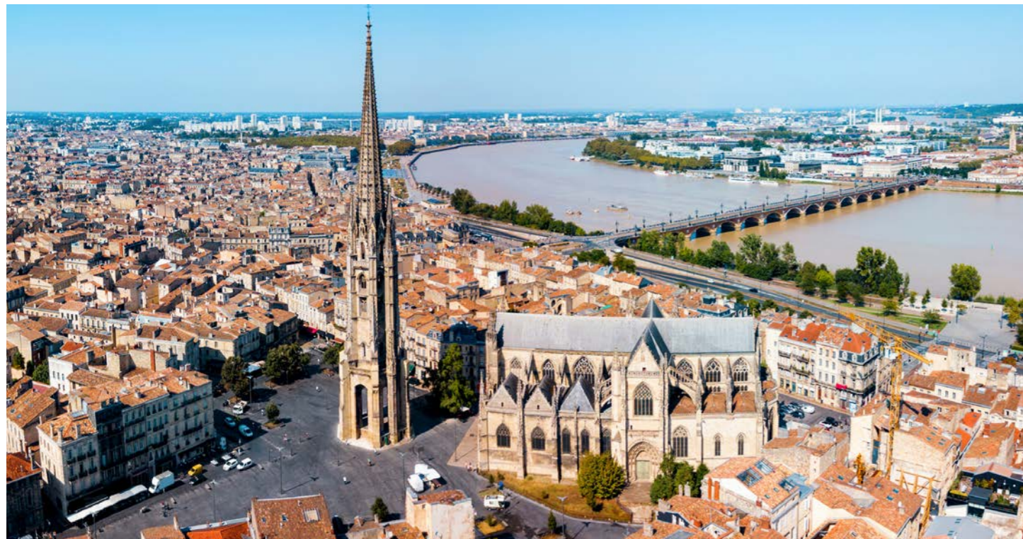
「月の港」として栄えた世界遺産ボルドーに4連泊