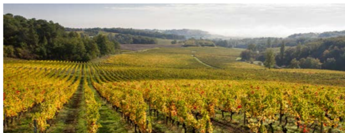
ブドウ畑が色づく中、ウォーキングを楽しみます（イメージ）

れるほど多くのシャトー（醸造所）が建ち並んでいます。ブドウ畑も世界遺産に登録されている珍しい町です。ツアーではサン・テミリオンの手前でバスを降り、黄金色に輝く秋のブドウ畑のウォーキングを楽しみながら村を目指します（※自然現象のため、必ず黄葉しているとは限りません）。