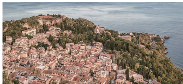
タオルミナのさらに高台に位置するカステルモーラから、タオルミナの町の全景が見下ろせます