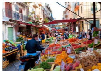
パレルモの市場の様子（イメージ）

おりますので、地元食材がずらりと並ぶ市場などに立ち寄るのもおすすめの過ごし方です。