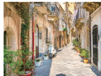
シラクーサ旧市街の細い路地の様子

海に突き出た出島のようなオルティージャ島の旧市街はシチリア島の中でも特に雰囲気のある町並みを残しています。一方、本土側の考古学地区にはギリシャ劇場や石切り場などギリシャ都市の中で最も大きく、美しいと称えられた往時を偲ぶことができます。