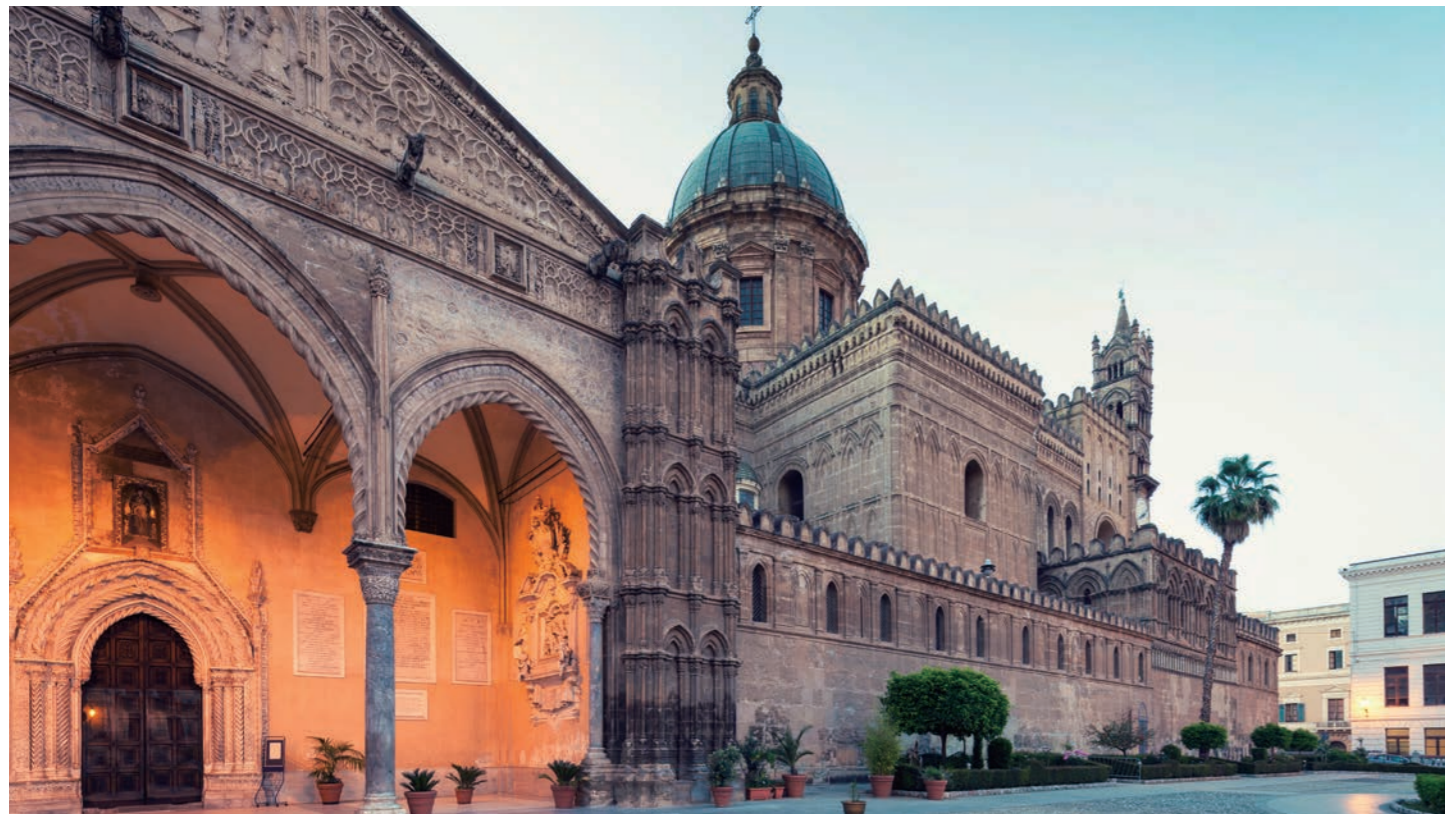
夕刻のパレルモ大聖堂（カテドラーレ）。宿泊ホテルから大聖堂までは、徒歩で5分ほどです