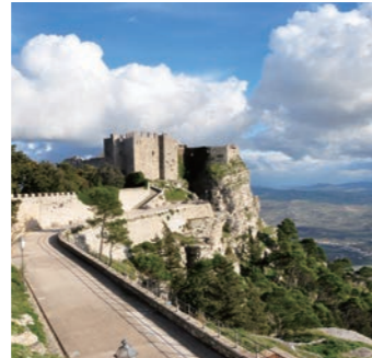
空中都市エリチェ