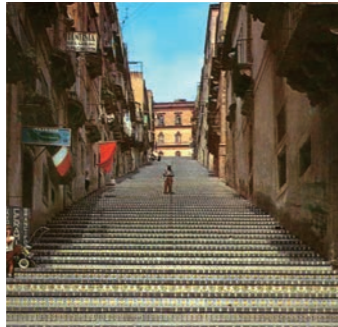
陶器の町カルタジローネ

このたびご宿泊いただくシチリア島の都市はもちろんですが、都市から都市へのバス移動の際に見逃してしまいそうな小さな町や村にも足を延ばし、丁寧に訪ねてゆきます。ひとつひとつの町に個性があり、訪ねる時間帯によってその地域に住む人々の生活なども感じられることでしょう。