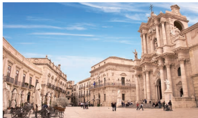
美しいバロック様式のドゥオモ広場