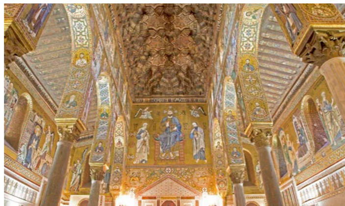
荘厳なパラティーナ礼拝堂の内部