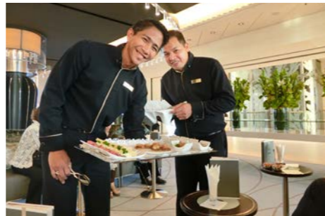
カナッペをどうぞ！