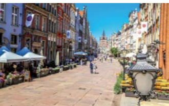
グダニスク旧市街の散策をお楽しみください