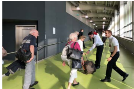
ターミナルからのお出迎えには驚きました