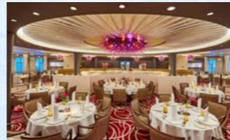
レストランも広く造られており、ゆっくりと食事を楽しめます

乗客と船員だけではなく、船自体も上質な雰囲気を作り出しています。その要素として、まずはゆったりとした空間です。お客様一人あたりのスペースが83トンと同規模の客船の中で信じられないほどの広さを持っています。客室もすべてのお部屋がベランダを含めて35㎡以上とゆったりとしたスペースです。また、内装も豪華絢爛というよりは、限りなく自然に近い色を使っており上品です。