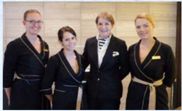
フレンドリーなレストランスタッフ

お客様1.4人に対して乗組員1人を配し、きめ細やかなサービスを実現します。その追求されたサービスはオイローパ2が設ける厳しい採用基準にも表れております。皆様をもてなすスタッフは、全員ドイツ語圏のホスピタリティーの国家資格を保有するだけでなく、4星や5星の高級ホテルで3年以上の就業経験を有していなければなりません。この厳しい訓練や試験を突破したもののだけが、この船でサービスすることを許され、ドイツ語圏ではこの船で働くことが一種のステータスにもなるなど、スタッフ一人ひとりがサービスすることに大きな責任と誇りを持っています。