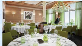
セレニッシマ（イタリア料理）/レベルの高いお食事をお楽しみください（イメージ）

長い船旅をしていると、食事に飽きがきてしまうもの。そういったお客様にも船旅を楽しんでいただくために、4万トンという小型船でありながら、船内をご利用いただけるレストランは7つあります。いずれも、上質な料理を提供し、それぞれが違うテーマで楽しませてくれます。もちろん、これらは船旅をより楽しんでいただくためので、スペシャルティレストランはいつでも追加料金なしでご利用いただけます。下記でご紹介のレストランの他、和食レストランの「サクラ」や、世界中の高品質なワインを揃えた「グランドリザーブ・レストラン」もごございます。