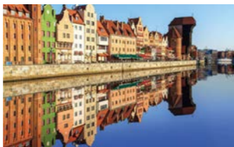
運河沿いにカラフルな建物が並ぶグダニスク旧市街

様子は、船を使った貿易で栄えた中世の繁栄を彷彿とさせます。レンガ造りの建物、カラフルな彩りの町並みなどをゆっくりとご覧ください。