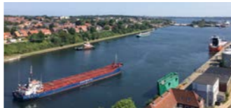
世界三大運河のひとつキール運河を通峡します（イメージ）