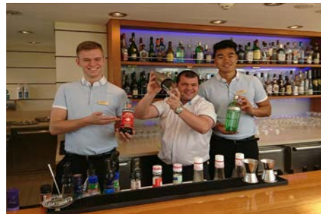
いつでもお待ちしております！