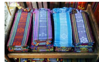
ティモールの伝統的な織物「タイス」