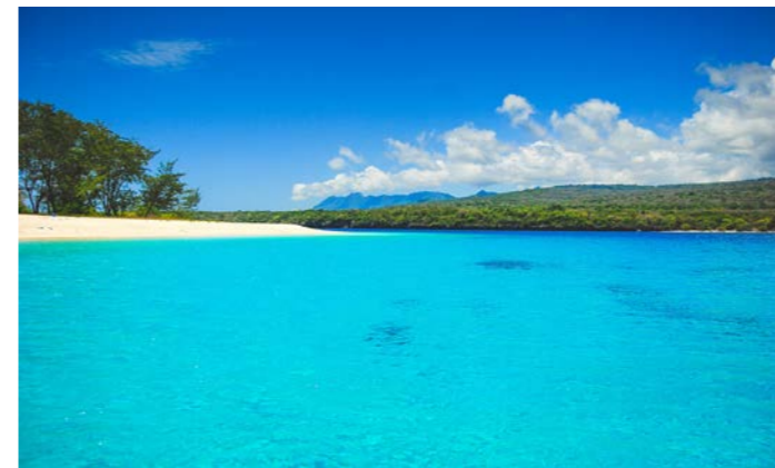
絶景の無人島として話題のジャコ島

近年、東ティモール随一の絶景「ジャコ島」です。ティモール島のトウの地として注目されているのが東ティモール最東端に位置する無人島と足を伸ばします。