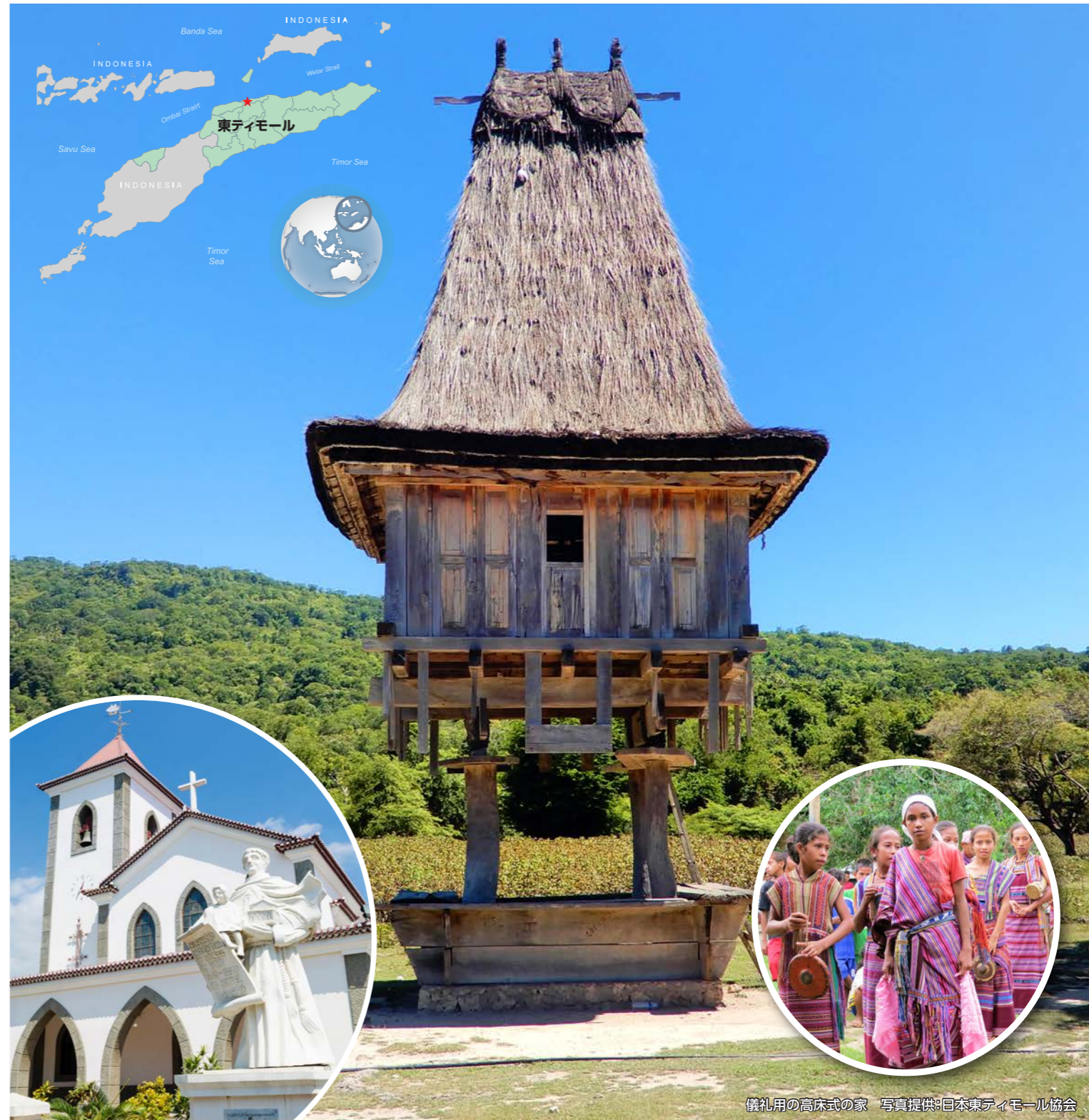
儀礼用の高床式の家

※総合旅行業務取扱管理者とは、お客様の旅行を取り扱う営業所での取引に関する責任者です。この旅行に関し、担当者からの説明にご不明な点があれば、ご遠慮なく上記の旅行業務取扱管理者におたずねください。(株)ワールド航空サービス観光局長登録旅行業201号