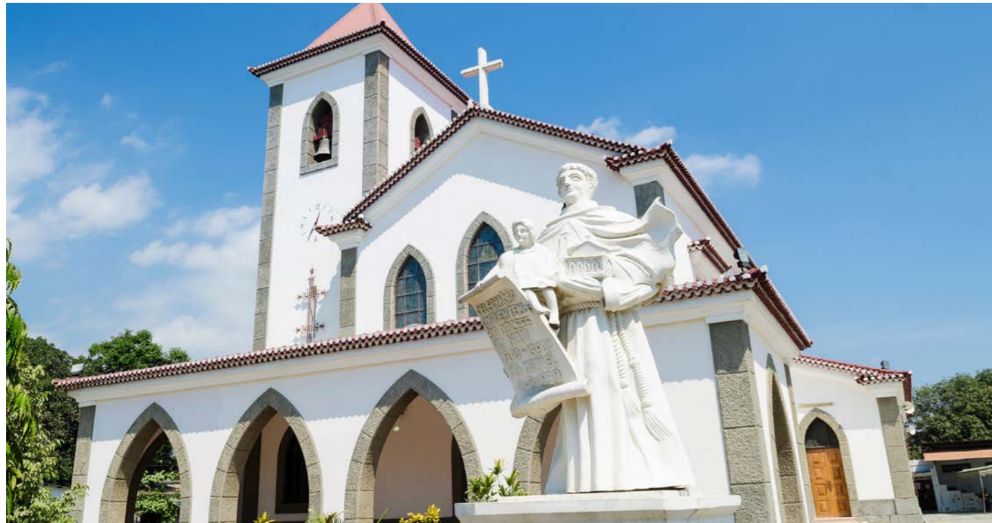
東ティモールはカトリック教国。各地に教会が見られます