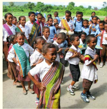
ティモールの子どもたち