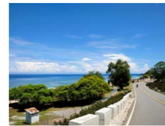
パウカウへ向かう1号線は日本の支援により整備されました