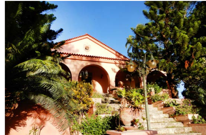
お泊まりは「ポサーダ・デ・パウカウ」の新館です