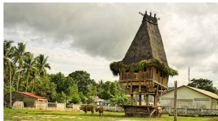
ファタルク族が儀式を行う「ウマルリク」

交信できるといわれています。インドネシア占領中に廃れましたが、独立後に再び建てられるようになりました。