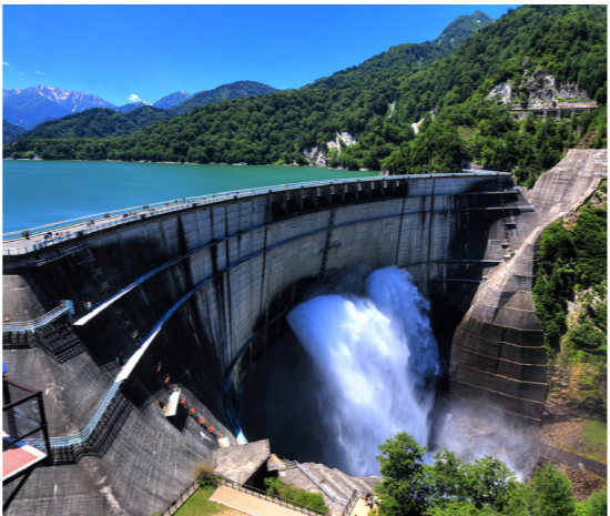
黒部ダム。放水は夏だけのプログラム(8月~9月イメージ)

「扇沢駅」から出発し、電気バスやロープウェイ、ケーブルカーなどを乗り継ぎ、終点となる富山県側の立山町「立山駅」へ。途中、黒部ダムを散策しながら、立山黒部の美しい風景を満喫することができます。