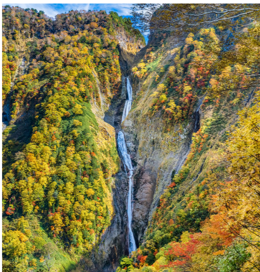
アルペンルートのもう一つの絶景、称名滝は落差日本一(約350メートル)(10月イメージ)

さらにゴンドラリフトも完成し、違う角度からも北アルプスの山々が望めるようになりました。昼食は、山上のカフェ・レストランにてご利用しました。