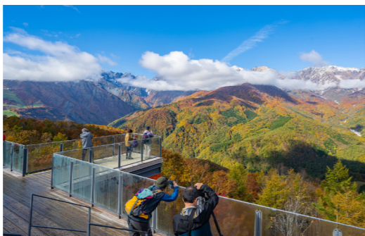
白馬の絶景展望台 白馬マウンテンハーバー(9月イメージ)