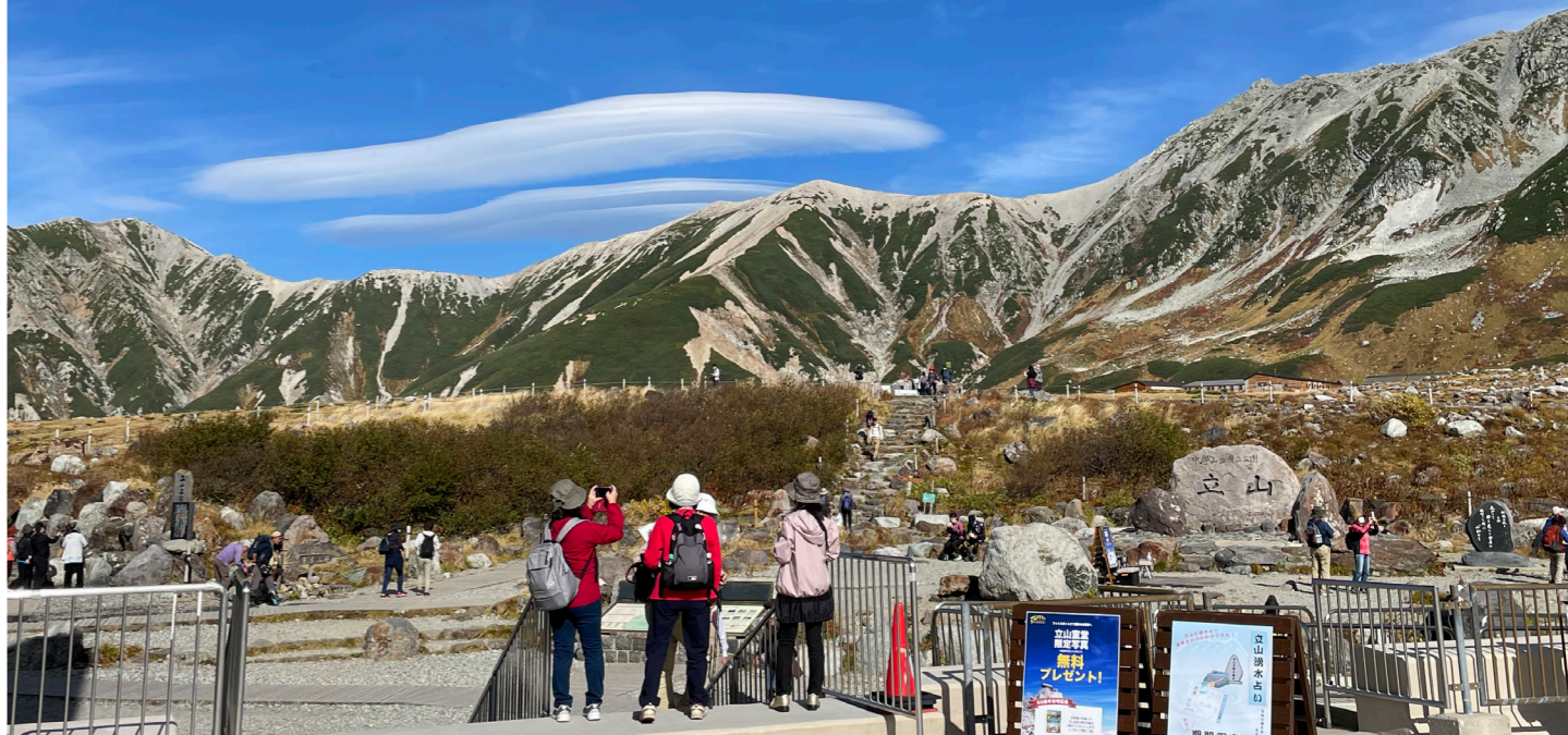
立山山麓、ホテル立山周辺の散策へ(8~9月イメージ)