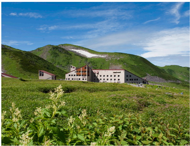
日本を代表する山岳ホテル、ホテル立山(8月イメージ)