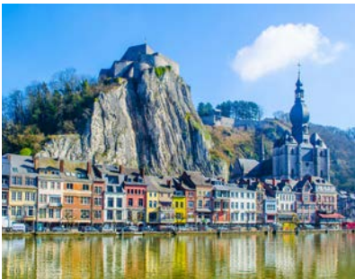
ディナンのシタデルとムーズ川の風景

ワロン地方の東側に位置するデュルビュイ。9世紀に築城、17世紀にウルセル伯爵の居城となったデュルビュイ城がそびえ、町には石畳の小道が続く、まるで絵本の中の世界をそのまま再現したかのような雰囲気のかわいらしい町です。風景はもちろん、可愛い装飾で彩られた家々や馬車が走る通りなど、のどかな町の散策にご案内します。ベルギーの南から北東に流れるムーズ川沿いにも珠玉の町々が広がります。断崖のシタデルとその麓の町・ディナンなど、町により異なる景色をお楽しみください。