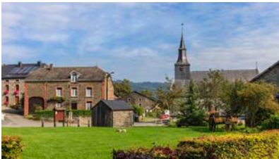
ワロンの最も美しい村のひとつ、ラフォレ

「フランスの最も美しい村」が選定されたのと同様に、ベルギーにも「ワロンの最も美しい村」に登録された24の村があります。そのひとつであるトルニーは、フランスとの国境を流れるシエール川沿いに広がるベルギー最南端の村。川を越えるとフランスというだけあって、他の村とはどこか違う雰囲気です。蜂蜜色の砂岩でできた家が並び、ムーズ川に映る風景は見事です。また、アルデンヌの村ラフォレは、スモア川の右岸、緑豊かな背景の中で身を寄せるように佇む小村です。