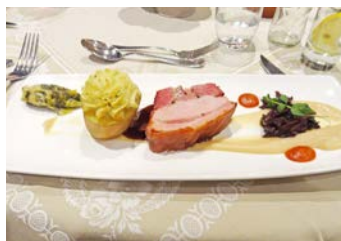
夕食も楽しみです(イメージ)