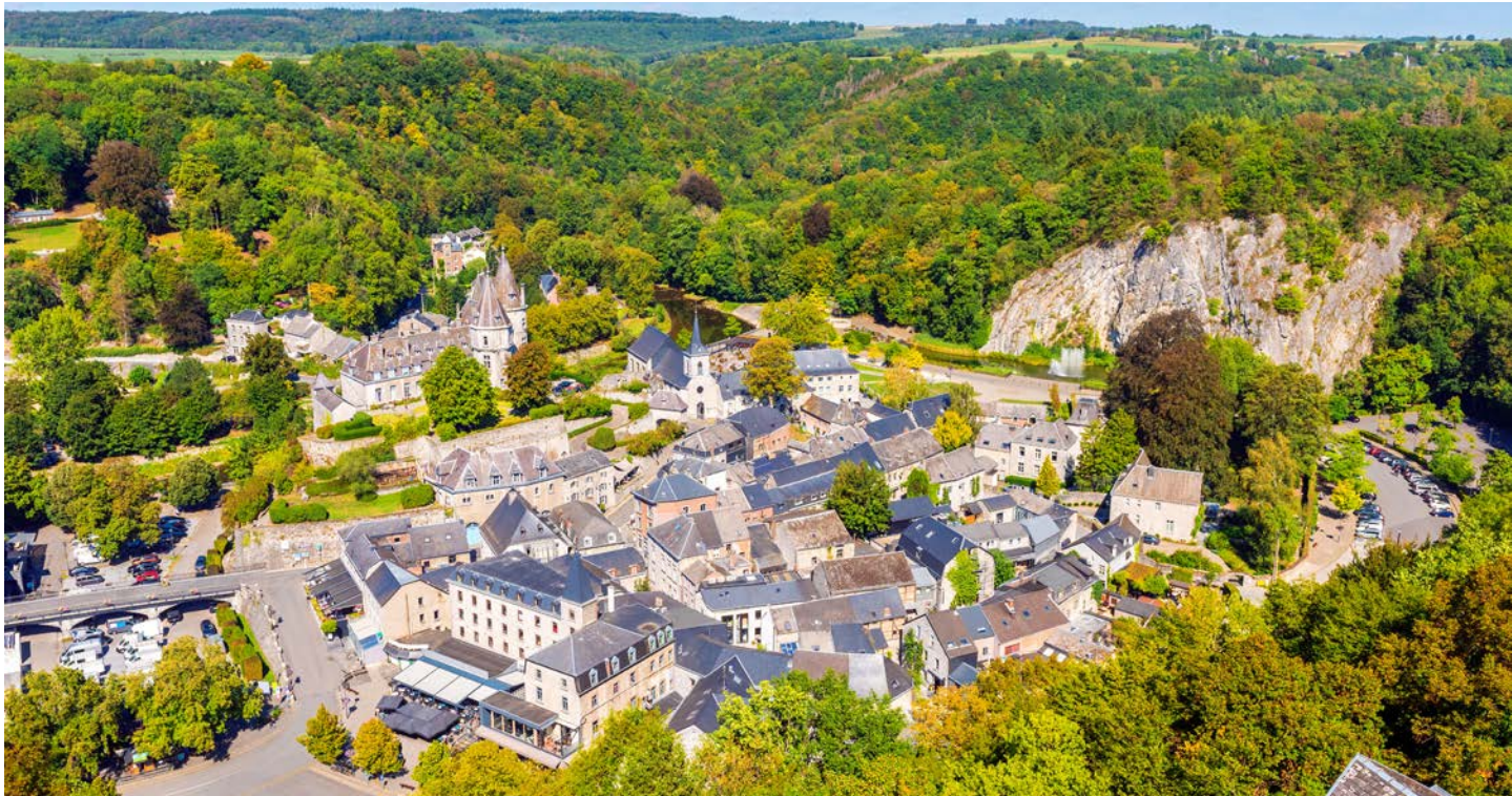
中世から変わらない美しさを保つデュルビュイ (イメージ)