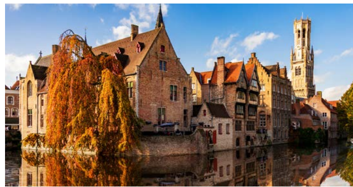
秋色に染まるブルージュは美しく散策が楽しい町です

は旧市街の中心マルクト広場まで徒歩10分弱のところに位置します。朝夕の静かな時間帯に水の都ブルージュの散策をお楽しみいただけます。