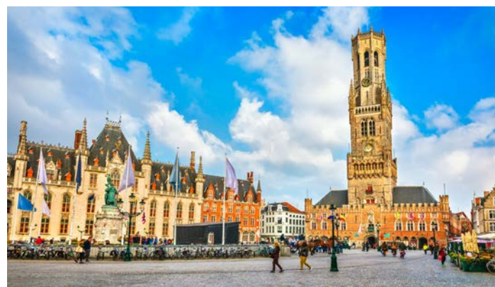
ブルージュ旧市街の中心、マルクト広場。ホテルから徒歩で10分弱です

■最少催行人員：10名様 ■食事：朝食7回、昼食6回、夕食5回 ■添乗員：羽田空港または成田空港ご出発時から羽田空港または成田空港ご到着時まで同行します。 ■バスポート必要残存有効期間：帰国時3か月以上 ■バスポート査証未使用欄：2ページ以上必要