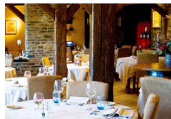
オーベルジュのレストラン

に国境を越えて訪れるほど人気が高く、予約の取りにくいオーベルジュです。夕食では、自慢のコース料理をお召し上がりください。