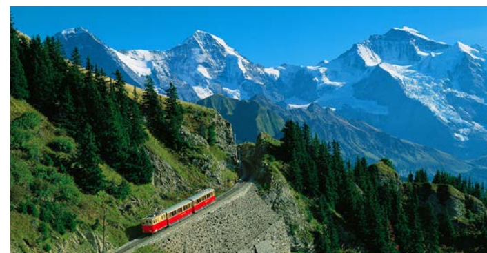
ユングフラウ三山を眺めるシーニゲプラッテにもご案内します