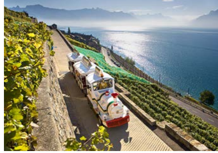
かわいい列車型の車でブドウ畑を縫うように進みます (イメージ)