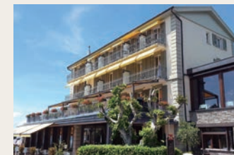
レマン湖畔に佇むパロン・タヴェルニエ・ホテル&スパ

旅の最後はレマン湖畔での滞在をお楽しみいただけます。宿泊は世界遺産ラヴォー地区にあるシェーブル村です。レストランのお食事もお楽しみいただけます。ホテル前のテラスからはレマン湖とぶどう畑が一望できます