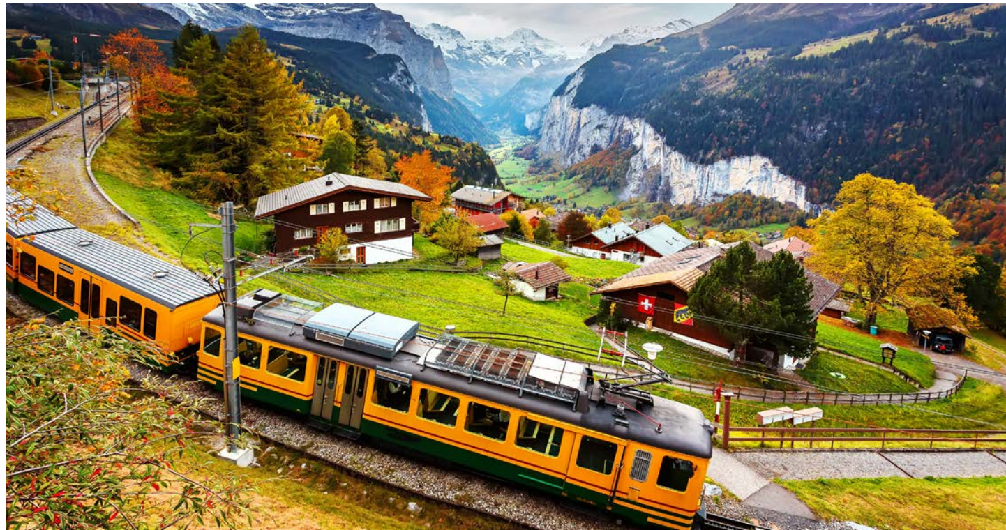
ユングフラウの麓、ラウター谷を見下ろすヴェンゲンの町に宿泊します (イメージ)