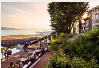
ホテル前のテラスからはレマン湖とぶどう畑が一望できます