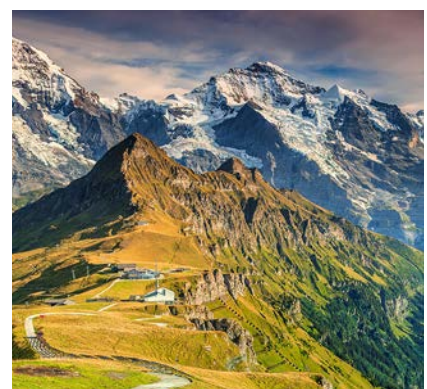
ヴェンゲンからロープウェイを使えばメンリッヘンはすぐそこです