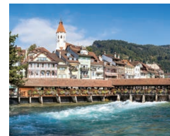
屋根付きの橋が残るタウンの町

ベルナーオーバーラント(ユングフラウ地方)の魅力はアルプスの山々だけではなく、山々に抱かれた谷や点在する湖の織り成す風景もその一つです。このたびは、タウン湖の遊覧で船上から風光明媚な景観をお楽しみいただけます。また、12世紀の古城と屋根付きの木造の橋が印象的なタウンの町の散策も楽しみです。