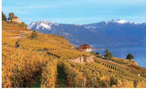
景色の良いポイントで写真ストップの時間も取ります (イメージ)

世界遺産に登録されるレマン湖畔北岸のラヴォー地区。希少価値の高いスイスワインの中でも良質のワイン産地として知られます。葡萄畑の間を縫うように伸びる小道をミニトレインで走り、眼下に広がるレマン湖の風景を満喫します。また、石畳が敷かれ可愛らしい家々が立ち並びサン・サフォラン村にも立ち寄り、ワイナリー訪問も楽しめます。