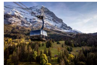
アイガー北壁の真横を通るアイガー・エクスプレス。アイガーグレッチャーとグリンデルワルト約15分で結びます

滞在中には、ユングフラウ三山を眺めることのできるシーニゲプラッテ展望台へご案内し、様々な角度から大自然を楽しめます。