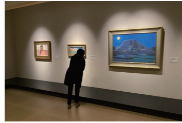
巨匠・平山郁夫画伯の作品を多く収蔵

1998年、琵琶湖の畔に開館した佐川美術館。いずれも日本を代表する芸術家である日本画家の平山郁夫、彫刻家の佐藤忠良、陶芸家の十五代樂吉左衛門の作品を中心に展示し、個性豊かな企画展も人気の高い美術館です。大きな水庭に浮かぶように佇む3棟の建物もまた印象的で、その建築美も高く評価されています。