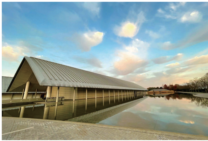
佐川美術館 四季の移ろいを映し込む水庭が目を引きまます (イメージ)