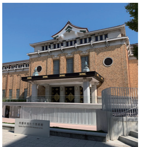
京都市京セラ美術館

1933(昭和8)年開館、関西を代表する美術館のひとつである京都市美術館が、2020年リニューアルオープン。創建当時の和洋が融合した意匠を最大限保存しつ