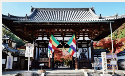
源氏物語ゆかりの石山寺

2024年の大河ドラマ「光る君へ」の放映でも話題の『源氏物語』。藤原氏が栄華を誇った平安時代中期に、貴族社会の栄枯盛衰、恋愛模様を綴った大作は、世界最古の長編小説とも呼ばれ世界的な評価を得ています。今回は、紫式部が源氏物語の構想を練り、起筆したと言われる石山寺や、紫式部の邸宅跡である盧山寺を訪れます。