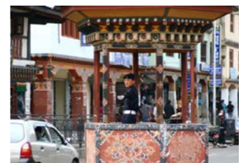
信号はなく警官が交通整理

ます。町中のホテルをご用意しておりますので、今も変わらないブータンの人々の暮らしぶりをより間近に、肌で感じていただけることでしょう。