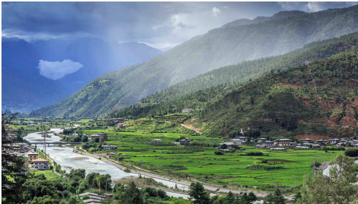
ブータンの中で最も美しいともいわれるパロ谷。山岳国が国土の大部分を占めるブータンにあって比較的平地が広がります