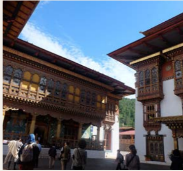
釘を1本も使わずに組み立てられた伝統建築の粋をご覧ください