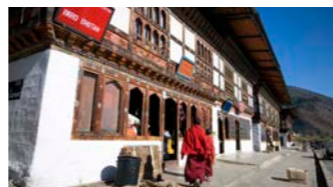
のんびりとした時間が流れるパロのメインストリート