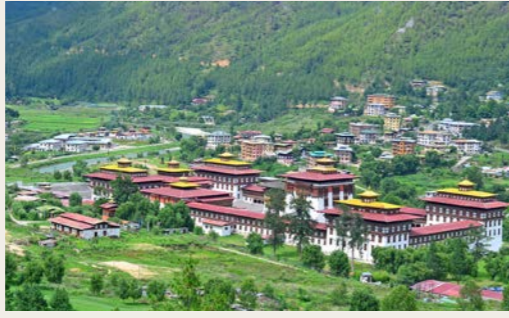
ダシチョ・ゾン 国会議事堂のほか、国王や大僧正の執務室など100以上の部屋があり、敷地内には2000人の僧を擁するブータン最大の僧院を擁します

ブータンの見どころに「ゾン」があります。17世紀にブータンを統一したシャブドゥン・ンガワンナムゲルによって建造されたことに遡ります。敵からの攻撃から守る城砦であり、現在は官公庁と宗教施設が同居しています。これが各地に築かれ、パロにも、ティンパーにもあります。なかでもティンパーのダシチョ・ゾン、国王と宗教界のトップ、ジェ・ケンポ（大僧正）の執務室や国会議事堂もあり。現在は政教分離が憲法で定められていますが、政治活動と切り離れたところで、チベット仏教は今も大きく影響を及ぼしています。そのブータンの象徴たる建物が、ゾンといえるでしょう。