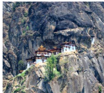
タクツァン僧院 ブータンに仏教をもたらしたパドマサンババが虎の背に乗って舞い降りたという地に建っています