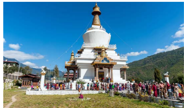
メモリアル・チオルテン。祭りの日など大勢の人々が礼拝に訪れます