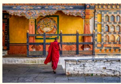
ゾン(城)やラカン(寺)には多くの僧が暮らします