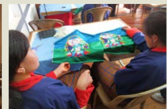
伝統工芸院でも生徒たちが13のブータンの伝統工芸を学んでいます