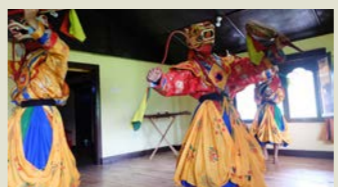
マスクダンス(イメージ)

ブータンの祝祭に欠かせないのが、マスクダンス(仮面舞踊)です。ブータンチベット仏教の開祖パトマサンババの偉業を今に伝える物語を踊りにして表現したものなど、仏教ゆかりの舞です。また各地に伝わる民俗舞踊もあり、このツアーではブータンの伝統舞踊をプライベート観賞いただける機会を設けました。