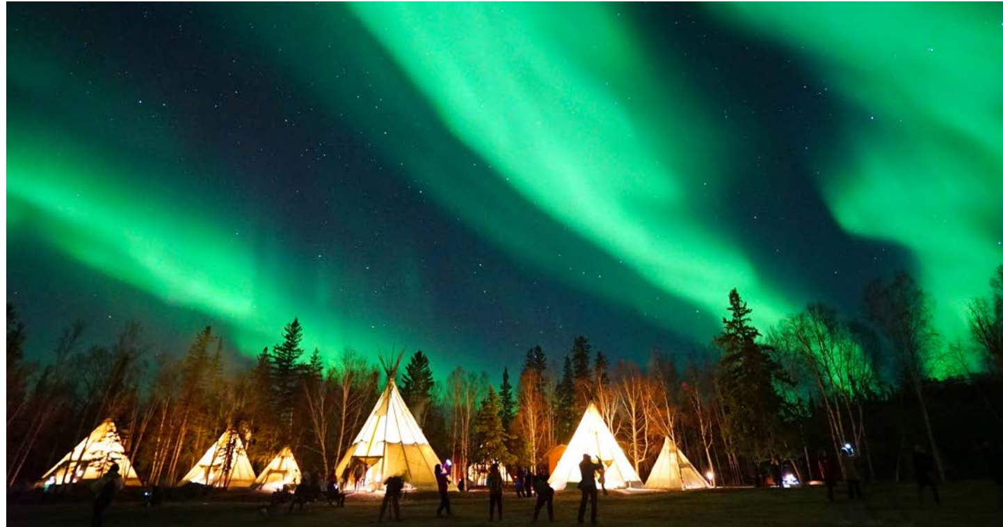
秋からオーロラの観賞率が高くなるイエローナイフで3夜のオーロラチャンス（イメージ）