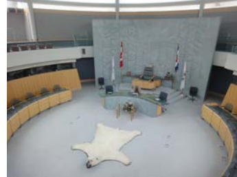
州議事堂でもホッキョクグマが横たわっています