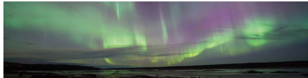
オーロラ(イメージ)

カナダ北部のイエローナイフと、カナディアンロッキーの観光拠点バンフにそれぞれ連泊し、オーロラ観賞と秋のカナディアンロッキーの大自然を満喫します。イエローナイフでオーロラが見られるのは年間240日以上で「オーロラの聖地」と呼ばれ、秋からオーロラ観賞のシーズンが始まります。オーロラだけでなく、日中の市内観光も組み込んでご案内します。そして後半はカナディアンロッキーへ。数々の氷河やターコイズブルーの氷河湖、針葉樹林の森の中に野生動物が息する自然の宝庫です。点在する湖の中で最も美しいとされるモレーン湖は、朝日に輝く時間帯にご案内します。その後、レイクルイーズへ。カナディアンロッキーの秋景色をお楽しみください。