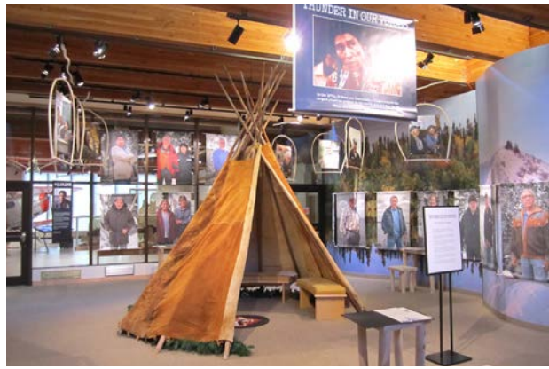
プリンス・オブ・ウェールズ博物館