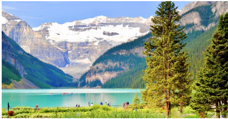
エメラルドグリーンに輝く美しいレイクルイーズ(イメージ)