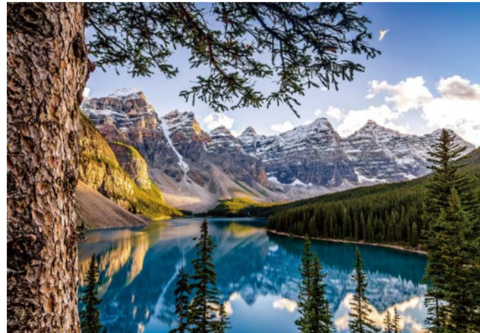
秋のモレーン湖 朝の静かな時間帯にご案内します(イメージ)

バンフから北西に約1時間、テンピックスなど周囲を山々に囲まれた美しい氷河湖がモレーン湖。鮮やかな碧青の湖面と雪山はまるで絵画を鑑賞するようで、その美しさはカナダ随一とも。かつてカナダドルの紙幣にも描かれていたこともそれを物語っています。日中は多くの観光客で賑わうモレーン湖ですが、朝の比較的早い時間に皆様をご案内します。静寂のモレーン湖はきっと忘れられない景色となることでしょう。