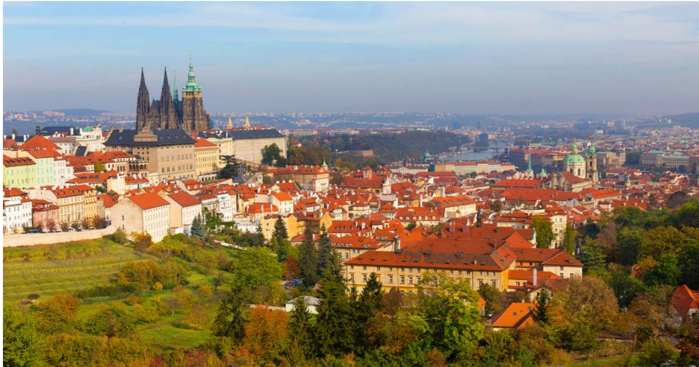
ペトシーンの丘からの眺め (イメージ)