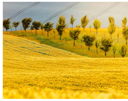
不思議な波打つ地形が美しい景色を作り出します(イメージ)