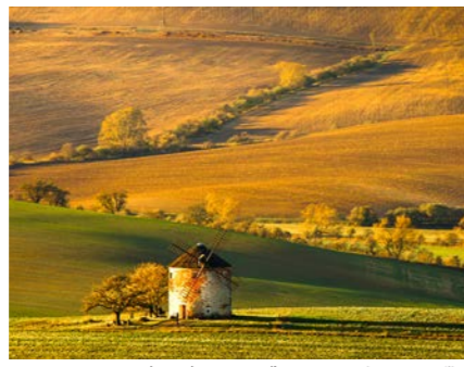
牧歌的な風景が広がるモラヴィア地方(イメージ)

マイクロフの東からキヨフにかけて広がる、波打つような丘陵の大絨毯。チェコの写真家が捉えた南モラヴィアの美しい風景が近年注目を浴びています。絵画のように美しい風景がイタリアのトスカナ地方にも例えられ、牧歌的で心温まる田舎の景色は、中世の街並みばかりではないチェコの魅力を伝えてくれます。春の緑の季節が知られますが、黄金に色づく秋景色も大変美しく、葡萄畑や小麦畑、牧草が織りなすグラーションは息を呑むほどです。(注) 木々の黄葉は自然現象の為、訪れる時期に必ず色づいているとは限りません。