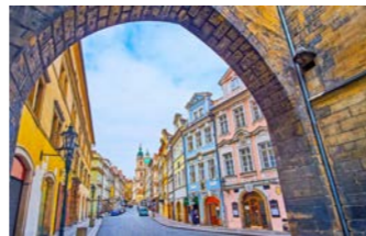
マラー・ストラナ地区には美しい小路がたくさん

モルダウ川東岸のプラハ旧市街地区が12世紀以降に築かれたのに対し、西岸のマラー・ストラナ地区は8世紀には既に市場が開かれていた歴史の古い地区です。プラハ城の発展とともに城下町として栄えたこの地区は、賑やかな旧市街に比べてどちらかというと穴場的な地区なので、朝の静かな街並みを散策するなど滞在をお楽しみください。観光ではプラハ城をじっくりとご案内し、口