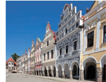
パステルカラーの家並みがかわいらしいテルチ

左右にずらりと並び家並みがかわいらしいテルチの町を訪ねます。それぞれの家主がその個性をファサードに表現し、彩り、細工なども色々で、見上げながら何気なく歩くだけでも時間を忘れてしまうような趣ある町です。