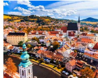
秋のチェスキー・クルムロフ (イメージ)

モルダウ河に抱かれた珠玉の町チェスキー・クルムロフ。中世の姿そのままに赤屋根で統一された美しい町並みには誰もがうっとりします。本来の静けさが戻る朝夕、宿泊者だけが味わえる贅沢な散策をお楽しみください。