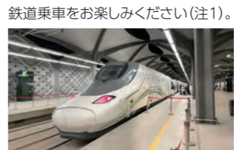
サウジアラビアの鉄道乗車体験をお楽しみください

全長453キロ、最高時速300キロ以上で走る、メッカ・メディナ高速鉄道(ハラマイン高速鉄道)は、サウジアラビアで最新の鉄道。運航開始は2018年で、世界中から集まる巡礼者が快適かつ安全にメッカとメディナを訪ねるために造られました。今回はメディナからジェッダまでの