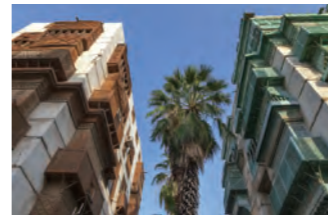
張り出し窓の建物が並ぶ、世界遺産のジェッダの歴史地区

窓が壁から張り出し、風通しを良くすると同時に日射しを遮るように造られた家々が特徴的で実に絵になります。