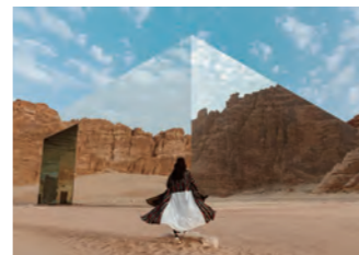
摩訶不思議な最新建築「マラヤ」コンサートホールの写真撮影をお楽しみください

アルウラの砂漠地帯のただ中に建つ「マラヤ」コンサートホール。息をのむような周囲の美しい風景を映し出すこの建築は、全面が9,740㎡の鏡面で覆われており、「世界最大の鏡張り建築物」としてギネス認定されております。世界に2つとはない写真映えする不思議な建築をお楽しみください。