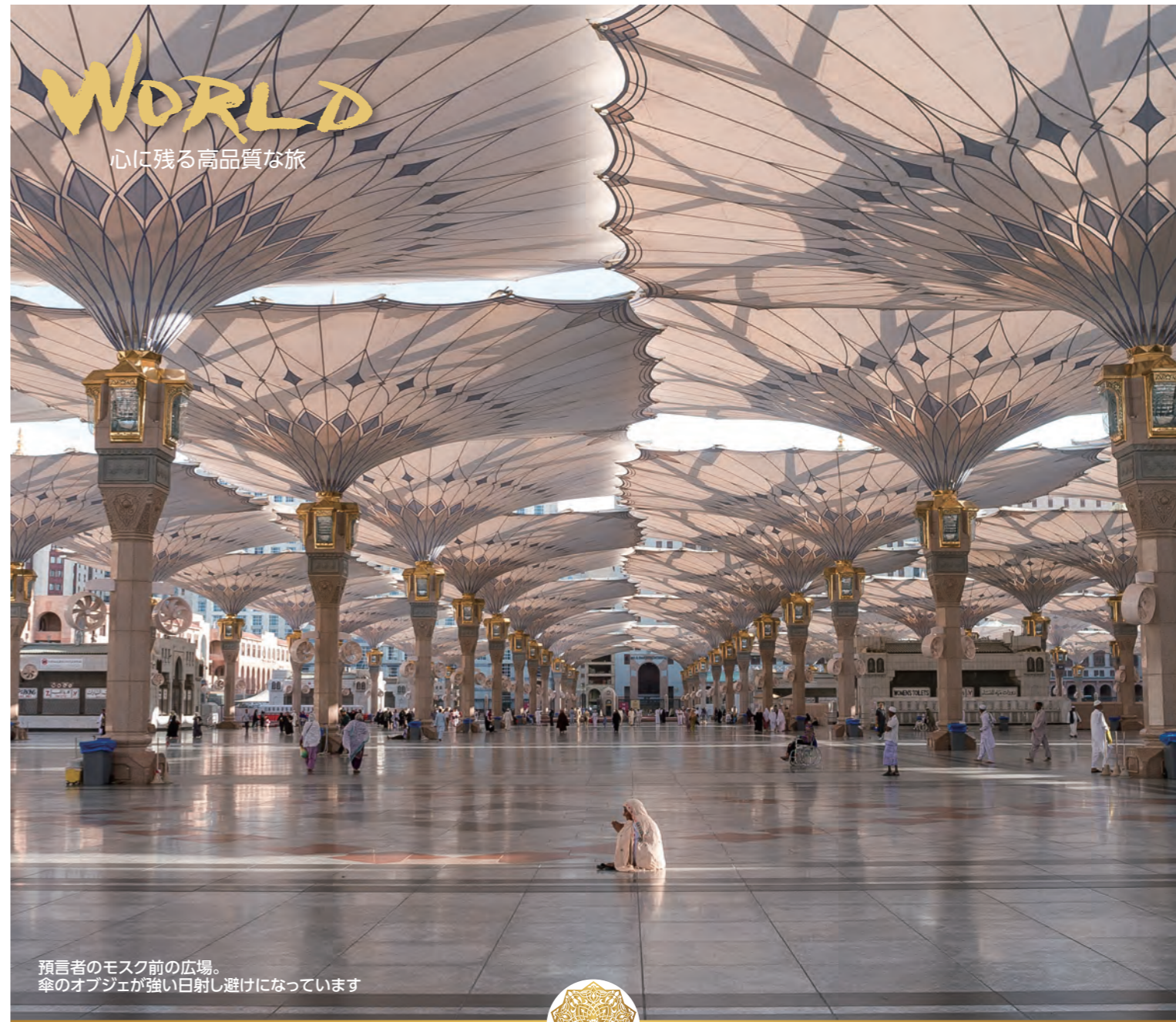
預言者のモスク前の広場。傘のオブジェが強い日差し避けになっています

ご旅行条件につきましては、このパンフレットに記載しました契約内容・条件の他、旅行条件書(全文)、確定書面(最終旅行日程表)及び当社の旅行業約款によります。ご旅行条件は、2024年4月1日現在の運賃・料金を基準としております。