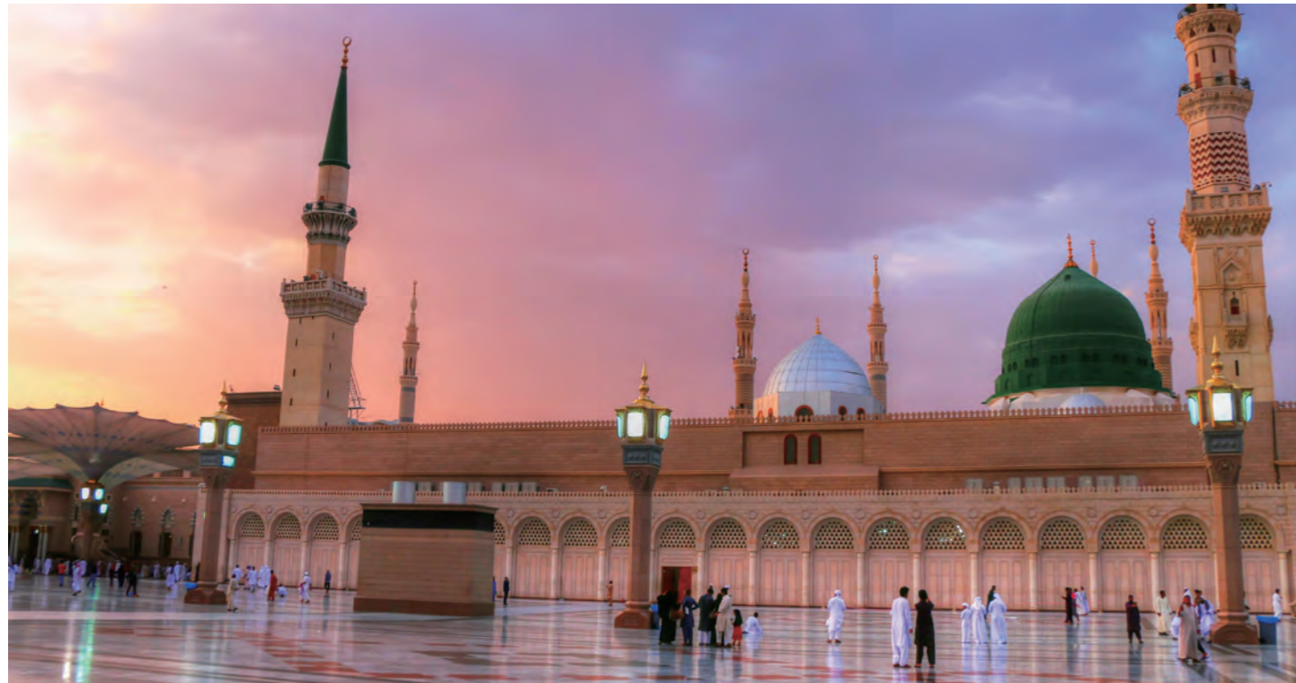
夕暮れのメディナのシンボル、預言者のモスク