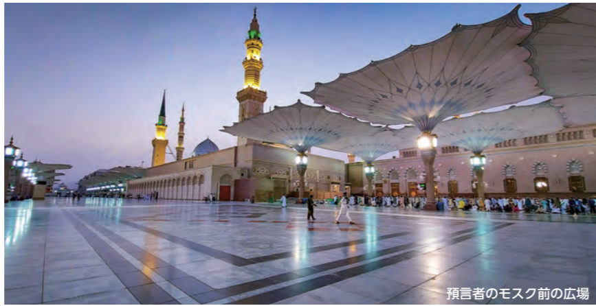
預言者のモスク前の広場