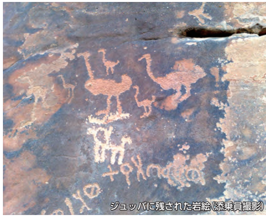
ジュバに残された岩絵