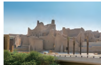
第一次サウ王国時代の都市遺跡が残るディライーヤ。世界遺産に登録されています