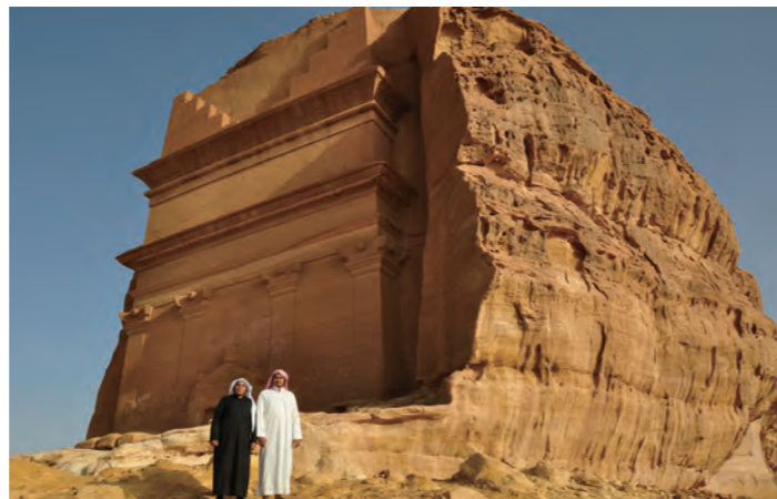
世界遺産マダイン・サーレには巨大な岩窟墳墓がいくつも見られます

された岩窟墳墓が砂漠の中に100以上残されており、その壮大な規模に圧倒されます。古代ナバテア人の息遣いにふれられる世界遺産です。