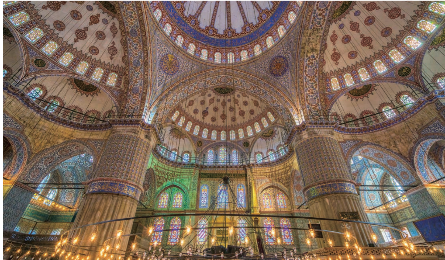
ブルーモスクは世界で最も美しいモスクとも紹介されています