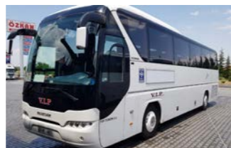
快適なバス旅行をお楽しみください

座席の配列が2-1列のため、車内の通路が広くゆとりがあります。シートは革張りや上質感のあるつくりです。お手洗いや洗面も完備されています。