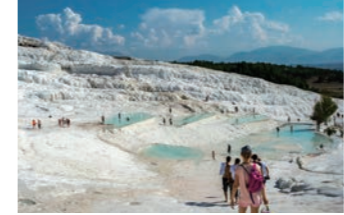
温泉保養地として知られる一面に白い石灰棚が広がるパムッカレ(イメージ)

さに自然の芸術作品です。陽光に煌めく白い石灰棚は、まぶしくて直視できないほどの輝きを放ちます。