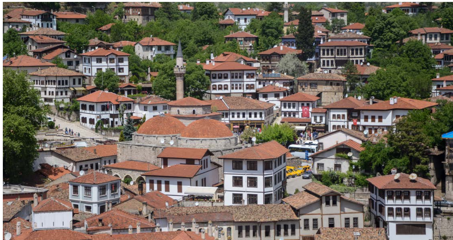
昔ながらの家並みを残すサフランボル。ひしめきあうように赤屋根の家々が建ち並びます