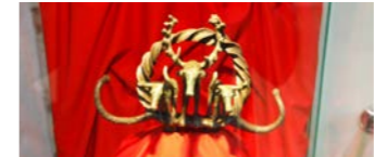
スタンダードの工芸品

とも呼ばれています。王墓から出土したスタンダードと呼ばれる青銅器や鉄製品など、貴重な歴史遺産です。