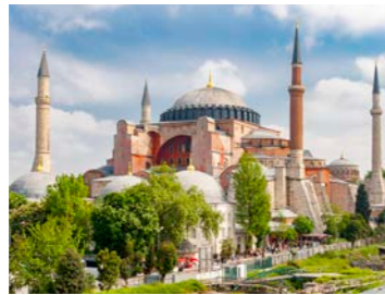
イスタンブール、再びモスクとして利用されているアヤ・ソフィア寺院

日本の約2倍と広大な国土を誇るトルコ。ヨーロッパとアジアに跨る世界遺産の古都イスタンブールはよく知られていますが、魅力はそれだけではありません。地中海やエーゲ海に面した温暖な地中海性気候の地には古代ギリシャや古代ローマ文明によって栄えた歴史が刻まれ、中央部から東部の山岳地帯では独特な気候と風土が作り上げる絶景が広がるなど、多様な魅力にふれることができます。しかし国土が広い分だけ、移動するにもそれなりの時間を要します。このコースでは国内線を3回利用し移動時間を通常のバスのツアーに比べて大幅に減らして各地に連泊。9日間でトルコの主要な見所を巡る周遊コースに仕立てました。イスタンブール3連泊からスタートし、奇岩の景観カッパドキア、綿の城の意味を持つパムッカレ、エーゲ海沿いの古代遺跡の町エフェソスなど、ゆったりとお楽しみください。