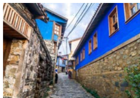
ブルサ郊外に位置するジュマルクズク

トルコは日本の約2倍もの国土を持ち、人類最古の宗教施設からオスマン帝国の建築に至るまであらゆる時代の史跡から美しい自然景観まで各地に点在している、大変に見所が多い国です。一般的な人気の観光地をツアーで巡る際、効率よく国内線を利用するのもひとつの方法。他方、ゆっくり時間をかけながらバスで周遊するのもまた魅力的です。道中、目にするトルコの風土はより旅の印象を深く濃く縁取り、3,000キロを走破した達成感バスの旅でしか味わえない醍醐味です。またバスの旅だからこそ、有名観光地ばかりではなく、注目を集めないものの、味わい深い小さな町や村に立ち寄れるのも大きなメリットです。15日間の長旅になりますが、連泊を主体にした日程を組み、移動のお疲れを軽減すべく、デラックス・バスを利用します。旅好きの方にご注目いただきたいトルコ周遊コースです。