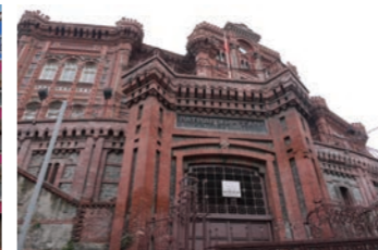
唯一の正教会「イスタンブール・ギリシャ正教会・総主教座」