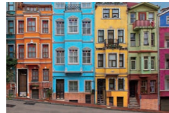
バラット地区にはカラフルな家が軒を連ねています(イメージ)

唯一の正教会が残されるなど、散策が楽しいエリアです。カラフルな家が建ち並んで下町風情が漂い、子どもたちが路上で遊ぶ姿なども見られます。