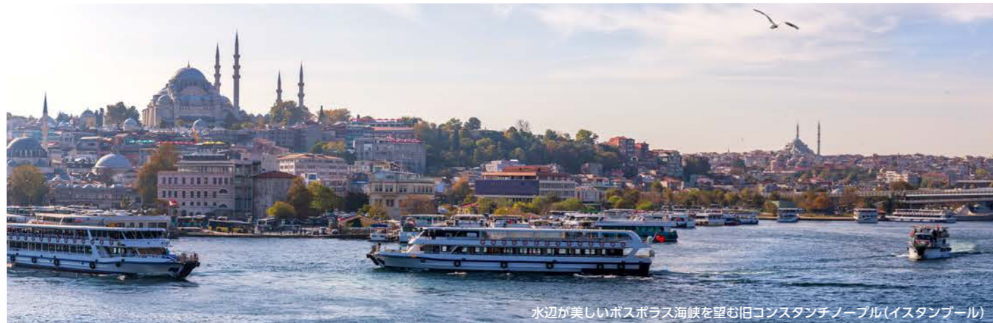
水辺が美しいボスポラス海峡を望む旧コンスタンチノープル(イスタンブール)