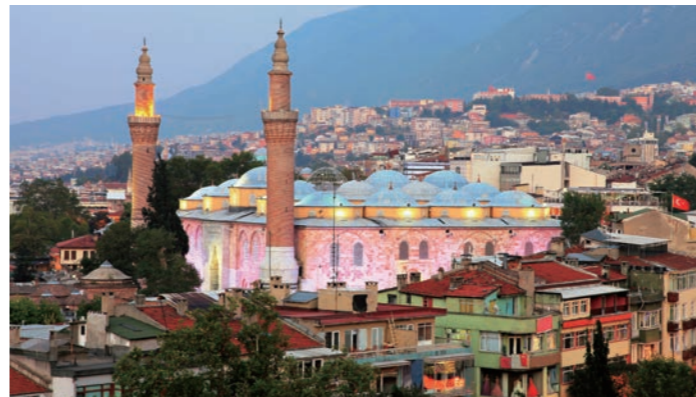
ピンク色の外壁が印象的なウル・ジャミー

も交流のあった歴史の深い町です。オスマン朝の初代から第5代までのスルタン廟が残され、大帝国の第一歩を後世に伝えています。ツアー締めくくりの連泊地にふさわしい古都です。