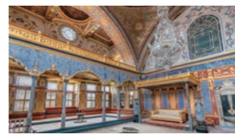
大規模な修復作業を終えたトプカプ宮殿、きらびやかなハーレム

いただけます。旧市街の中心に位置するホテルを確保しましたので、自由時間も含めて古都イスタンブールを満喫いただけます。