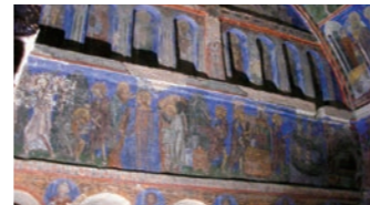
ギョレメの暗闇の教会には色鮮やかなフレスコ画が

込むことがなかったため、保存状態の良い色鮮やかなフレスコ画が今も見られます。またツアーでは通常観光に加え、ローズバレーから絶景の夕日を眺めます。