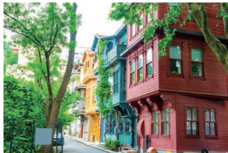
「ボスポラスの真珠」クズグンジュックを散策します。2階、3階がせり出したユニークな家並みが見られます

「東西文明の十字路」と称されるトルコ。とりわけその象徴ともいえるべきイスタンブールは、ローマ帝国、ビザンチン帝国、そしてオスマン帝国という延べ1000年以上にわたって続いた大帝国の都でした。現在はヨーロッパとアジアの架け橋として、目まぐるしく変化を遂げる世界都市である一方、悠久の古都として世界遺産をはじめ、価値ある歴史遺産を数多擁しています。今回は旧市街、新市街に3連泊ずつして、それぞれの見どころを探訪します。宿泊はそれぞれ散策に好立地の高級ホテルをご用意しました。こだわりの観光・お食事とともに各地区での滞在をお楽しみください。