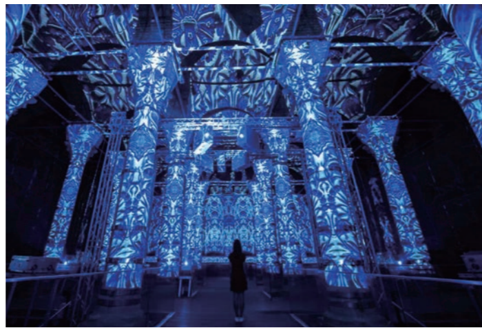
テオドシウスの地下貯水池 360度のプロジェクトマップで幻想的な世界が現れます(イメージ)

を征服したメフメット二世が15世紀に建てたトプカプ宮殿は、これまで公開されていなかったエリアも見学できるようになり、参観スペースが広がりました。2018年に初公開されたテオドシウスの地下貯水池にもご案内し、トルコ初という360度のプロジェクトマップを利用したショーをお楽しみください。