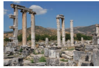
紀元前3世紀の都市遺跡が今も残るアプロディシアス