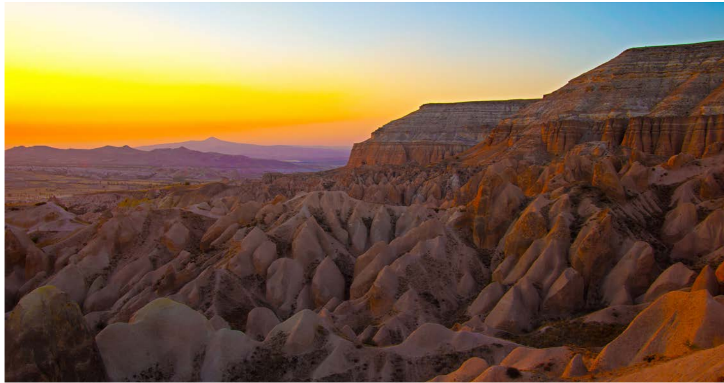
夕日に赤く染まるローズバレー (イメージ)