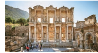
ケルスス図書館 1万2000巻ものパピルス図書館を所蔵していたと