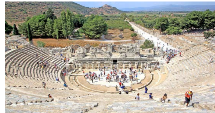
2万4000人を収容した半円形劇場