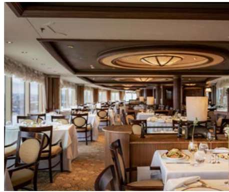
スイートキャビン専用のメイン・ダイニング「プリンセス・グリル」(イメージ)