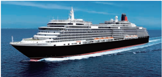
伝統と格式を誇るクイーン・ヴィクトリア

180年以上の歴史を誇る船会社・キュナード社が保有する客船の中でも、ファンが多いのがクイーン・ヴィクトリアです。ヴィクトリア女王が治めた時代は、外交、軍事、化学、建築そして文学などあらゆる分野でイギリスが世界に冠たる大英帝国の最盛期を築き、世界各地の植民地化によってその版図を最大に広げた時代でした。まさに船内はその時代の伝統と気品を体現する内装で、天然の木材がふんだんに使われており、落ち着いた雰囲気も醸し出されています。