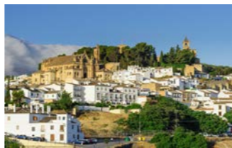
アンテケラの町並み

します。村は高台に位置しており、ジブラルタル海峡をのぞむ眺めもお楽しみください。