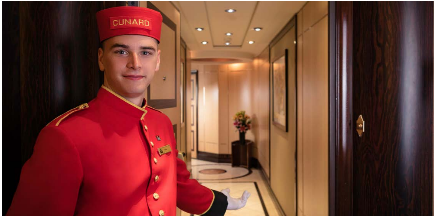
伝統的なサービスでお迎えます (イメージ)