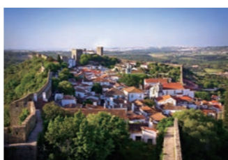
城壁に囲まれたオビドスの町並み(イメージ)

ポルトガルの首都リスボン寄港時には、周囲1.5キロほどの城壁に囲まれたオビドスの町を訪ねます。白壁に赤い屋根の家々が並び、中世の雰囲気が漂う実に美しい町です。旧市街の散歩をお楽しみいただけます。