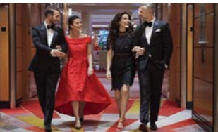
伝統の船だからこそおしゃれも楽しみたい。貴族文化の名残であるドレスコード

最近では、ドレスコードが簡略化される船も多いですが、伝統を守るこの船にはドレスコードがあります。と言っても、毎日ではありませんので、窮屈になりすぎずに高級レストランにおでかけするつもりで、雰囲気に合わせておしゃれもお楽しみください。