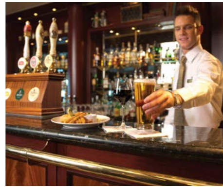
英国風パブでのお食事もお楽しみいただけます(イメージ)