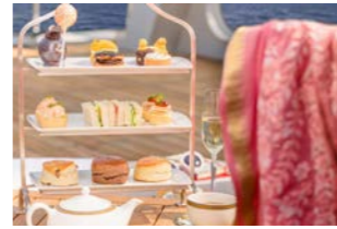
アフタヌーンティー (イメージ)

生演奏が流れる優雅な雰囲気の中で、ホワイトスター・サービスの資格を持つ白手袋をはめたスチュワードがサーブするアフタヌーンティーが無料でお楽しみいただけます。また英国風パブ「ゴールデン・ライオン・パブ」では、フィッシュ&チップスやコッテージパイなどのパブ・ランチのサービスがあり、その日の気分に合わせてお食事が選べるのも嬉しいポイントです。