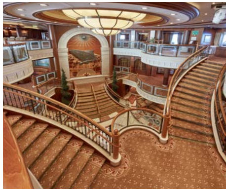
クラシックな雰囲気の大ホール