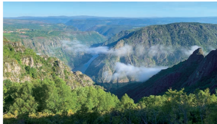
丘の上から見下ろすシル溪谷の絶景(2023年5月)

スペイン最北西部ガリシア地方の「緑」を象徴する風景に出会えるシル溪谷。ロマネスク建築が今でも数多く残り、その隠れ里のような様子から修道士が暮らす「聖なる秘境」と呼ばれます。白ワインの産地としても有名で、展望台から見渡すどう