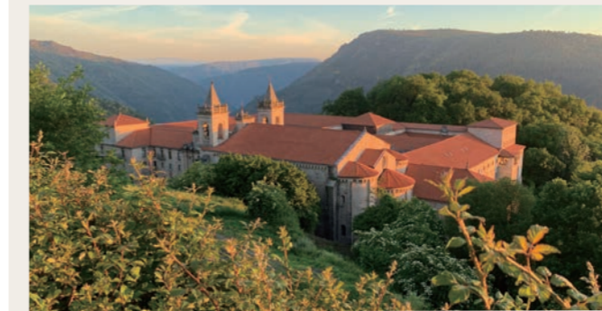
夕暮れのシル溪谷のパラドール 聖なる秘境の異名もさもありなん、の絶景です

地方色豊かなスペインにおいて、各地でのパラドール宿泊は旅の楽しみの一つ。このたびはシル溪谷とバイオナにてパラドールでの連泊をご用意しました。前者はシル溪谷を見下ろす、6世紀建造の歴史ある修道院を改装した建物が特徴で、元修道院らしく立派な中庭を持ちます。また後者はビーゴ湾の入り江の先端、モンテ・レアル岬に建つ城壁の要塞に囲まれた古城パラドール。三方が海に面し、松林に囲まれた風光明媚なパラドールです。観光の後は、少しのんびりと過ごしていただきたいホテルです。溪谷と海。二つの異なるパラドールを通し、スペインの地方色を体感ください。