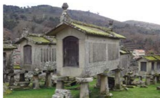
ソアーゾのエスピゲイロ(高床式穀物倉庫)

10世紀の城から15世紀の公爵家まで、大航海時代を迎える黄金期以前に建てられた中世の古い建物が趣を添える世界遺産の中世都市ギマランイスに連泊しながらご案内します。