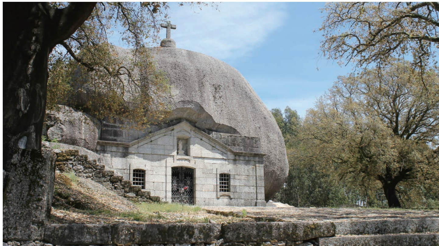
ソウテロ村の聖ラバ教会 まるで宇宙から降ってきた隕石が載ったかのような奇観です