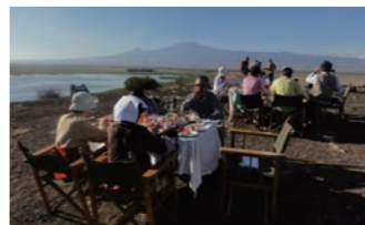
キリマンジャロを望みながらの朝食は、忘れられないひとときに

アンボセリの大自然の真っ只中、オブザベーション・ヒルと呼ばれる小高い丘の上にテーブルを用意し、朝食をお召上がりいただけます。文豪ヘミングウェイが愛したキリマンジャロの雄姿を望みながら乾杯しましょう。