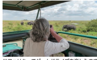
サファリカーでゲームドライブを楽しみます(イメージ)