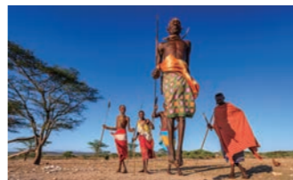
アフリカの大地とともに生きるマサイ族

マサイマラやアンボセリなどの公園内には、自然とともに生活をするマサイ族の村が点在しています。アンボセリ滞在中には彼らの村を訪ね、伝統の生活にふれていただけます。