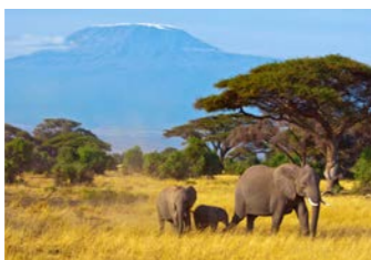
アンボセリ国立公園 キリマンジャロを背景に、仲良しゾウの親子(イメージ)

ケニアの旅の醍醐味といえば、ビッグ5（ライオン、ヒョウ、ゾウ、バッファロー、サイ）を追い求め、広大なサバンナをサファリカーで巡るサファリです。ケニアの7月から9月は乾季にあたるためサバンナの茂みの背が低くなり、動物を見つけやすくなることから、サファリには好適な季節といえます。アンボセリ、マサイマラとも、動物たちが特に活発となる早朝と夕方の時間帯を中心にサファリへ出かけます。アンボセリでは、ホテルの敷地からもキリマンジャロの雄姿が望める国立公園内のロッジを、マサイマラでは自然保護区内のロッジをご用意しました。