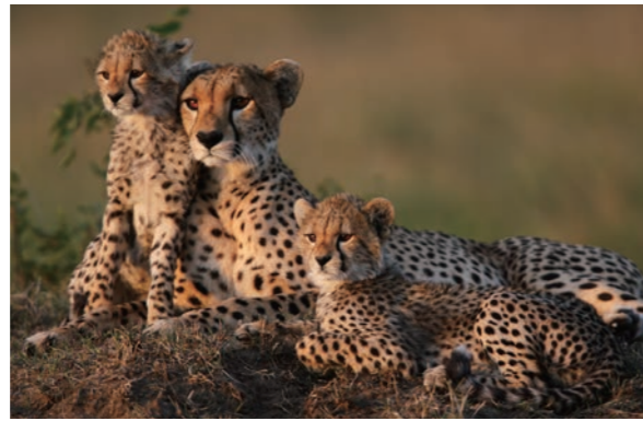
チーターの親子(イメージ)