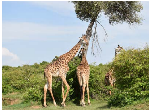
キリンの親子(イメージ)