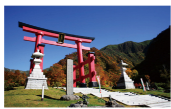
参拝の入り口にあたる湯殿山大鳥居