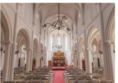
鶴岡カトリック教会天主堂は日本の明治期のキリスト教文化を今に伝える「畳の教会」のひとつ

北前船の寄港地として栄えた庄内地方。今でも古い町並みが残り、北前船の文化が残っています。今回は、ハイカラな城下町・鶴岡にスポットを当ててみました。中でも必見は、鶴岡カトリック教会天主堂の美しさです。明治36年に建てられたロマネスク建築の傑作とされ、国の重要文化財に指定されており、特に珍しいのがステンドグラスとは異なる独自の技法で作られた「窓絵」と、国内唯一の「黒い聖母マリア像」。そして、日本ならではの畳敷きの教会です。