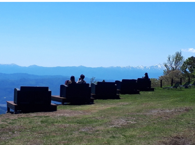
ゆったりと景色を堪能できる百万人テラス(イメージ)