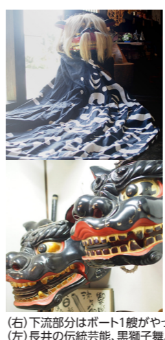
(右) 下流部分はボート1艘がやっとの幅に(イメージ) (左) 長井の伝統芸能、黒獅子舞。燗亭工房には多くの獅子面が保存されています

にあるため、渓谷を参道と見立て、通り抜け参拝として、パワースポットにもなっています。龍神となった卯の花姫は、黒獅子舞として今も長井地方の伝統芸能として残されています。通り抜け参拝の前には、この黒獅子舞の獅子面彫り師が営む食事処「獅子宿燗亭(いぶりてい)」で昼食。黒獅子面を保存、製作する工房も見学します。最上川の秘境に残る伝説の地を巡ります。