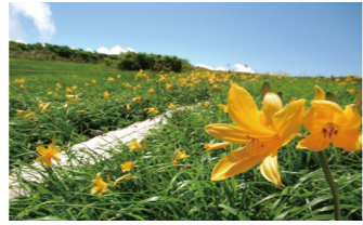
高山植物が楽しめる月山弥陀ヶ原湿原(イメージ)

※月山八合目・弥陀ヶ原の訪問について、例年の高山植物の見頃に合わせてツアーを設定しておりますが、その年の気候に左右されるため、必ずしも「見頃」をご覧いただけるわけではありません。予めお含みおきください。