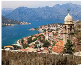
世界遺産コトルの絶景

年もの間、ベネチア共和国によって支配されていた古都。ドアや窓、そしてバルコニーなど旧市街の建造物は数百年前のベネチアのローマ様式で街並みが統一されています。