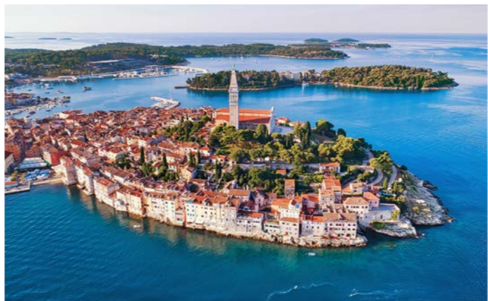
ベネチア共和国時代の栄華漂う珠玉の町並みロヴィニ。南欧の港町でも群を抜いた美しさです

と言われる卵型の半島に石造りの町並がびっしりと並びロヴィニやローマ時代からの円形競技場コロッセオが残るプーラなど、ベネチア共和国時代の栄華漂う珠玉の港町をつぶさに訪ねます。