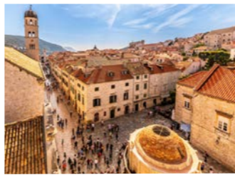
ドブロヴニク旧市街 趣たっぷりの散策をお楽しみください（イメージ）

く、自由時間を設けており、徒歩10分の好立地なホテルをご用意しているのも当社のこだわりです。