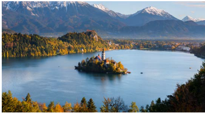
スロベニアの美しい自然景観 ユリアンアルプスを背に横たわるブレッド湖