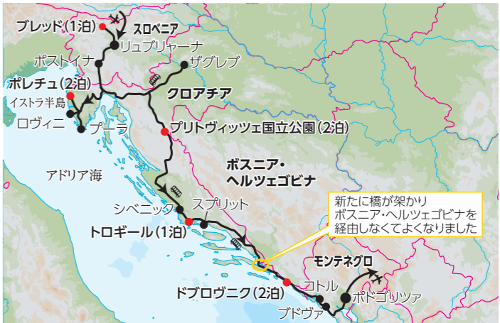
利用予定航空会社：ターキッシュエアラインズ ツアーコード：EC040T

弊社では、これまで各国の正式な評価基準に基づき、利用ホテルの★の数を記載してまいりました。しかしながら、昨今は欧米の大手ホテルチェーンであっても未登録のホテルが増えてきていること、★の数が必ずしもホテルの品質を担保するものではない現状を鑑み、ホテルの★の掲載を取り止めております。なお、これまで通りツアー内容やコンセプトに合わせて可能な限り快適なホテル選定を心がけております。