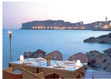
ホテルから海越しに眺めるドブロヴニクの旧市街も風情があります（イメージ）

「旧ユーゴスラビア」と呼ばれていた時代から、多くのお客様にご好評をいただいていたクロアチアとスロベニアの旅。高速道路の開通など、インフラが整備されたことでルート面で無駄なくスムーズにご案内することができるようになりました。このたびは、3カ所の連泊を設け、ドブロヴニクをはじめとするアドリア海沿いの世界遺産の町々やプリトヴィツェ国立公園、「アルプスの瞳」と称えられるブレッド湖など、主要な見どころをじっくりとご案内します。プリトヴィツェ国立公園の観光では、公園入口まで徒歩圏の立地のよいホテルをご用意しましたので、水と森の織り成す絶景をお楽しみください。ドブロヴニクでは観光や散策をたっぷりとお楽しみいただけるよう、旧市街まで徒歩10分程度に位置するホテルを確保しました。旅の前半は日本ではほとんど知られていない美しい町の宝庫、イストラ半島へ。一筆書きの効率の良いルートで、モンテネグロの世界遺産コトルにも足を延ばす行程としています。