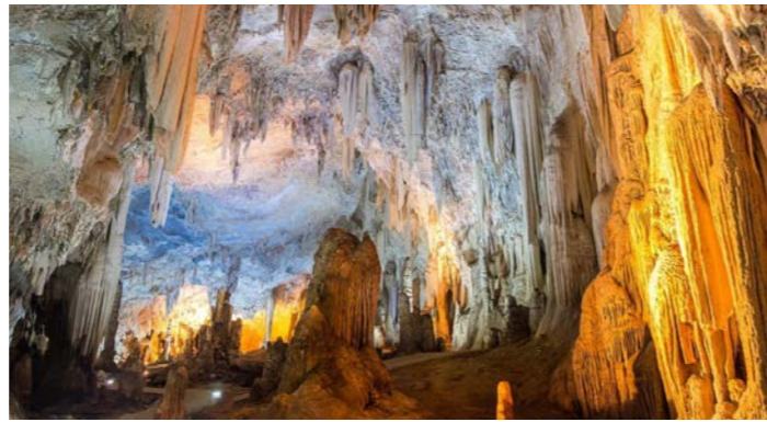
スロベニアの誇る大自然 世界有数の美しさポストイナ鍾乳洞