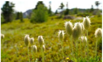
ウェスタンアネモネ開花後の綿毛