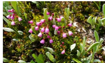
レッドマウンテンヘザー (ツガザクラ)