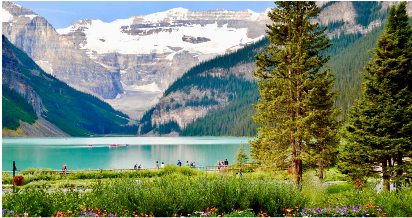
レイク・ルイズも訪ねます (イメージ)