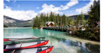
ヨーホー国立公園のエメラルドレイク

と朝日に輝き始める時間帯に皆様をご案内します。早朝の出発となりますが、静寂のモレーン湖はきっと忘れられない景色となることでしょう。