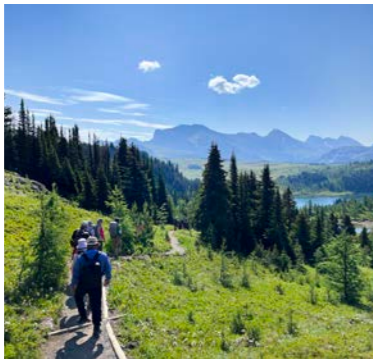
ハイキングをお楽しみください