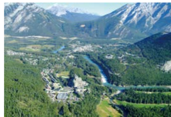
サルファール山から眼下に望むバンフの町とボウ川

ン、スーパーなどをオリエンテーションにてご案内します。基本的には添乗員がご案内しますが、時にはカナディアンロッキーを自由気ままに行動してみよう、そんなことも実現できる内容としています。