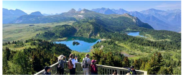
チェアリフトでまずはスタンディッシュ展望台へ。前方に見える湖や池のあたりは高山植物が見ごろを迎えます

ンドラに乗り10分程度で出発点であるネイチャーセンターへ到着です。アメリカ大陸の大陸分水嶺にあるこのルートには高山植物が咲くメドウ(高原)と湖と池があり、周囲の山々の素晴らしい眺望も楽しめます。