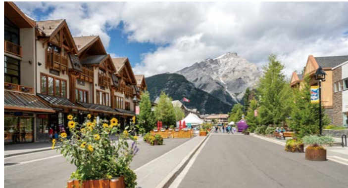
バンフ国立公園の中心にあるバンフの町。バンフ大通りにはレストランやショップが軒を連ねます