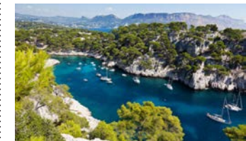
入り組んだ入り江のポートクルーズへ(イメージ)

い。また石灰岩の複雑に入り組んだ入り江と透き通った青い海の調和が非常に美しいレ・カラックのポートクルーズもご案内します。