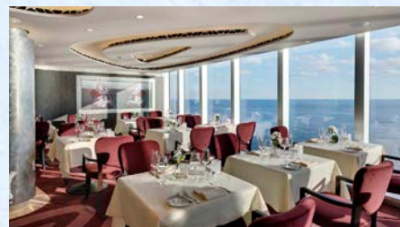
落ち着いた雰囲気でお食事を楽しめるヨットクラブ専用ダイニング専用ダイニングで優雅なひと時を

ヨットクラブのゲスト専用のダイニングがあり、限られた人数の落ち着いた空間でお食事を楽しまいただけます。専用エリアのレストランやバーでのドリンク代は全て含まれておりますので、質の高いお食事とお楽しみいただけます。