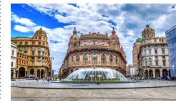
ジェノバのフェッラーリ広場

ドゥカーレ宮殿やコロンブスの生家などもあります。観光と合わせて、バジルをたっぷり使った本場のジェノベーゼパスタ(ペストパスタ)のラン