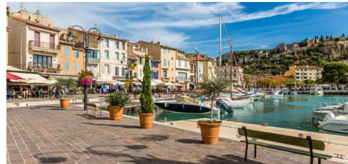
かわいらしい港町カシス