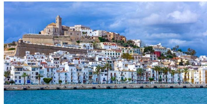
海から見た世界遺産のイビサタウン(イメージ)

海岸線に加え、島と周辺の貴重な生態系が世界的にも希少な世界複合遺産（自然と歴史文化が共存する世界遺産）となっています。高台に残る旧市街は、一歩足を踏み入れれば中世の雰囲気残り、迷路のようでもあります。そぞろ歩きやショッピングも楽しい町です。夕食は地元のレストランにてシーフードをご用意しました。