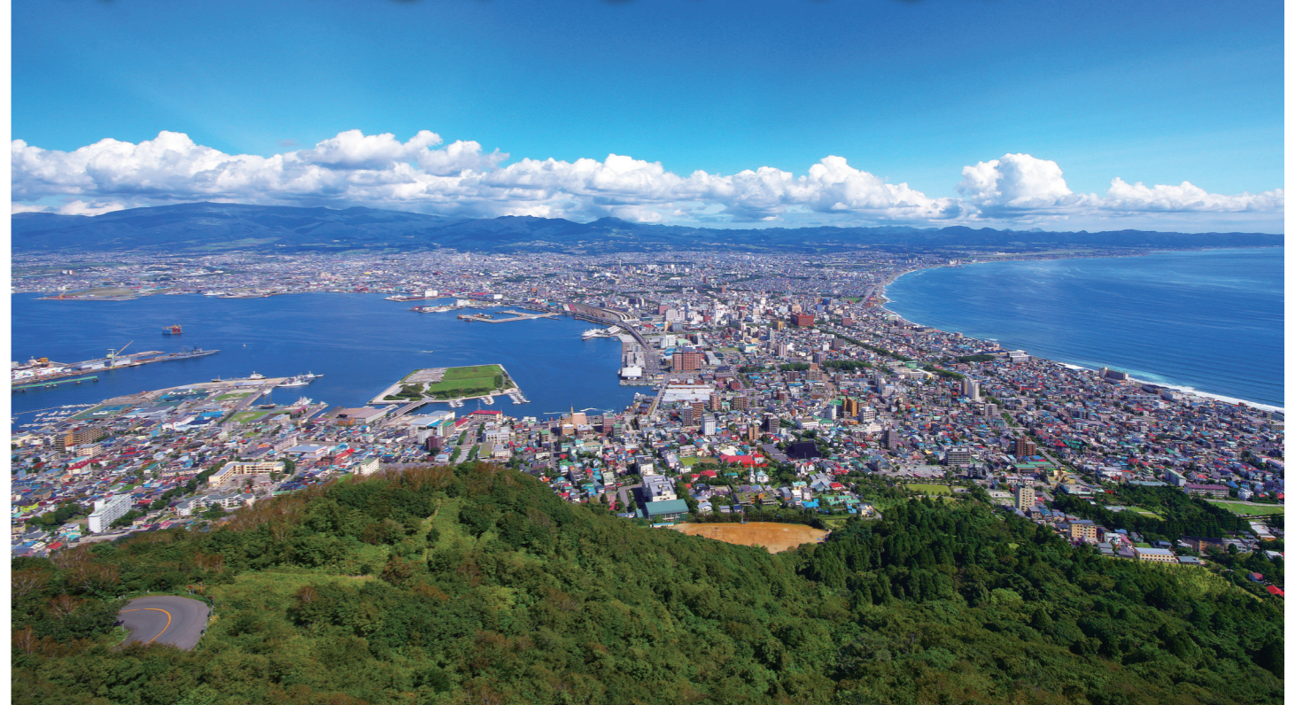
函館山からの眺め。日中の景色も最高です