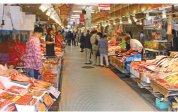
函館朝市で新鮮な海の幸や地元の総菜をお楽しみください