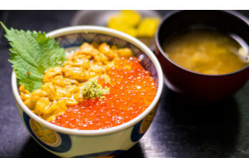
新鮮な海の幸をご賞味ください(イメージ)