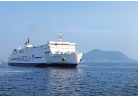
(右上) 函館湾に沿って走る道南いさりび鉄道の旅 (右下) 雄大な大自然が広がる大沼公園 (左上) 函館山と津軽海峡フェリー (左下) 函館の町歩きは市電を利用して