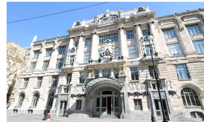
リスト音楽院ではミニ・ピアノ・コンサートをお楽しみください (会場は変更となる場合がございます)

大修復が行われ、創建当初の華麗なアールヌーボー様式の姿が蘇り、現在はブダペストを代表する歴史的名建築のひとつとされています。現在もハンガリーの音楽教育における中枢的役割を果たしているリスト音楽院の新館校舎。今回のプログラムでは見学に加えて、リスト音楽院にてミニ・ピアノ・コンサートをお楽しみいただけます。