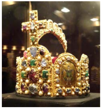
王宮宝物館の展示物(ウィーン)