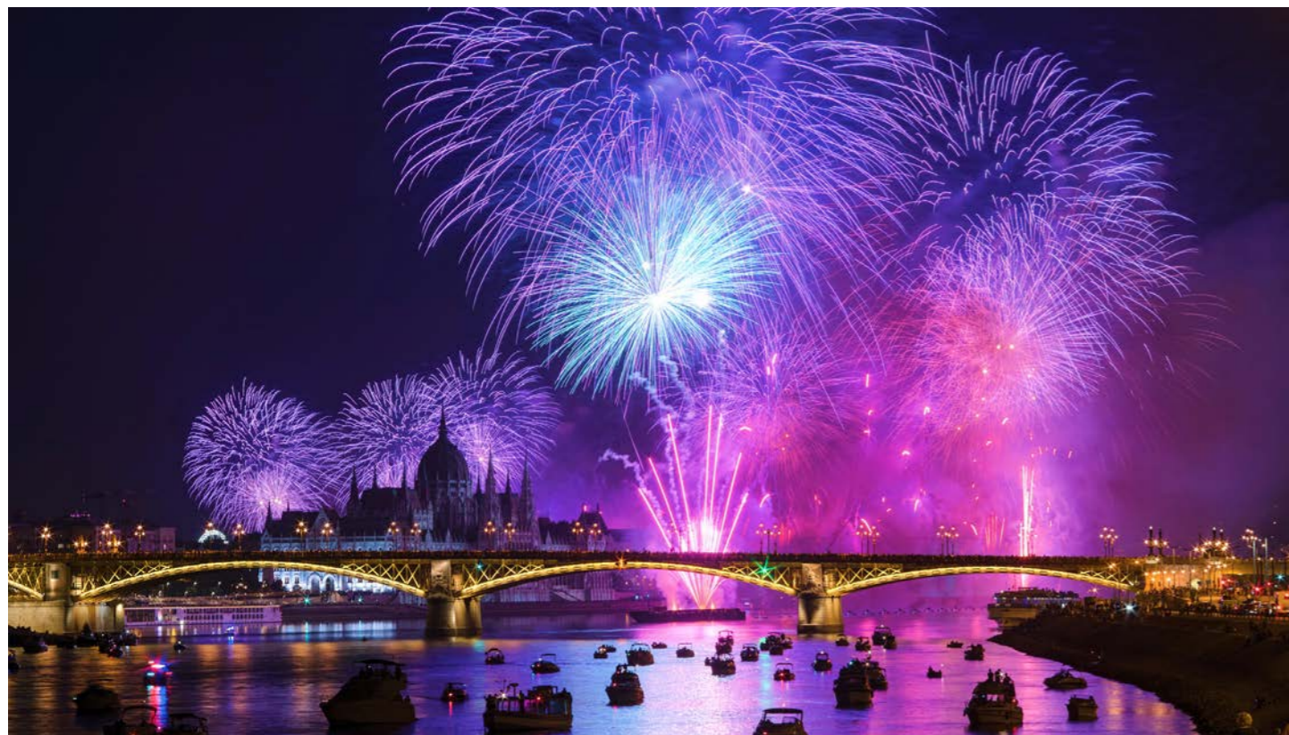
世界遺産の街のライトアップとブダペスト大花火のコラボレーションをお楽しみください (イメージ)