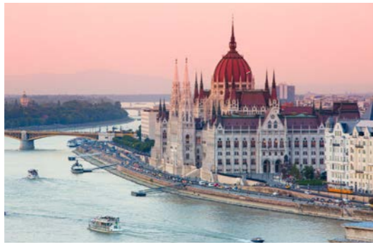
国会議事堂(ブダペスト)