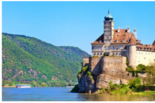
ドナウ随一の景勝・ヴァッハウ渓谷をクルーズします