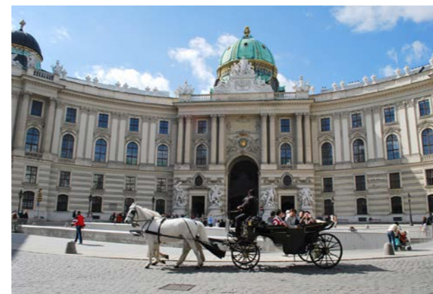
ウィーンの王宮内にある宝物館やシシィ博物館を訪れます

ウィーン王宮内で皇妃エリザベートが実際に暮らした部屋。皇妃愛用の日用品や調度品、肖像画などを展示しながら、皇妃の皇室生活に馴染めなかった私生活、徹底した美への執着、数々の旅、自作の詩などその多彩な資料を通して、自然を愛するバイエルン王国での少女時代から、思いがけないオーストリア皇帝との結婚、1898年にジュネーブにて暗殺されるまでの波乱に満ちた生涯を辿ります。