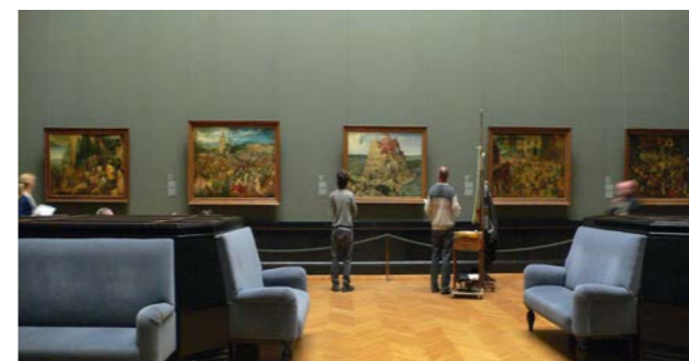
ハプスブルク家の貴重なコレクションに触れる美術史美術館(ブリューゲルの間)

ハプスブルク家の歴代皇帝コレクションを展示するためだけに建てられた世界屈指の規模と内容を誇る豪華な美術館。古代エジプト、古代ギリシャから18世紀末まで幅広い年代の膨大な収蔵品で知られますが、特にルネッサンスからバロック時代の絵画の充実ぶりは目覚ましく、世界最多の点数を誇るブリューゲルのコレクションに加え、ルーベンス、フェルメール、ベラスケス、ラファエロなど世界的に有名な価値ある作品の数々に驚かされます。