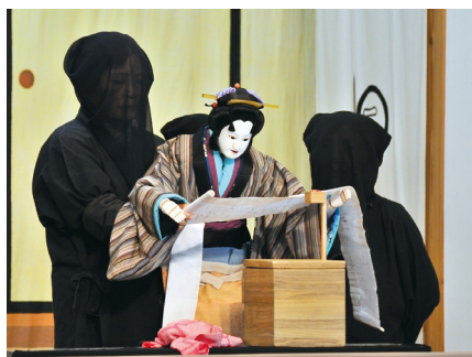
阿波人形浄瑠璃(イメージ)

人形浄瑠璃「傾城阿波の鳴門」のモデルとなった江戸時代の床屋、板東十郎兵衛の屋敷跡で、国の重要無形民俗文化財「阿波人形浄瑠璃」をお楽しみいただきます。阿波人形浄瑠璃は、義太夫節の浄瑠璃と太棹の三味線、3人遣いの人形の三者によって演じられる人形芝居となっており、徳島県が全国に誇る伝統芸能として現在まで受け継がれています。