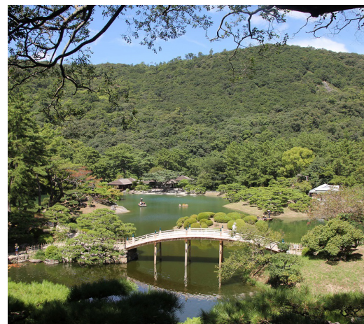
国の特別名勝・栗林公園