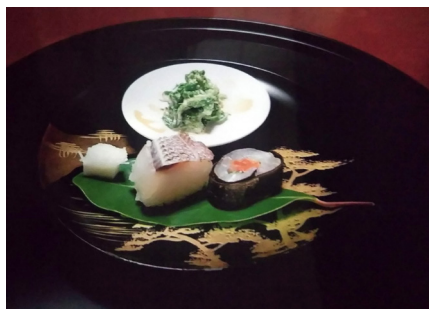
お食事の一品(イメージ)

「吉兆」嵐山本店で修業されたご主人が、自然豊かな故郷・佐那河内村に「虎屋 壺中庵」を構えて35年。吉兆で学んだ心を大切に、村で採れる土地の滋味を清らかにシンプルに生かした料理を目当てに、全国から料理人や食通が訪れる名店です。