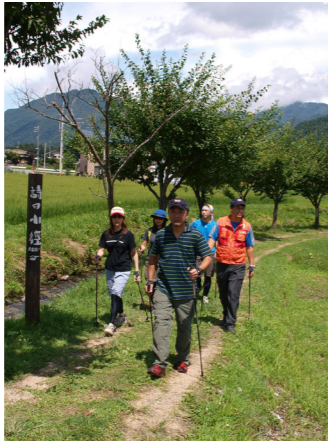
地元マイスターの同行で一層充実した滞在を(イメージ)

「白馬」を楽しませる「匠・職人」として認定された人々、「白馬マイスター」。それぞれのお得意ジャンルに合わせたマイスターが登録され、地元の方でないといけない楽しさを教えてくれます。ツアーでは里山歩き、花を専門としているマイスターが同行。自然の美しさは同じでも、専門家の説明とともに楽しむ里山歩きは、その楽しさが何倍にも広がるとお客様に大変お喜びいただいている好評プログラムです。