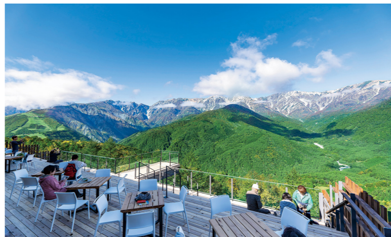
白馬マウンテンハーバー 白馬随一の絶景を望みます(イメージ)

4年目を迎える「夏の北アルプス・白馬滞在の旅」。オーストリア・チロル州のレッチヒ村とも姉妹都市の白馬村は、村の周辺にロープウェイやリフトで簡単に登れる展望台、高山植物園や散策路がとても多く、日本でもこんなに多彩に自然の眺望を楽しめる場所は少ないでしょう。 今年は、宿泊ホテルを白馬の森に位置する「樫の木ホテル」に変更。静かな森に位置し、温泉も楽しめるホテルです。 また、ご好評の「白馬マイスター」同行の里山歩きや、自然や歴史を楽しむカルチャー講座なども開催します。今回は希望により参加できるプログラム(実費)を多くし、リピーターの方にもご参加いただきやすいように工夫を加えました。その日の気分によって、ツアーに参加したり、ホテルでゆっくり過ごし、ご自身のペースでお過ごしいただけます。この夏も日本のチロル、標高700mの高原、白馬村で過ごしませんか。