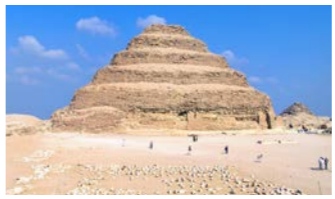
ピラミッドの始まりといわれるサッカラの階段ピラミッド

カイロには2夜停泊中には郊外の見どころへ。3日目には、古代七不思議の灯台と様々な学術書70万冊を集めた図書館があったアレキサンドリア、4日目にはピラミッド巡りへ。サッカラでは最古のピラミッドとして知られるジョゼル王の階段ピラミッド、ダハシュールの屈折ピラミッド、赤のピラミッド(初の真正ピラミッド)にご案内。表装石が崩れ、ピラミッドの建造法を知る手がかりともなったメイトゥームの真正ピラミッドもご覧ください。これは階段、屈折、直線のラインを持つ真正へと、ピラミッドの歴史を辿る行程でもあります。