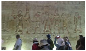
遺跡の大変保存状態が良く、レリーフも見応えがあります

アビドスは初期王朝時代から、死と冥界の神オシリス信仰の聖地でした。ここで最も有名なのは古代エジプト第19王朝のセティ一世が創設し、その没後に息子のラムセス二世が完成させたセティ一世の葬祭殿です。エジプトの数ある葬祭殿の中で最も美しいもののひとつに数えられます。壮麗なレリーフや7つの至聖所をじっくりとご覧ください。