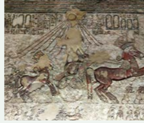
テル・エル・アマルナの地下墓の一部が公開され、躍動感溢れるレリーフもご覧いただけます

テル・エル・アマルナは古代エジプト第18王朝のアクエンアテン(アメンホテプ四世)が、それまでの多神教を廃して太陽神アテンを唯一神とし、遷都した場所。この王の時代に栄えたのがアマルナ美術です。それまでの写実性やバランスが重視された様式とは異なり、若干デフォルメされつつも、生き生きとした人物像が特徴です。都城跡は廃墟となりましたが、王家の墓に残されているレリーフは一見の価値があります。