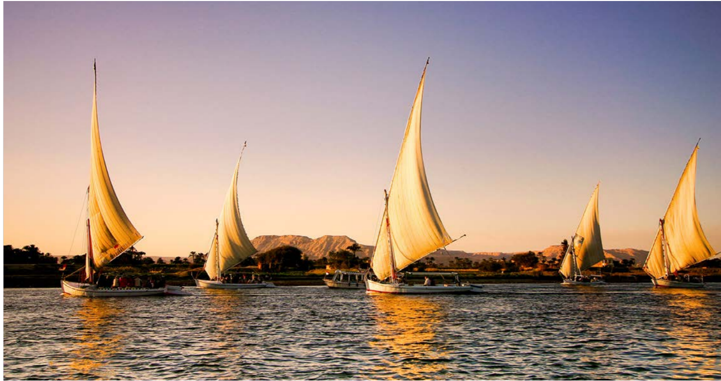
伝統的なファルーカを体験 (イメージ)