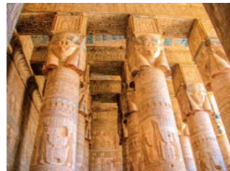
デンデラのハトホル神殿

ナイル川中部を代表する遺跡「デンデラ」は、愛の女神ハトホルの聖地で紀元前4世紀のプトレマイオス朝時代に神殿が築かれました。古代エジプト最後の偉大な宗教建築とされ、何より保存状態が良い神殿です。注目はクオパトラのレリーフ。中部エジプト遺跡の白眉をぜひご覧ください。