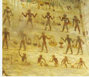
日常の様子が描かれています

ベニハッサンは、4基の岩窟墳墓が公開されていますが、地方豪族の墓だったこともあり内部のレリーフは人々の生活風景を描いているものがほとんどです。狩りや漁の様子、ワイン造りの様子、レスリングをしている風景などが鮮やかに描かれていて、死後の世界を信じていた古代エジプト人が、来世でも豊かな生活を送れることを願って描いた様子が感じることができます。