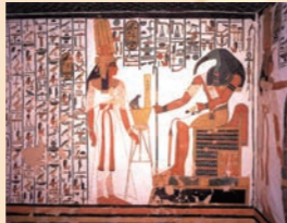
1日あたりの入場者数が制限されている貴重なネフェルタリ王妃の墓にもご案内