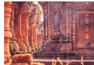
アンコール・ワットより少し建造年代が早いベンメリア遺跡。形が似ていることから「東のアンコール・ワット」とも呼ばれます