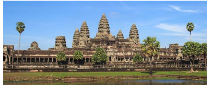
アンコール・ワット 実際に目の前にしたときには感動的です。中央の祠堂は神々が暮らす須弥山を表わしています

に囲まれ、参道、三重の回廊、祠堂、経蔵などから成る、世界最大級の石造建築です。祠堂はヒンドゥー教や仏教で世界の中心にそびえるという須弥山を表わし、5基の尖塔が天空へ伸びるシルエットは実に優美です。光線が正面から当たる午後