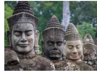
アンコール・トムの南大門に並ぶ阿修羅像

アンコール朝は現在のシェムリアップ周辺を中心に、9世紀から15世紀にかけて続いた王朝でした。最盛期の12世紀から13世紀には、北はラオス、東はタイの東部、南はベトナム南部を占めるに至り、インドシナの強大国でした。この頃にアンコール遺跡を代表する、アンコール・ワットやアンコール・トム(バイヨン寺院)、タ・プロームなどが建設されました。また宗教は仏教が優勢になり、遺跡にはヒンドゥー教の神々