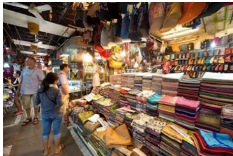
シエムリアップ川沿いのびらぶら散歩もおすすめです。織物をはじめ伝統工芸品のお店も人気です。