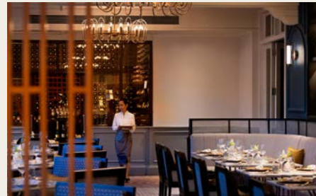
レストラン1932 本格的なクメール料理がお楽しみいただけます

世界中の観光客が集まるアンコール遺跡群。滞在拠点となるシェムリアップには、いくつもの上質なホテルがあります。しかしそのなかで風格と歴史を兼ね備えた名門ホテルといえば、「ラッフルズ・グランドホテル・ダンコール」です。創業はカンボジアが仏領時代の1932年。アール・デコ様式に伝統的なクメール芸術の装飾を生かして設計されました。その後激動の時代をくぐり抜け、1994年にラッフルズの冠がつくようになり大きな修復がなされ、1997年に再オープン。2019年にもリノベーションが施され快適さを増しましたが、昔ながらのクラシックな姿はそのままに。インドシナ最古といわれる木製エレベーターも残されています。優雅な滞在をお楽しみください。