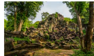
アンコール・ワットより少し建造年代が早いベンメリア遺跡。形が似ていることから「東のアンコール・ワット」とも呼ばれます