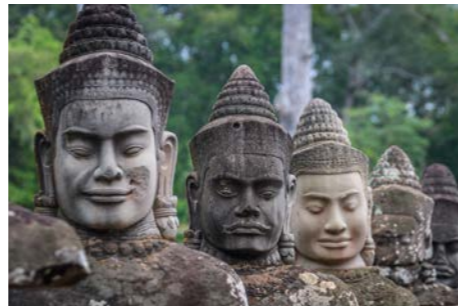
アンコール朝は現在のシエムリアップ周辺を中心に、9世紀から15世紀にかけて続いた王朝でした。最盛期の12世紀から13世紀には、インドシナの強大国でした。この頃にアンコール遺跡を代表する、アンコール・ワットやアンコール・トム（バイヨン寺院）、タ・プロムなどが建設されました。