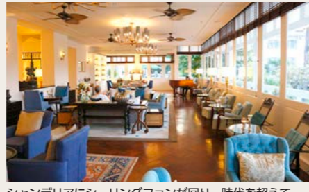
シャンデリアにシーリングファンが回り、時代を超えてエレガントな雰囲気を楽しめます