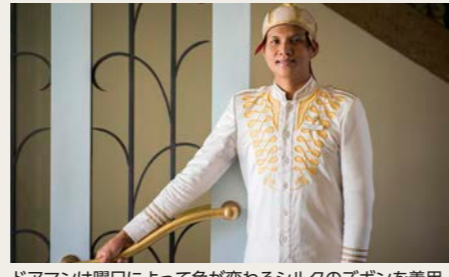
ドアマンは曜日によって色が変化するシルクのズボンを着用。王宮の警備員の伝統にならっているとのこと

※バスタブ付き客室をご用意するよう努めておりますが、各地域の特性や施設の事情及び昨今の世界的な「シャワーのみの客室」増加により、シャワーのみとなる場合がございます。 ※ホテルの★の数の記載に関して 弊社では、これまで各国の正式な評価基準に基づき、利用ホテルの★の数を記載してまいりました。しかしながら、昨今は欧米の大手ホテルチェーンであっても登録のホテルが増えてきていること、★の数が必ずしもホテルの品質を担保するものではない現状を鑑み、ホテルの★の掲載を取り止めております。なお、これまで通りツアー内容やコンセプトに合わせた可能な限り快適なホテル選定を心がけております。