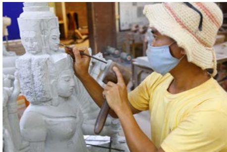
「アーティザン・アンコール」はもともと、カンボジアの文部省とフランスの外務省によって設立された職業訓練校でした。現在はカンボジアの伝統工芸の技術学校とともに、工房と店舗も運営しています。工房では、職人が木彫りや石彫り、磁器などを制作する様子も見学することができます。