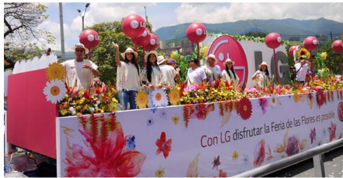
パレードには大きなフロートも登場（イメージ）

担いでいたこの椅子に花を飾り、パレードしたのが始まりだそうです。次第に広がりを見せ、今では花のパレードは3時間にも及びます。踊り子や鼓笛隊なども加わり、かわいい民族衣装を身に着けた老若男女が花々を背負って通りを行進していきます。まさしく花の国、コロンビアを代表するお祭りです。最も盛り上がる最終日にご案内します。