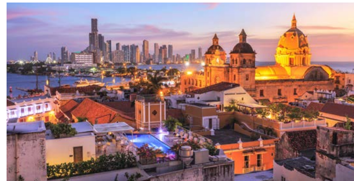
ライトアップされたカルタヘナの美しい街並みの散策もお楽しみください(イメージ)

囲をぐるりと皆で囲みました。その堅固な風景は世界文化遺産に登録され、当時の様子を今に伝えています。このツアーでは2連泊し、日中の旧市街の散策に加え、夜のライトアップされた旧市街もご案内します。連泊するからこそ見られる、夜の古都の表情もお楽しみください。