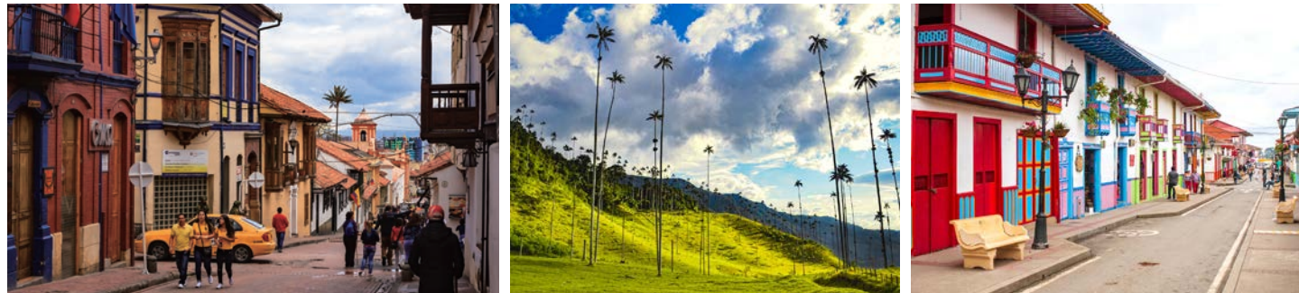
スペイン植民地時代の街並みも残る、コロンビアの首都ボゴタにも2連泊。コロンバ谷ではワックスヤシをご覧いただけます（イメー 周辺のコーヒー集積地、農村サレント 滞在中にはシバキラ、黄金博物館やボテロ博物館を訪ねます）