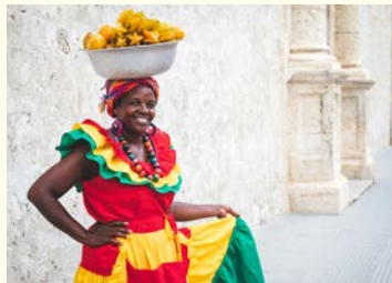
カルタヘナ 民族衣装の女性（イメージ）