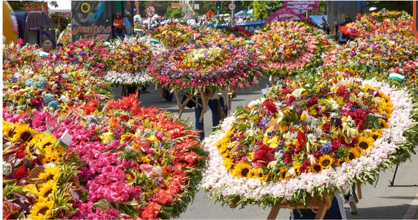
花で飾られたシジェテロ（椅子）を背負って行進（イメージ）