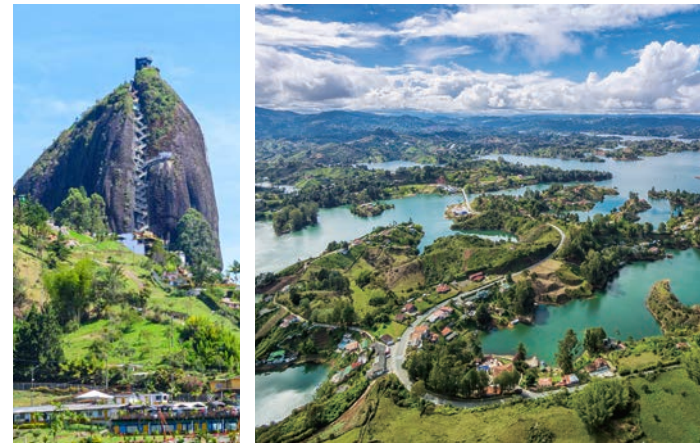
悪魔の塔 740段の階段をのぼり、山頂からの眺望をお楽しみください(左)。悪魔の塔の頂上からは、まるで多島海を見るような絶景を一望できます(右・イメージ)

没し、頂上からは残された陸がまるで島のように点在する美しい景観をご覧くださいませ。またグアタペも訪ねます。人口5000人ほどの小さな町ですが、観光客誘致や治安改善のために町中の家の外壁をカラフルに彩り、観光地として見事に生まれ変わりました。色鮮やかな町の散策をお楽しみください。