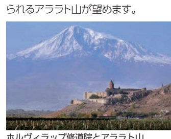
ホルヴィラップ修道院とアララト山

ローマ帝国に先がけて世界初のキリスト教国家となったアルメニア。エレワン近郊にはカトリック教会とは異なる教義を持つアルメニア使徒教会の総本山エチミアジンがあり、敬虔な人々はここでその典礼を守り続けています。また、南に行くと、トルコ国境に位置する、ノアの方舟伝説で知