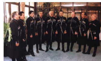
世界無形文化遺産ポリフォニー（イメージ）

ツアー中、世界無形文化遺産に登録されているジョージアの伝統音楽「ポリフォニー」をお聴きいただけます。紀元前1世紀頃から伝承されてきた独自の多声音楽が力強く響きます。また、民族、文明の十字路ならではの食事も楽しみです。