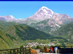
世界でも屈指の絶景ホテル「ルームズ・ホテル・カズベキ」