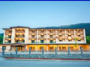
秘境メスティアに新しく快適なホテル「ジストラ」が完成しました