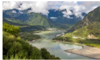
車窓からの景観も圧巻です(イメージ)

(7782メートル)を展望することができます。成都から空路で向かいますが、まるでヒマラヤ遊覧飛行のような絶景をご覧いただけます。