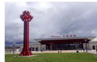
シガツェ駅 ラサへの帰路は高速鉄道を利用

シガツェはラサに次ぐ、チベット第二の町。市街こそホテルなどが見られますが、旧市街は今もチベット人が多く暮らしています。チベット仏教の最大宗派・ゲルク派の六大寺院のひとつ、タシルンポ寺が見どころのひとつ。寺の周囲には市場も見られ、チベット人の暮らしが垣間見ることができそうです。シガツェへは2023年に完成した高速道路に乗ってバスで向かい、帰路は高速鉄道に乗ってラサに戻ります。