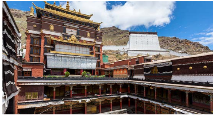
タシルンボ寺 シガツェ最大のゲルク派寺院