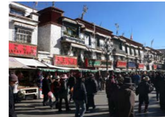
ラサのメインストリート、バルコル(八角街)を散策

ト旧市街、チベット全土から巡礼者が訪れる大昭寺徒歩圏内のホテルに計3泊しますので、ホテルを起点に存分にチベットの風情をお楽しみください。