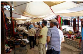
人々の暮らしがにぎやかな市場散策