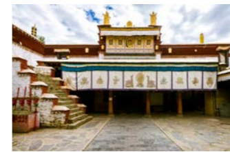
ソンツェン・ガンポが建てた寺院のひとつ、タントク寺

山南の平均標高は、3500メートルほど。ここで連泊してもう一度高度順応し、いよいよ3650メートルの地にあるラサを鉄道で目指します。