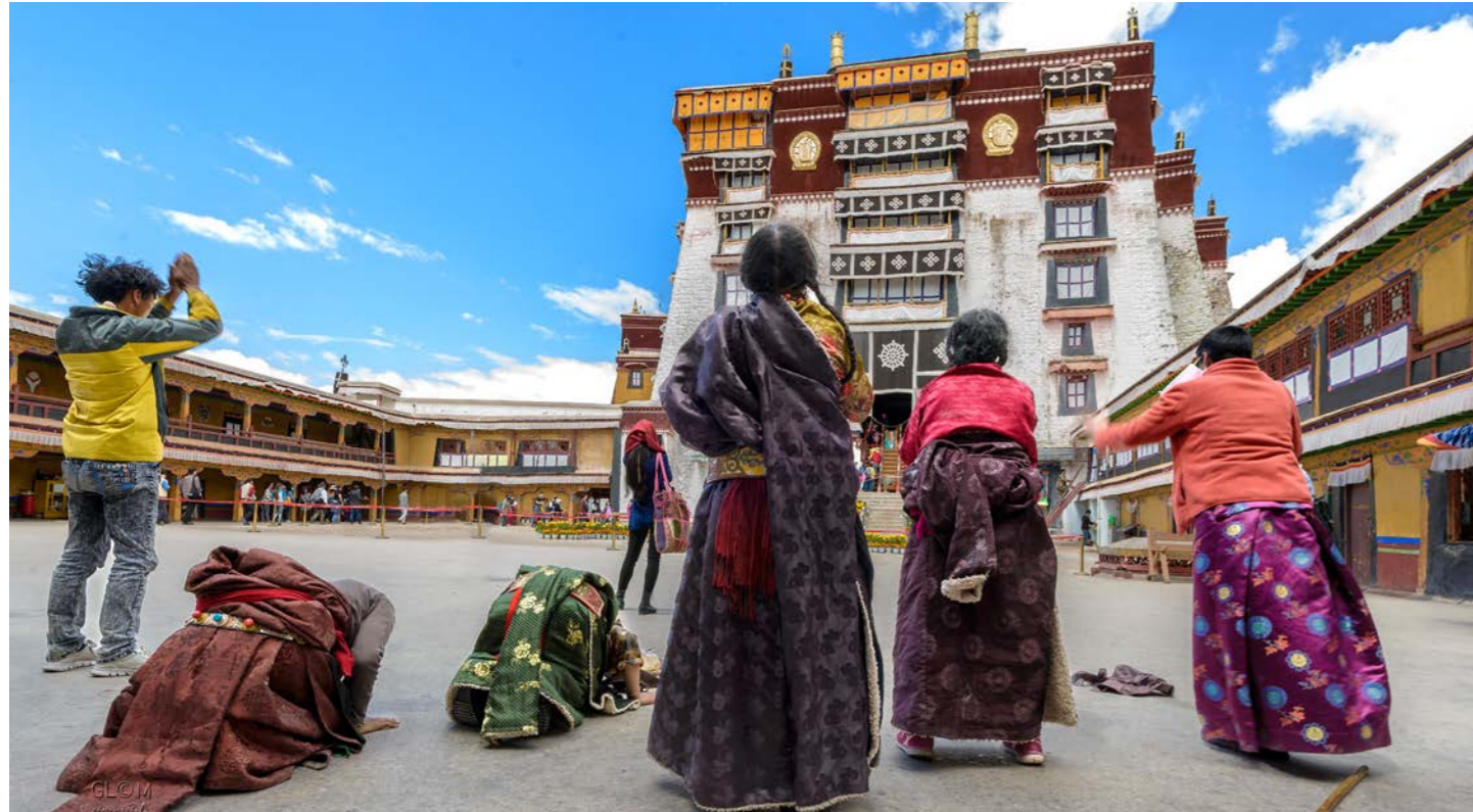
ポタラ宮に向かい、五体投地をするチベット人も見られます