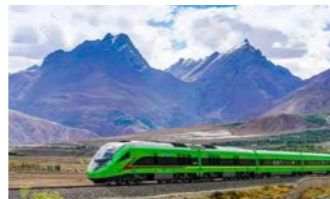
車窓からの景観も圧巻です(イメージ)

酸素供給システムが取り入れられて常時車内に酸素が送られるとともに、緊急時にも対応できるようになっています。快適に車窓から覗くチベット高原を眺めながら、ラサへ向かいます。