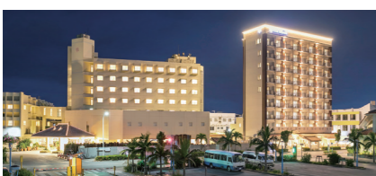
旅の後半に宿泊するホテルは離島ターミナル至近の「南の美ら花ホテルミヤヒラ」です

観光に合わせて宿泊する立地にもこだわりました。石垣島の初泊は石垣島北部のホテルをご用意。2018年に日本初の星空保護区に認定された西表石垣国立公園。特に北部の平久保エリアは人里もなく星空観賞に適したエリアです。花だけでなく星空もお楽しみください。2泊目は宿も少なく予約が難しい西表島のホテルに宿泊。朝夕にしか見ることができないサガリバナをスムーズにご覧いただける行程としました。旅の後半は石垣島に戻り連泊。宿泊は離島ターミナルに至近のホテルです。自由行動の時間もお取りしていますので、市内を散策したり、竹富島を訪れたりと気ままな島時間をお過ごしいただけます。