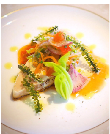
島の食材を存分に活用したイタリアンをお楽しみください(イメージ)

これまで「沖縄は食事が苦手」といった声も多く、また小さな島の限られたレストランで団体で予約を取れるレストランは少ない