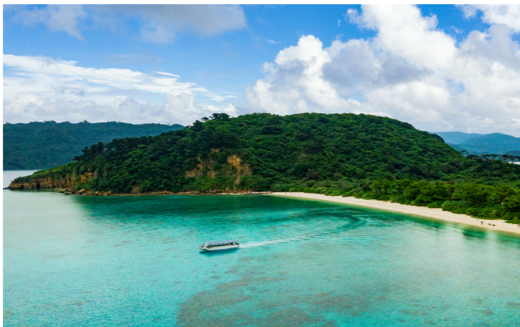
西表島の最奥、「船浮集落」にあるイダの浜(イメージ)

■最少催行人員：10名様 ■食事：朝食4回、昼食3回、夕食4回 ■添乗員：羽田空港ご出発時から、羽田空港ご到着時まで同行します。 ■ホテル：石垣島(1日目)/ナータ・ピーチヴィラホテル(洋室・シャワーのみとなります。)、西表島/ヴィラウナリざき(洋室)、石垣島(3、4日目)/南の美ら花ホテルミヤヒラ(洋室) ■利用予定バス会社：東海交通観光会社または同等クラス ■利用予定航空会社：日本航空または全日空(普通席)