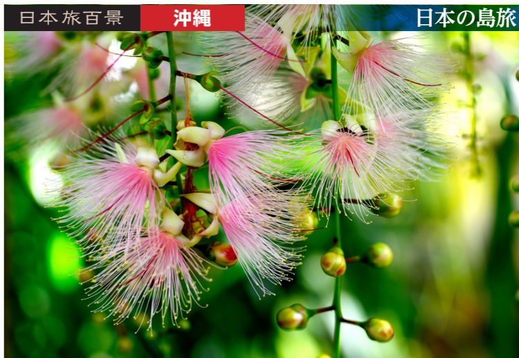
幸せを運ぶ幻の花を求めてサガリバナを観賞します(イメージ)