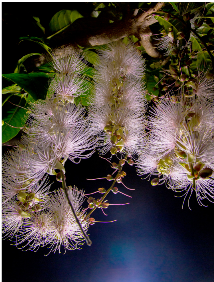
一夜しか咲かない幻の花「サガリバナ」の季節です(イメージ)