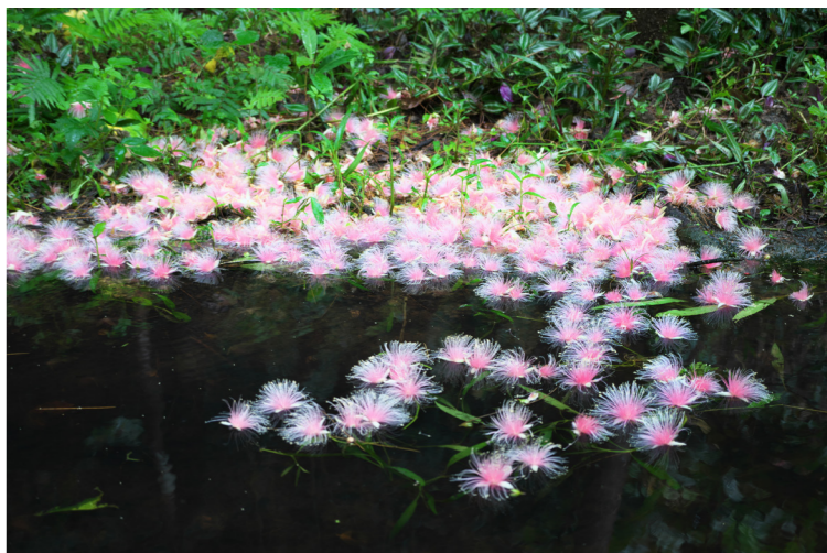
幻想的な川面に浮かぶサガリバナに出会うチャンスです(イメージ)