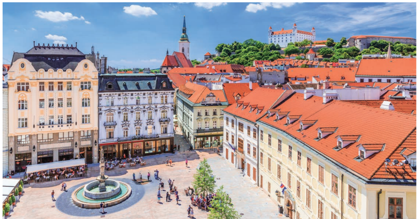
スロバキアの旧市街の中心、フラヴネー広場。奥にはブラチスラバ城がそびえています(イメージ)