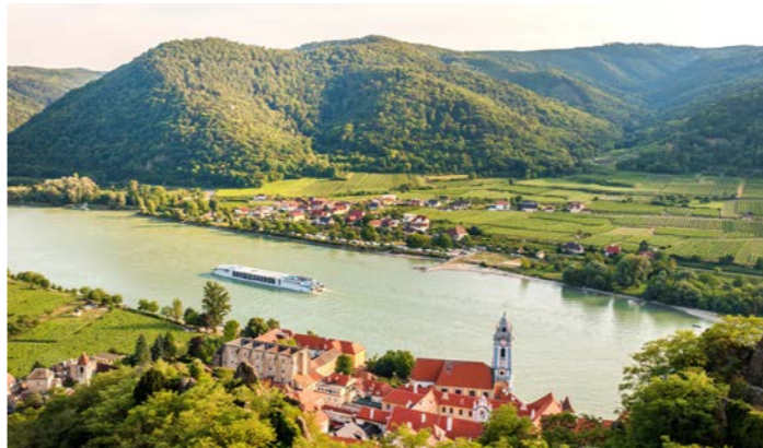
世界遺産ヴァッハウ渓谷をクルーズ。河岸にはブドウ畑が広がり、昔ながらの小さな町や古城が現れます(イメージ)

と言えるのが、1000年以上の歴史を持ち、バロック建築の至宝と謳われるメルク修道院。煌びやかな装飾や天井のフレスコ画、10万冊ともいわれる蔵書や貴重な中世の写本などが収められる図書室などが見どころです。