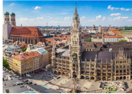
壮麗な建築が並ぶミュンヘン

ミュンヘンは700年以上にわたり南ドイツのバイエルン地方を治めたヴィッテルスバッハ家のお膝元。歴代王の居城であるレジデンツやネオゴシック様式の新市庁舎など壮麗な建築が立ち並びます。市内の名所や充実の古典絵画コレクションを収めるアルテ・ピナコテークの見学のほか、自由時間もお取りしていますので、さらなる芸術鑑賞や街歩きなど、思い思いにお過ごしください。