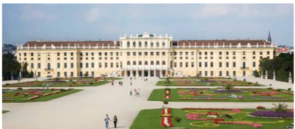
ウィーンではシェーンブルン宮殿にご案内

ドナウ川の船旅をゆったりと楽しみながら、オーストリアのウィーン、ハンガリーのブダペスト、そしてスロバキアのブラチスラバと中欧の三都を巡ります。4日目にご案内するブラチスラバは、ウィーンやブダペストに比べて知名度は低いものの、ヨーロッパの古都風情を十分に味わえます。街のシンボルであり、旧市街の入り口のひとつ、ミハイル門や中心の広場フラヴネー広場にご案内します。