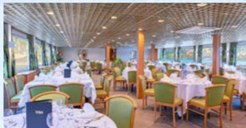
レストランからも景色が楽しめます