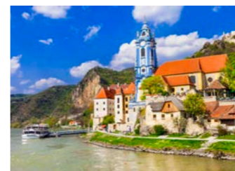
水色の塔が印象的なデュルンシュタイン

ドナウ川に映える修道院の水色の塔を中心に、中世そのままの町並みが残されたデュルンシュタインは、端から端まで歩いて15分ほどのかわいらしい小さな町です。川沿いには古い城壁が残り、町の上にはイギリスのリチャード獅子心王が幽閉された砦の跡が残っています。