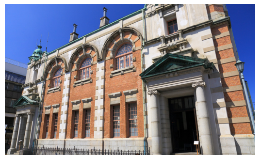
平成9年まで銀行として使用されていた旧唐津銀行

唐津は城下町として、今でも当時の街並みが残る情緒あふれる街。その中でもひとときわ目を引くのが、「辰野金吾記念館(旧唐津銀行)」です。東京駅や日本銀行本店を設計した辰野金吾、実は唐津の出身。彼の弟子、田中実氏が設計した旧唐津銀行は、赤煉瓦に白い御影石の特徴的な外観に王冠のようなドームが目立つ「辰野式」で建てられました。