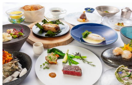
長崎の海の幸、山の幸を使用した夕食(イメージ)