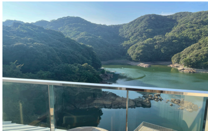
お部屋からは緑豊かな入り江がご覧になれます(イメージ)

入り組んだ入り江と深い緑に囲まれた島に、圧倒的な外観で建つオリーブベイホテル。この設計を手掛けたのは隈研吾氏。周りの豊かな自然と調和することをコンセプトにしています。陶板のレリーフや和紙の照明など、内装にもこだわったホテルで上質な寛ぎの時間をご堪能ください。