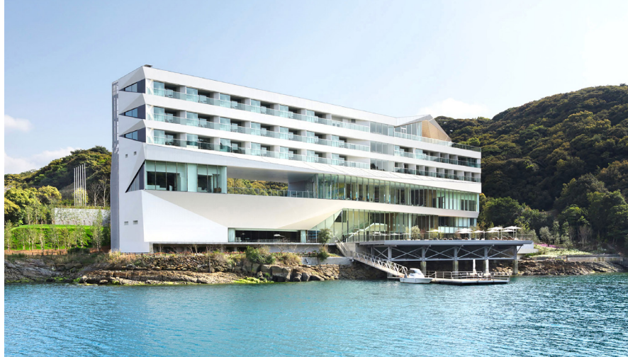
世界的建築家・隈研吾氏による設計、全32部屋のスモールラグジュアリーホテルです

■最少催行人員：10名様 ■食事：朝食3回、昼食2回、夕食3回 ■添乗員：羽田空港ご出発時から羽田空港ご到着時まで同行します。 ■ホテル：唐津 / 唐津シーサイドホテル(洋室) 海に面した客室をご用意しております。長崎県大島 / オリーブベイホテル(洋室) 湾に面した客室をご用意しております。 ■利用予定バス会社：マリン観光バスまたは同等クラス ■利用予定航空会社：日本航空(普通席)