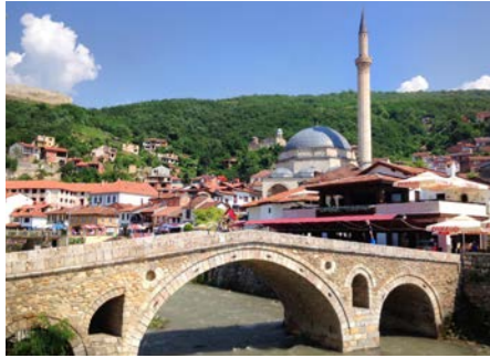
コンボの古都プリズレン。オスマン対する「プリズレン同盟」を決議した町としても知られます