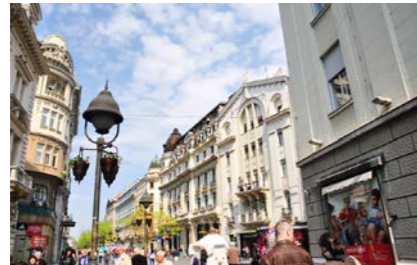
セルビア ハプスブルグの薫り漂うノヴィ・サド

「7つの国と国境を接し、6つの国から成り、5つの民族が住み、4つの言語を話し、3つの宗教を信じ、2つの文字を使う。それでも国は1つだ。」かつてこう表現された旧ユーゴスラビア。その国も分裂を繰り返し、ここから7つの国が生まれました。これらの国々は長い歴史の中で、ヨーロッパやイスラム圏など、様々な文化の影響を受けてきました。今回はこれらの国々の中からセルビア、ボスニア・ヘルツェゴビナ、モンテネグロ、マケドニア、コソボ、そして旧社会主義時代に鎖国政策を取り、独自の道を歩んできた未知なる国アルバニアも訪問します。移動の多い周遊の旅ですが、連泊を4か所まで設けてゆとりを持たせています。バルカン半島の個性ある国々の魅力を存分にご堪能ください。