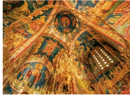
グラチャニツァ修道院内部には傑作のフレスコ画が保存されています