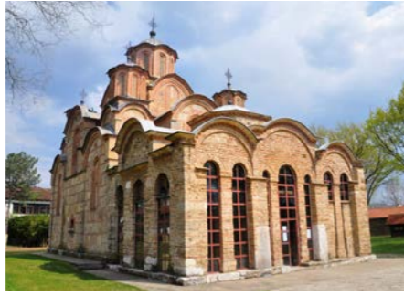
首都プリシュティナ近郊にあるグラチャニツァ修道院は、セルビア正教の聖地のひとつ