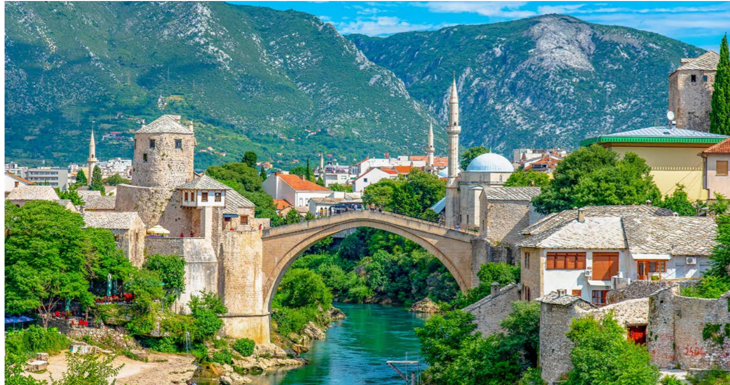
ボスニア・ヘルツェゴビナ オスマン帝国風とハプスブルグ風の町並みが共存し、異なる文化が織りなす独特の雰囲気を持つモスタール