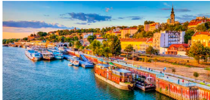
オスマン帝国の影響を受けたセルビアの首都ベオグラード

オスマン帝国の影響を受けたセルビアの首都ベオグラード。一方、第2の都市ノヴィ・サドはハプスブルク家の支配を受け、キリスト教の影響が残っています。セルビアの2つの異なる文化と街並みをお楽しみください。