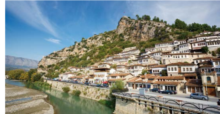
「千の窓の町」と呼ばれるベラット

1990年頃まで鎖国状態にあった、まさに知られざる国アルバニア。オスマン帝国時代の居住区が世界遺産に登録されるベラットでは、宿泊して独特の町並みをじっくりご覧いただけます。山肌に張り付くように並ぶ家々は、壮観で「千の窓の町」と呼ばれるのも納得です。