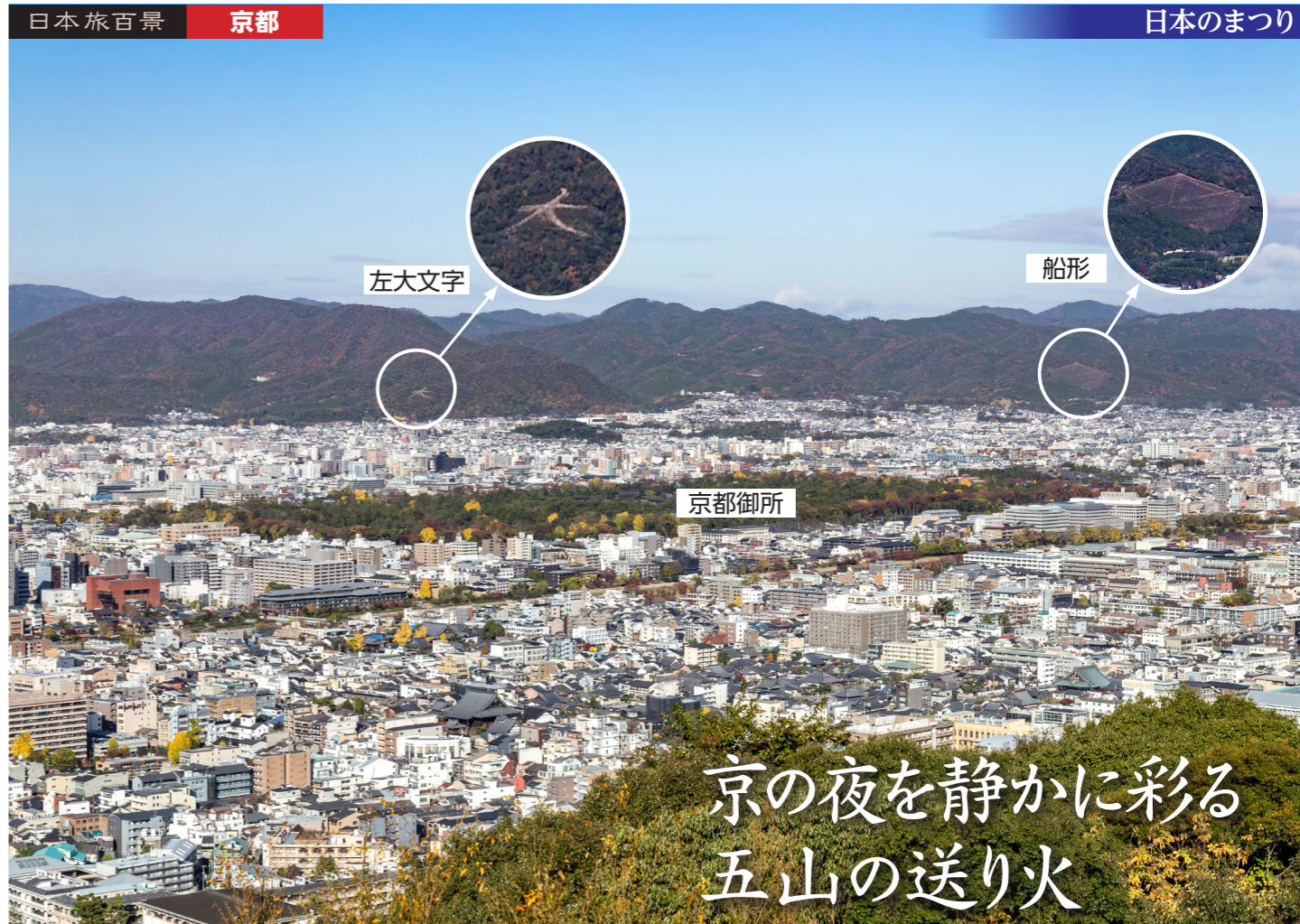
青龍殿大舞台から望む北西方向の日の中写真(夜をお楽しみに)