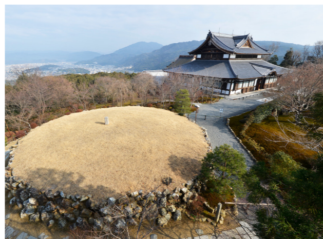
青龍殿と將軍塚(イメージ) 右側の青龍殿の奥が大舞台で京都市内が一望できます

夏の夜空を彩る「京都五山送り火」は、祇園祭とともに京都の夏を彩る風物詩で、お盆の精霊を送る伝統行事です。この送り火は、東山如意ヶ嶽の「大文字」、金閣寺附近、大北山にある大文字山の「左大文字」、松ヶ崎西山(万灯笼山)と東山(大黒天山)の「妙法」、西賀茂船山の「船形」および嵯峨鳥居本曼荼羅山の「鳥居形」があり、これが8月16日の夜に点火されます。送り火そのものは、お盆の翌日に行なわれる仏教的行事であり、お盆に地上へ帰られたお精霊さんを冥界に送る意味を持ちます。