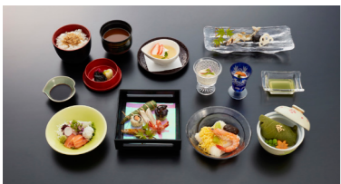
(上)貴船荘 (下)川床での料理(イメージ)