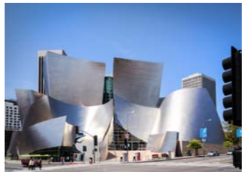
ロサンゼルス・フィルハーモニックの本拠地、 ウォルト・ディズニー・コンサートホール