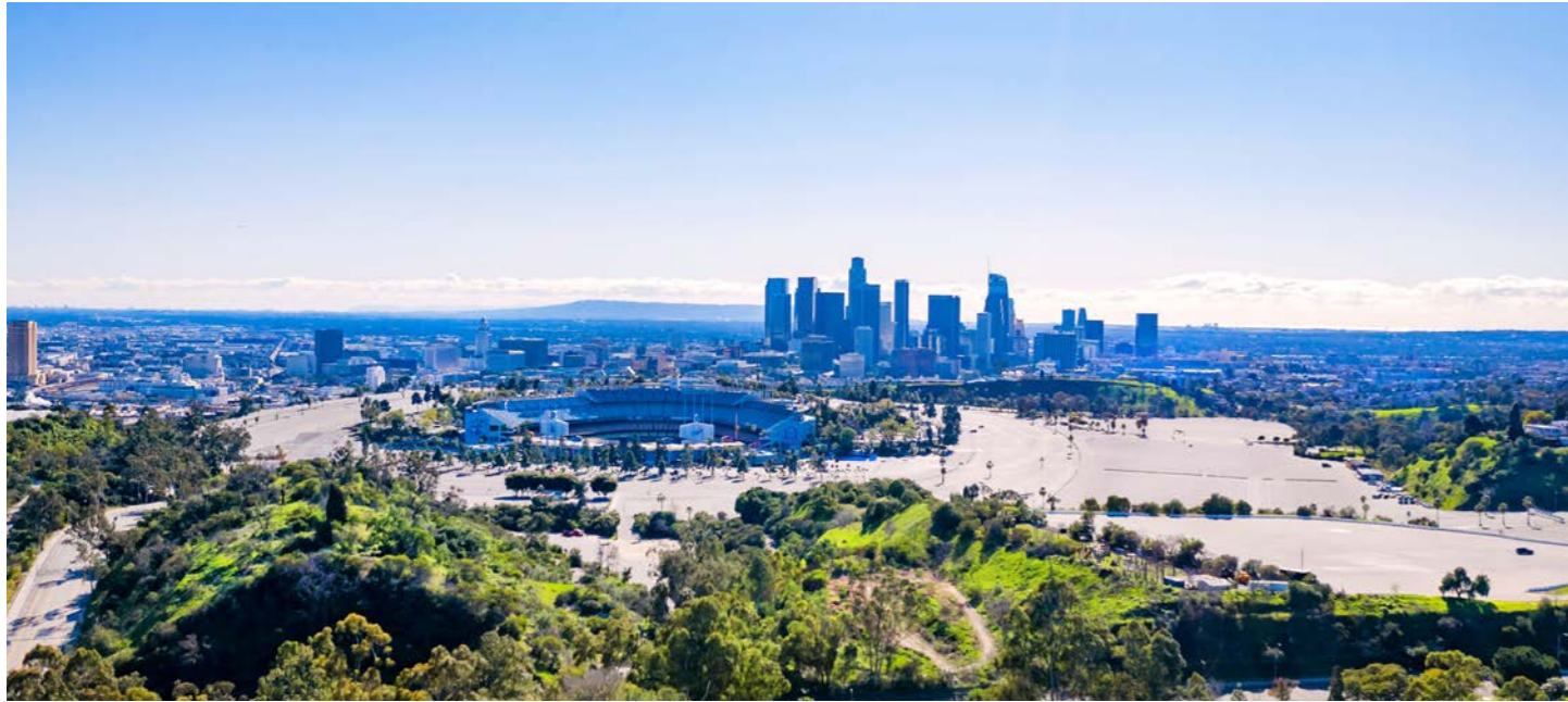
町外れの高台に建つドジャー・スタジアム。ダウンタウンからのアクセスも良好です。