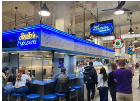
グランドセントラルマーケットには、話題の店舗も入り地元の人で賑わいます