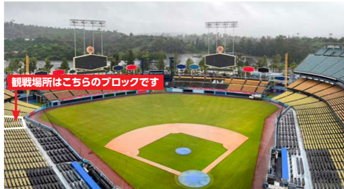
観戦場所はこちらのブロックです

あ の「二刀流」選手と野球日本代表のエースが今シーズンからそろって移籍し、話題のロサンゼルス・D。この目で見たい!と思う皆様へ、朗報です。本拠地「ドジャー・スタジアム」での2試合観戦を組み込んだ、野球ファン垂涎のツアーを発表します。本場でしか味わうことの出来ない臨場感と興奮をお楽しみください。またスタジアムまでの往復移動は、ミニバスをご用意しました。試合開始前に写真を撮ったり、チームストアでお買い物を楽しんだり、時間に余裕をもってスタジアムへご案内します。