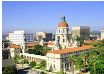
ロサンゼルス郊外パサデナにも足を伸ばします