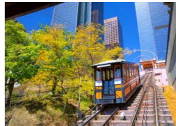
世界一短い木製ケーブルカー エンジェルスフライト

ロサンゼルス滞在中には、1901年に運行を始めた世界一短い木製ケーブルカーのエンジェルスフライトの乗車、市民の台所であるグランドセントラルマーケット訪問など町の歴史に触れるダウンタウンの街歩きをお楽しみいただけます。町の再開発で誕生した新名所めぐりも滞在中の楽しみでしょう。また公共バスだけでなくメトロや郊外電車も発達しており、広大な町ですが意外と動きやすく、ハリウッドやパサデナにも簡単にアクセスできます。終日自由行動の際には、ご希望の方をザ・ブロードや全米日系人博物館へご案内します。ザ・ブロードは現代美術を扱った美術館で、アンディ・ウォーホルやジェフ・クーンズ、草間彌生、リキテンシュタインなど感性を刺激する作品群は一見の価値あります。事前予約制ですが、入場無料なのが嬉しい、おすすめの美術館です。