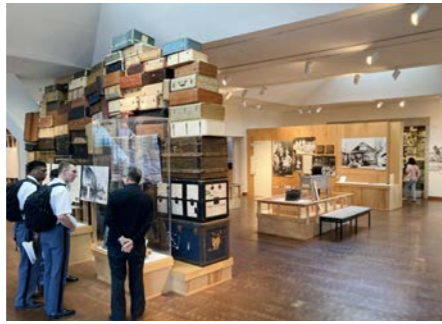
ご希望の方は全米日系人博物館へご案内します