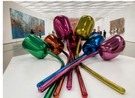
ザ・ブロード館内は広々としています