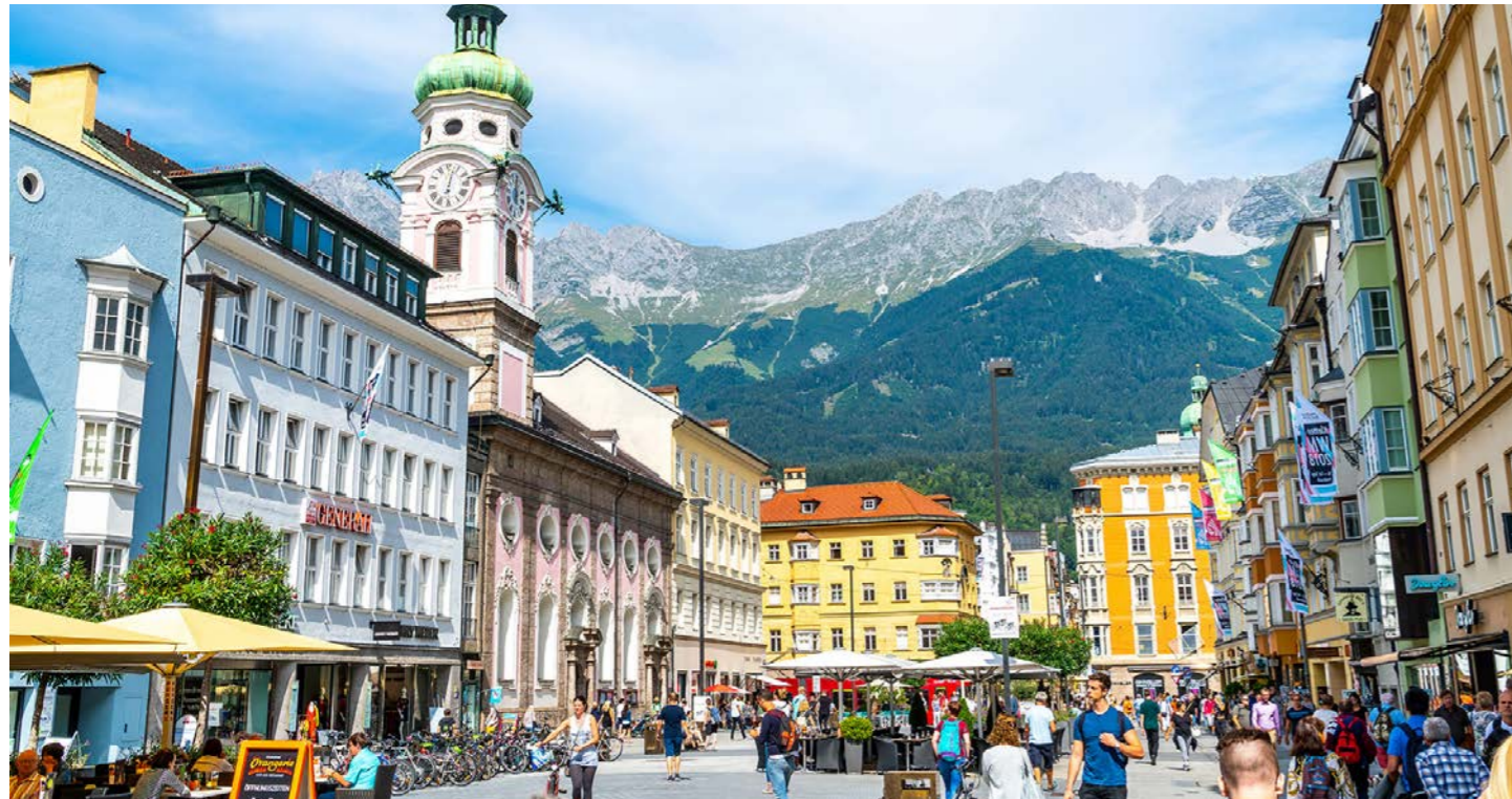
インスブルック 賑やかなマリア・テレジア通り (イメージ)