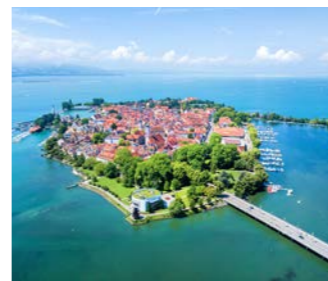
ボーデン湖に浮かぶリンダウの街(イメージ)

ザンクト・ガレンの北には、スイスとオーストリア、ドイツの国境にまたがるボーデン湖畔があり公共交通機関で簡単にアクセスできます。ボーデン湖畔に浮かぶ島リンダウは夏には多くの観光客で賑わいます。神聖ローマ帝国時代には、自由都市として自治権を認められ、その栄華を残す歴史的な建物がよく残されています。