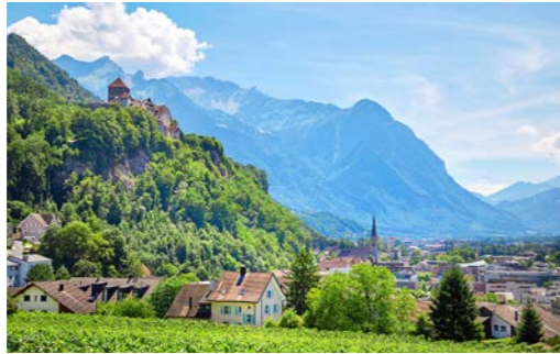
街を見下ろすファドゥーツ城と街並み (イメージ)

スイスとオーストリアに挟まれた小国、リヒテンシュタイン。首都ファドゥーツには、街を見下ろすようにお城が聳え、目抜き通りには優美な建築が並び、美しい切手を発行する国としても知られます。観光局では記念のスタンプも押してもらえますので、訪れた記念には是非どうぞ。