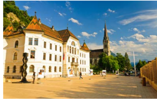
ファドゥーツの散策を楽しみます