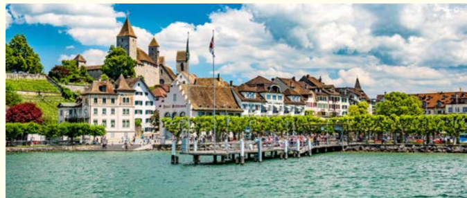
チューリッヒ湖畔の美しい町ラッパーズヴィル