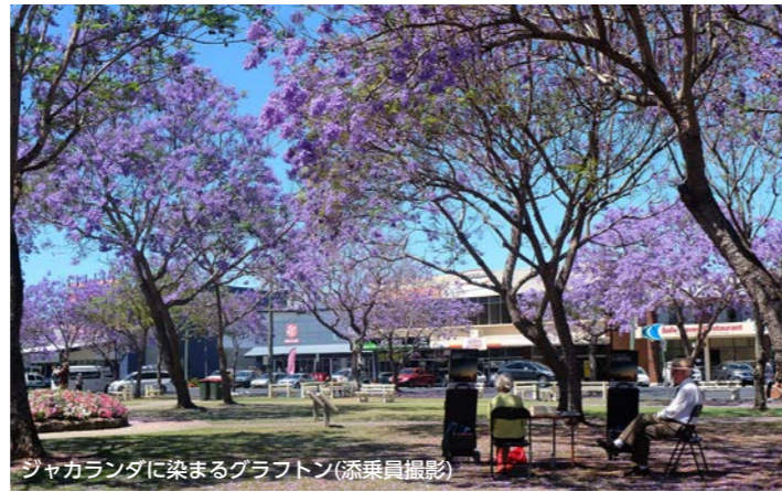
ジャカランダに染まるグラフトン