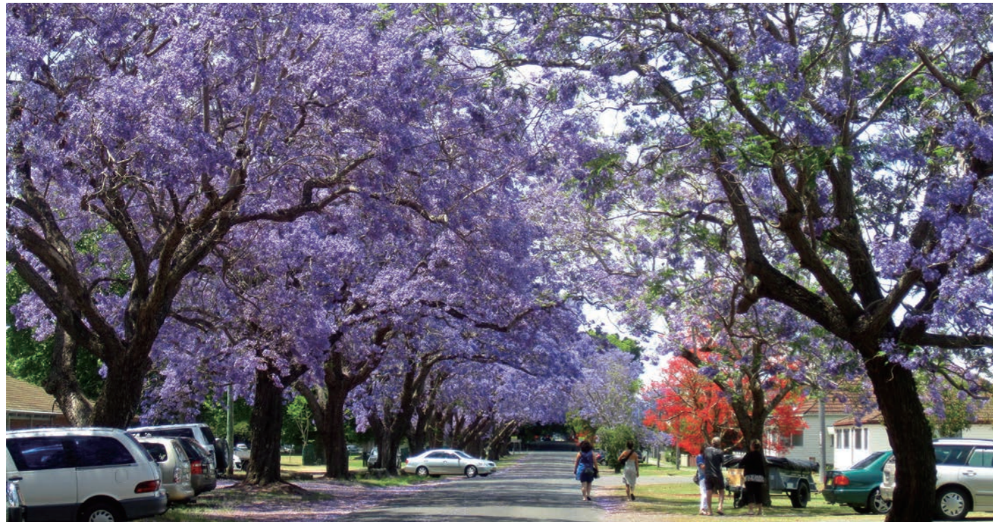
ジャカラングの並木道が続くグラフトンの町 (イメージ)