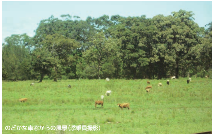
のどかな車窓からの風景