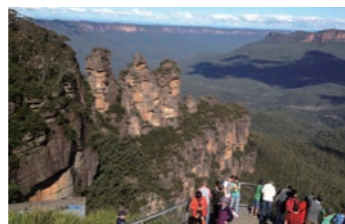
奇岩スリーシスターズ

帰り観光が多いのですが、このたびはブルーマウンテンズ近郊にホテルを確保。ここに2泊することで、太古の山並みと奇岩が織り成す絶景をお楽しみいただけます。