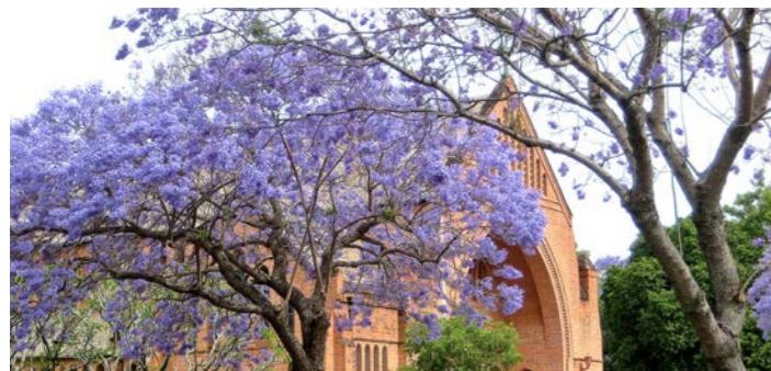
町のいたるところにジャカラングが咲いています (添乗員撮影)

オーストラリアが春を迎える10月、東海岸沿いの町々では、薄紫色のジャカラングの花々が咲き誇ります。とりわけグラフトンという町はあまり知られていませんが、ジャカラングのトンネルのような並木道が幾筋にもび、薄紫色に包まれた美しい風景の中でゆったりと散歩を楽しむことができます。ツアー発表以来、「南アフリカに勝るとも劣らない、世界でも指折りのジャカラング」と評判の地に2連泊します。また、前半には世界自然遺産のブルーマウンテンズへ。深い緑の森と切り立った岩壁が地平線まで続く景観はあまりのスケールの大きさに驚くばかりです。マレーシア航空ビジネスクラスを利用し、春めくオーストラリアへご案内します。