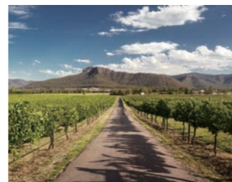
およそ70のワイナリーを抱え、国内の3割以上のワインを醸造するハンターバレー

オーストラリアワイン発祥の地であり、1800年初頭からの歴史を誇るハンターバレーも訪れます。シラーズ、セミヨンを中心に生産しており、特にセミヨンは「ハンター・セミヨン」として知る人ぞ知るワインで、50〜60年熟成させて飲まれることもあります。ワイナリーを訪ね、ランチや試飲をお楽しみいただけます。