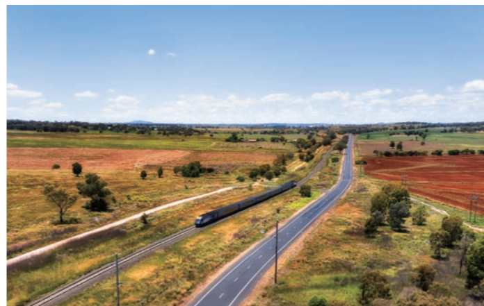
オーストラリアの大地を走り抜ける高速鉄道 (イメージ)

としてシドニーを基点とする5つの路線を有しています。窓一面に広がる牧歌的な風景を眺めながら、地元の人々に混ざっての鉄道の旅をお楽しみください。