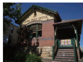
郵便局の建物は1917年のものです

19世紀後半の町並みを今に残すルーラも訪れます。日本で言うところの軽井沢のような雰囲気、花の町としても知られます。メインストリートであるルーラモールには昔ながらの建物を改装したレストランやカフェ、アンティークショップが軒を連ねます。