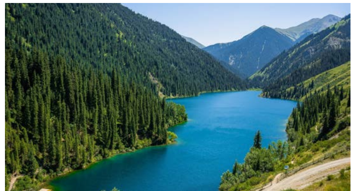
カザフスタンの真珠と称されるコルサイ湖

の景色を求め、国内外から多くの方が訪れます。コルサイ湖に程近いゲストハウスに宿泊し、湖畔の散策や足漕ぎボートでの遊覧をお楽しみください。