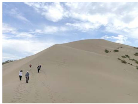
シンギングデューン (歌う砂丘) ご希望の方は砂丘の上まで歩いてみましょう