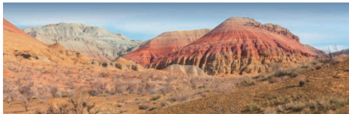
多様な色彩の地層美しいアクタウ山