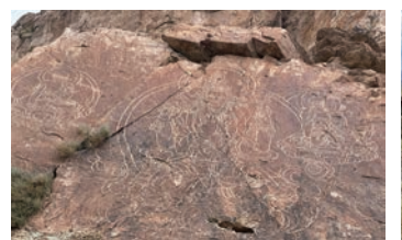
タムガリ・タス岩絵

105m、高さ17mと国内最大規模を誇り、草原に囲まれた何もない場所ながら、巨大クルガン(積石塚)の上に登り周囲を見渡すと、ここが神聖で特別な場所であることに納得します。