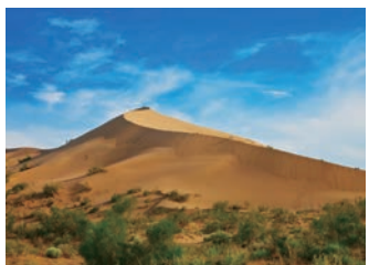
高さ150メートルにも及ぶアイガン・クム砂丘

100キロ以上におよび、グランドキャニオンに劣らない迫力の景観が広がります。背後に聳える天山山脈を望みながら散策をお楽しみください。