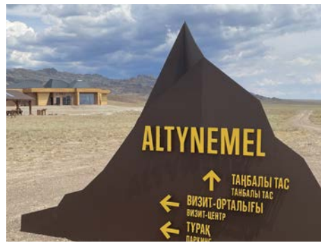
アルティン・エメル国立公園