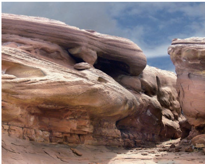
長年の風雨によって不思議な形に変化したカクタウ山

たような景観をご覧いただけます。また、山間部に忽然と姿を現す砂丘アイガン・クムなど、まさに自然の芸術作品ともいえる見どころが数多くあります。今回は国立公園内のゲストハウスに連泊し、観光の時間をたっぷりとお取りしました。