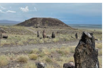
ベスシャトル埋葬地