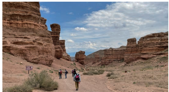
チャリン・キャニオンではハイライト区間のトレイルを歩きます