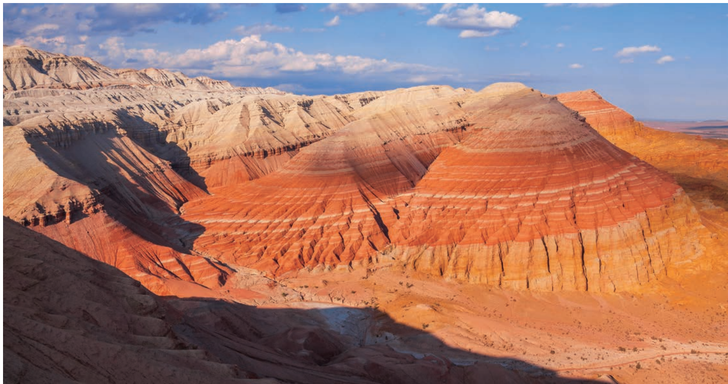
アルティン・エメル国立公園 (イメージ)