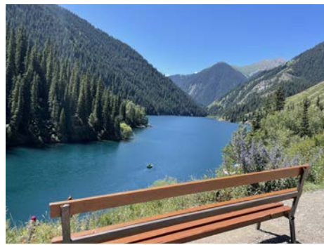
カザフスタンの真珠、コルサイ湖 湖の周囲をのんびり散歩するのもお勧めです