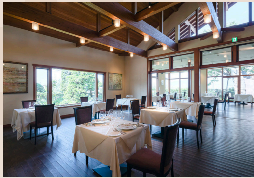
ルミエールワイナリー併設のレストラン「ゼルコバ」