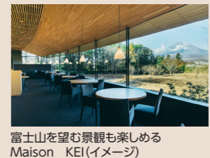
富士山を望む景観も楽しめる Maison KEI(イメージ)

メゾン・ケイ・シェフ: 佐藤充宜 三重県生まれ。2006年エコール 辻 大阪にて学び、2007年から「ヌキテパ」など東京都内のレストランにて勤務。2011年に24歳で渡仏、地方のレストランなどを経て、2015年から「Restaurant KEI」にて勤務。2021年「Maison KEI」シェフに就任。