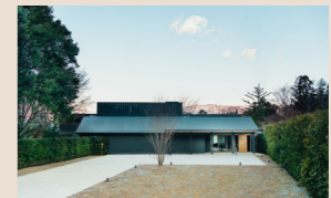
とらや赤坂店などを設計した内藤廣による建築